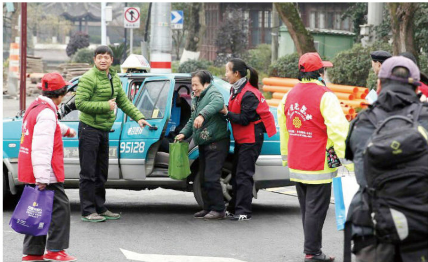
■ 爱心出租车队 与志愿者