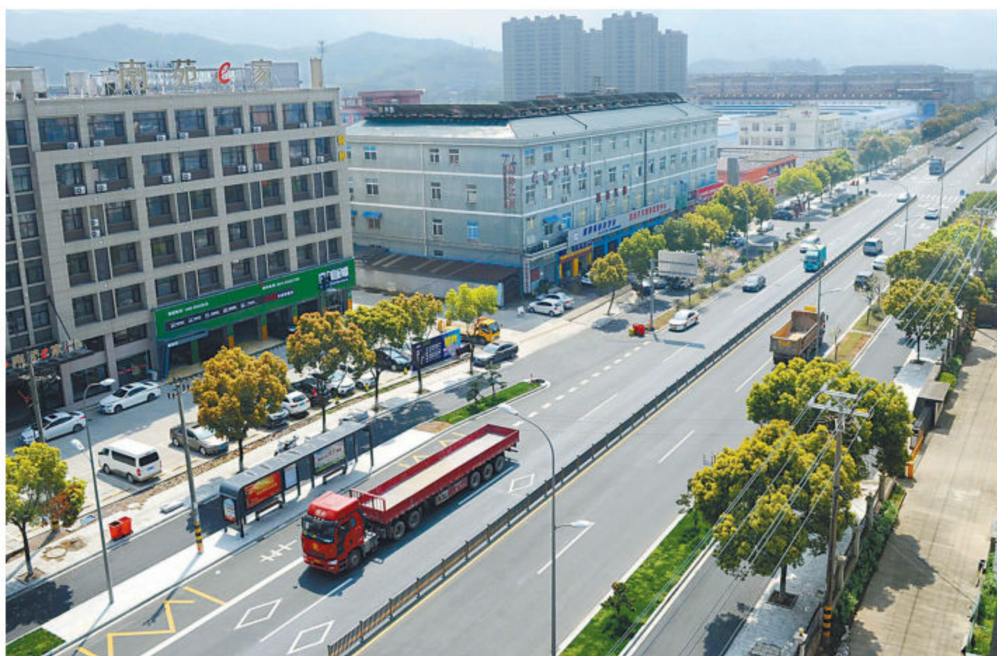
■ 改造提升后的新鄞横线