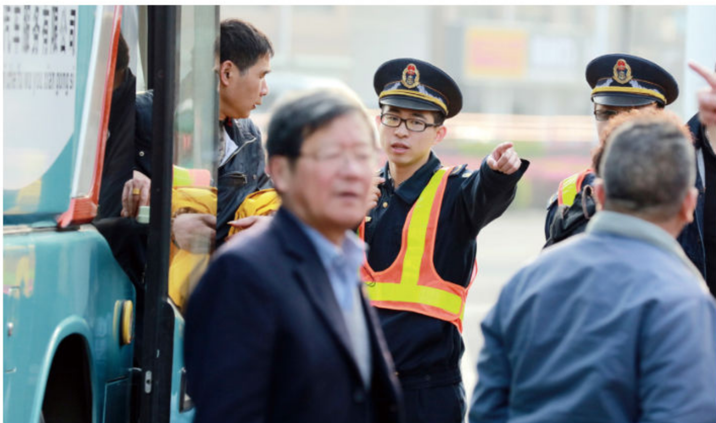
■ 区运管所工作人员上路执勤保障道路畅通