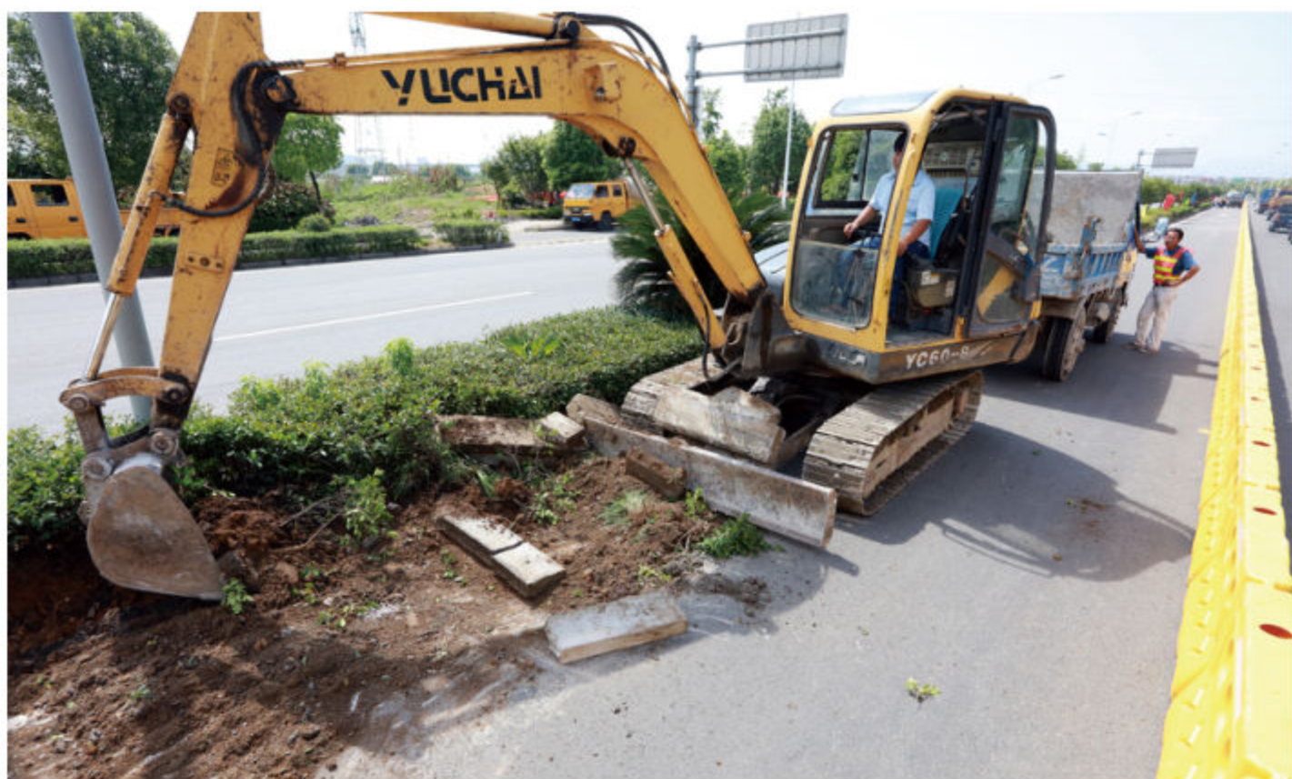
■ 2018年, 鄞横线绿化升级改造工程施工现场