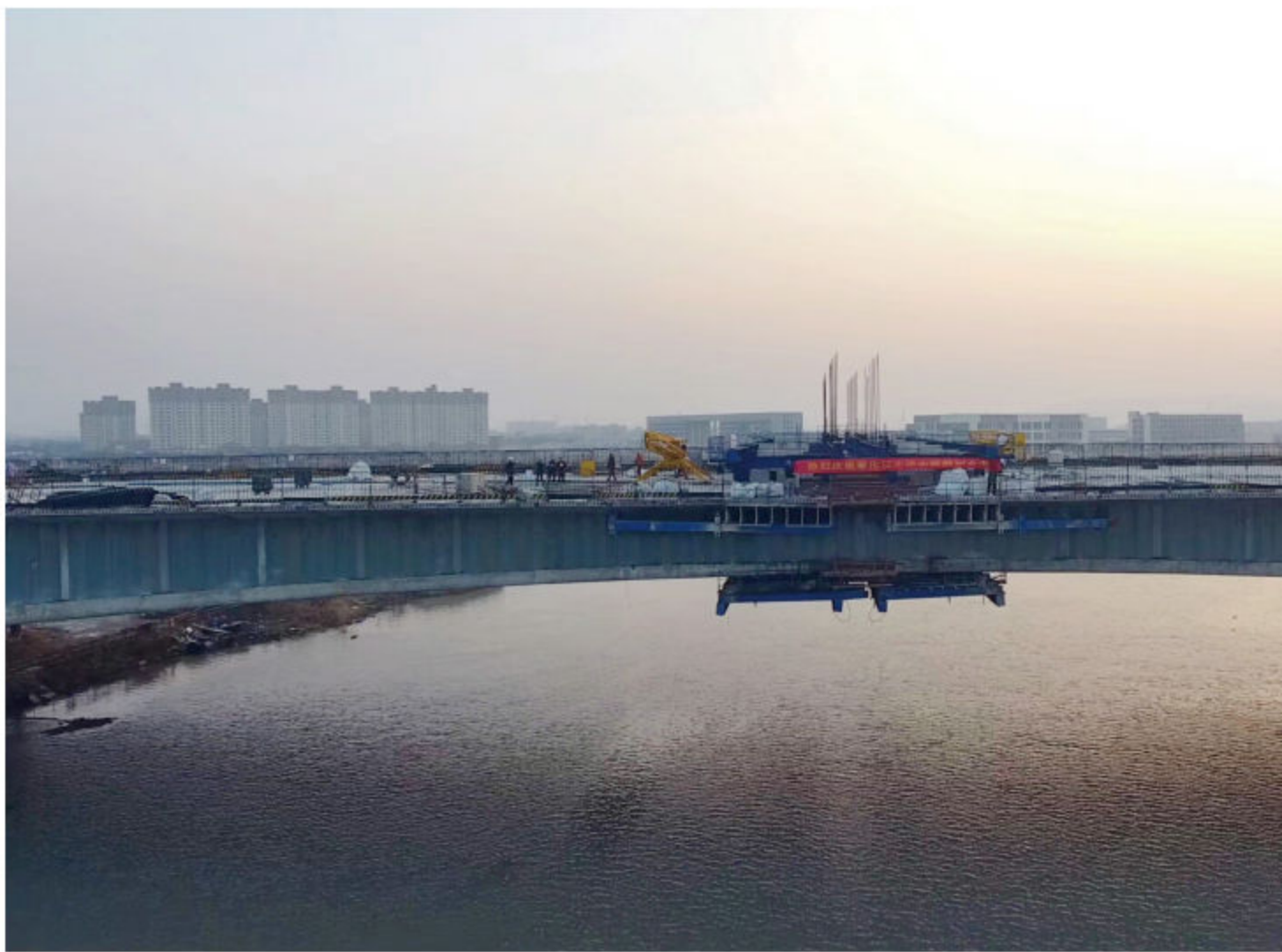
■ 2018年12月20日,鄞城大道鄞城大桥进行首次合龙