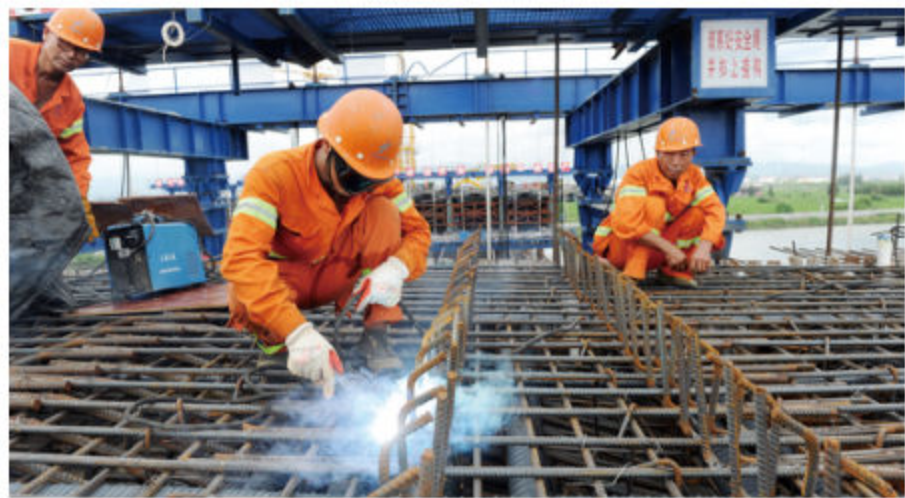
■ 2018年7月,工作人员正在鄞城大桥上作业