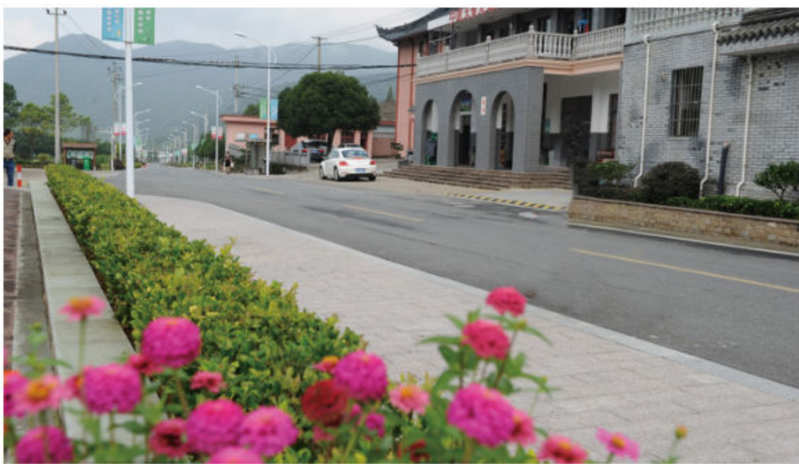
■ 改造后的宝天线至上三塘公路