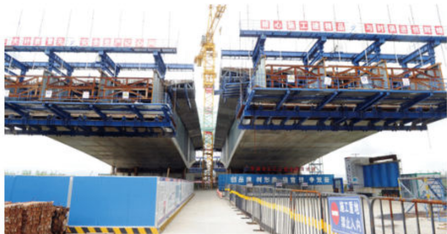
■ 2018年6月,建设中的鄞城大桥