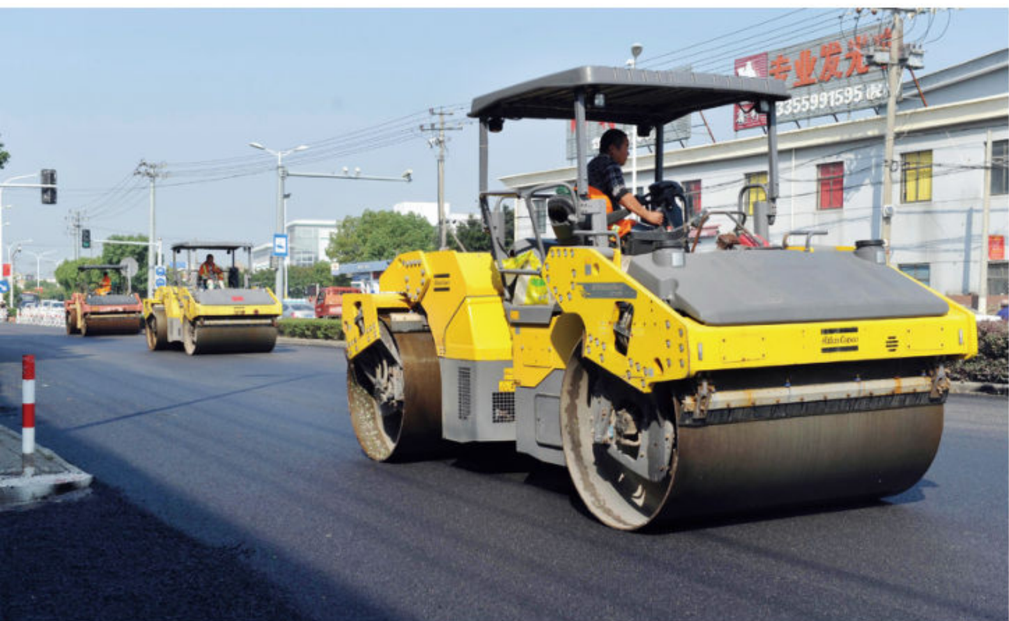
■ 2018年10月16日,329国道施工作业