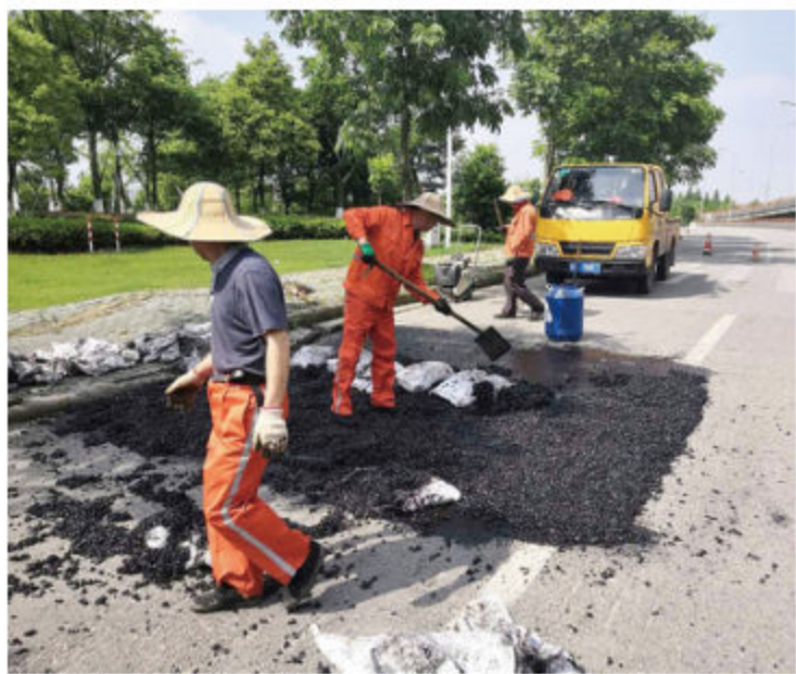
■ 2018年6月15日, 通途路互通(东钱湖—北仑方向)波浪形路面治理