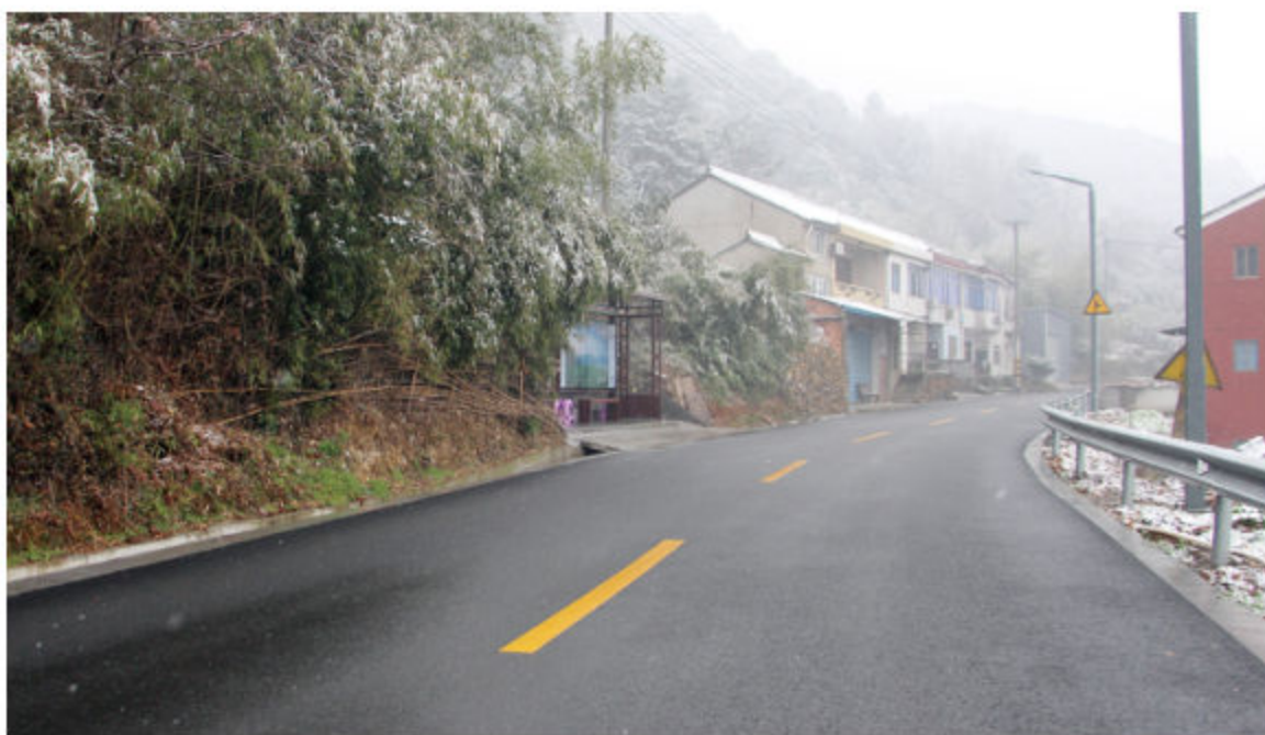
■ 2018年1月31日,宝天线(宝幢—天童段)通过验收