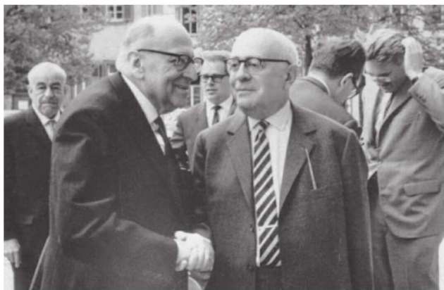
●○● 霍克海默（左）与阿多诺（右）

马克斯·霍克海默（M.Max Horkheimer，1895—1973年）德国哲学家，法兰克福学派的创始人之一。1930年任法兰克福大学社会研究所所长，之后创办《社会研究杂志》。代表作有《启蒙辩证法》（与阿多诺合著）、《工具理性批判》和《社会哲学研究》等。