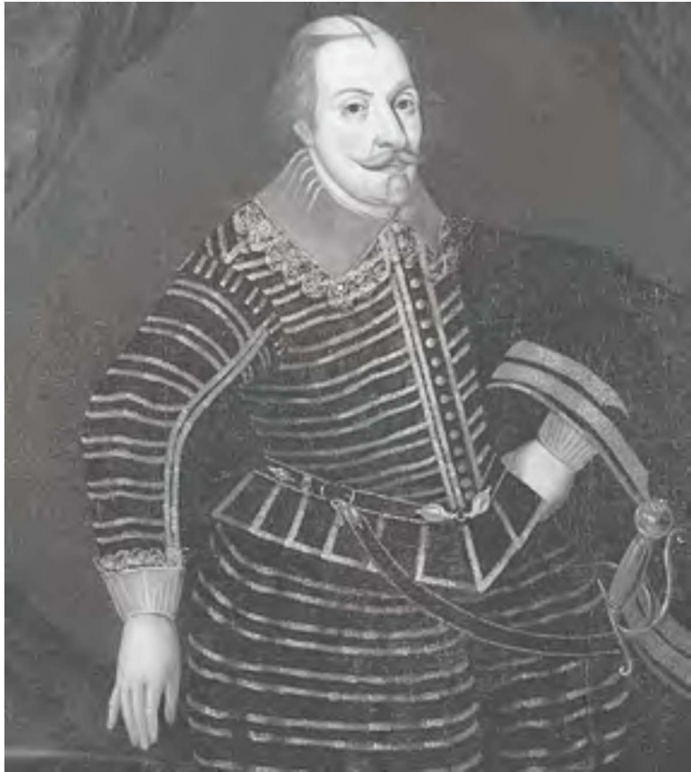
瑞典国王卡尔九世