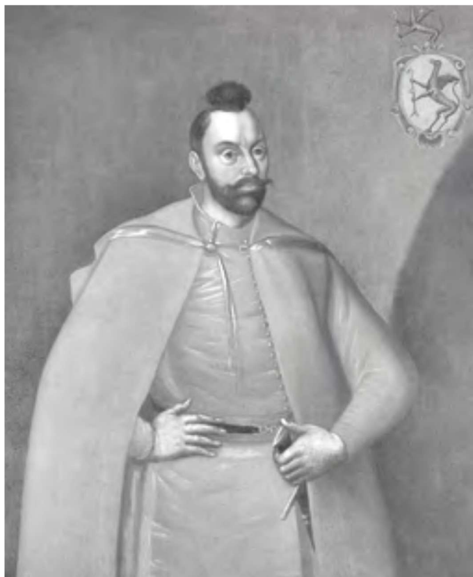
扬·卡罗尔·乔德凯维奇

萨同盟对待瑞典仅仅比对待贸易殖民地稍微好一点，但瑞典仍然愉快地承受着这些耻辱。古斯塔夫一世为瑞典的独立及其未来在君主制中的伟大地位奠定了基础。古斯塔夫一世将这种强大的君主制留给他的儿子们。古斯塔夫一世把国家治理得如此之好以至儿子们的愚蠢和错误都不能动摇国家分毫。渐渐地，这个年轻的国家开始强大起来，并向各个方向扩张。神圣罗马帝国秩序崩溃引起的种种复杂问题使瑞典在波罗的海的一端站稳了脚跟。据说，1561年，吞并了雷瓦尔之后，瑞典在北方的统治权便已经建立起来了。瑞典从爱沙尼亚一步一步地扩大到利沃尼亚。尽管在这里，这条路一度被波兰立陶宛联邦英勇的骑士、伟大的天才军事指挥官扬·卡罗尔·乔德凯维奇阻断。但总的来说，