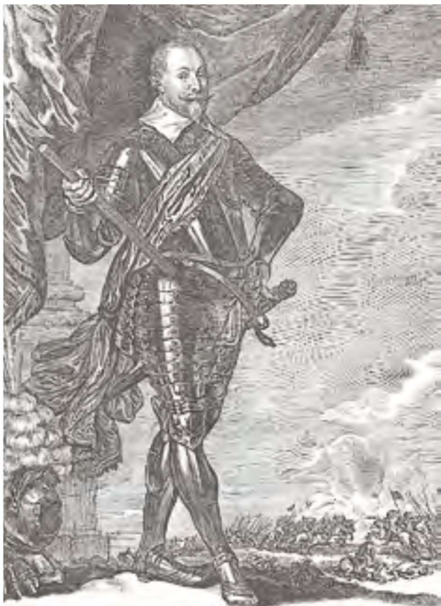
身着戎装的古斯塔夫二世·阿道夫

然而，尽管神圣罗马帝国的拥戴者们给了古斯塔夫二世·阿道夫最光鲜的荣誉，但对于瑞典而言，这是一个严重的错误。因为尽管古斯塔夫二世·阿道夫在神圣罗马帝国的所作所为短时间内带来的结果光荣耀眼，但其最终的结果不仅对瑞典有害，甚至还具有毁灭性。古斯塔夫二世·阿道夫最初的计划是在波罗的海沿岸和瑞典的资源范围之内建立一个紧密的、相互联系的、某种程度上同质的帝国。如果古斯塔夫二世·阿道夫当时的征战停在德维纳河，甚至停在维斯瓦河，他最初的计划都能很容易实现。迄今为止，瑞典可能仍然是称霸北欧的国家。然而，古斯塔夫二世·阿道夫从维斯瓦河向西行进的每一步都