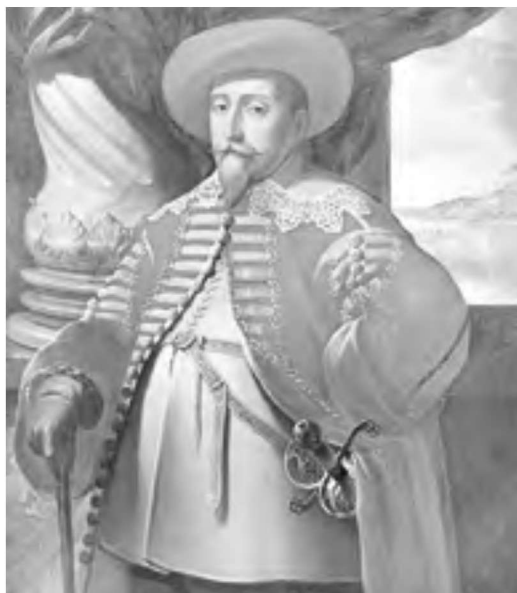
古斯塔夫二世·阿道夫

本书称不上是一本记录卡尔十二世的详尽传记。要完美、恰当地诠释如此庞大而复杂的主题，需要大量的篇幅，但鉴于本书的篇幅，笔者认为这样的传记就应该这样写。该书根据最新调查，呈现了卡尔十二世——这位英雄国王一生的主要事迹，并努力消除许多关于“北方雄狮”古斯塔夫二世·阿道夫的错误观念。