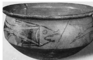
仰韶文化半坡鱼纹彩陶盆