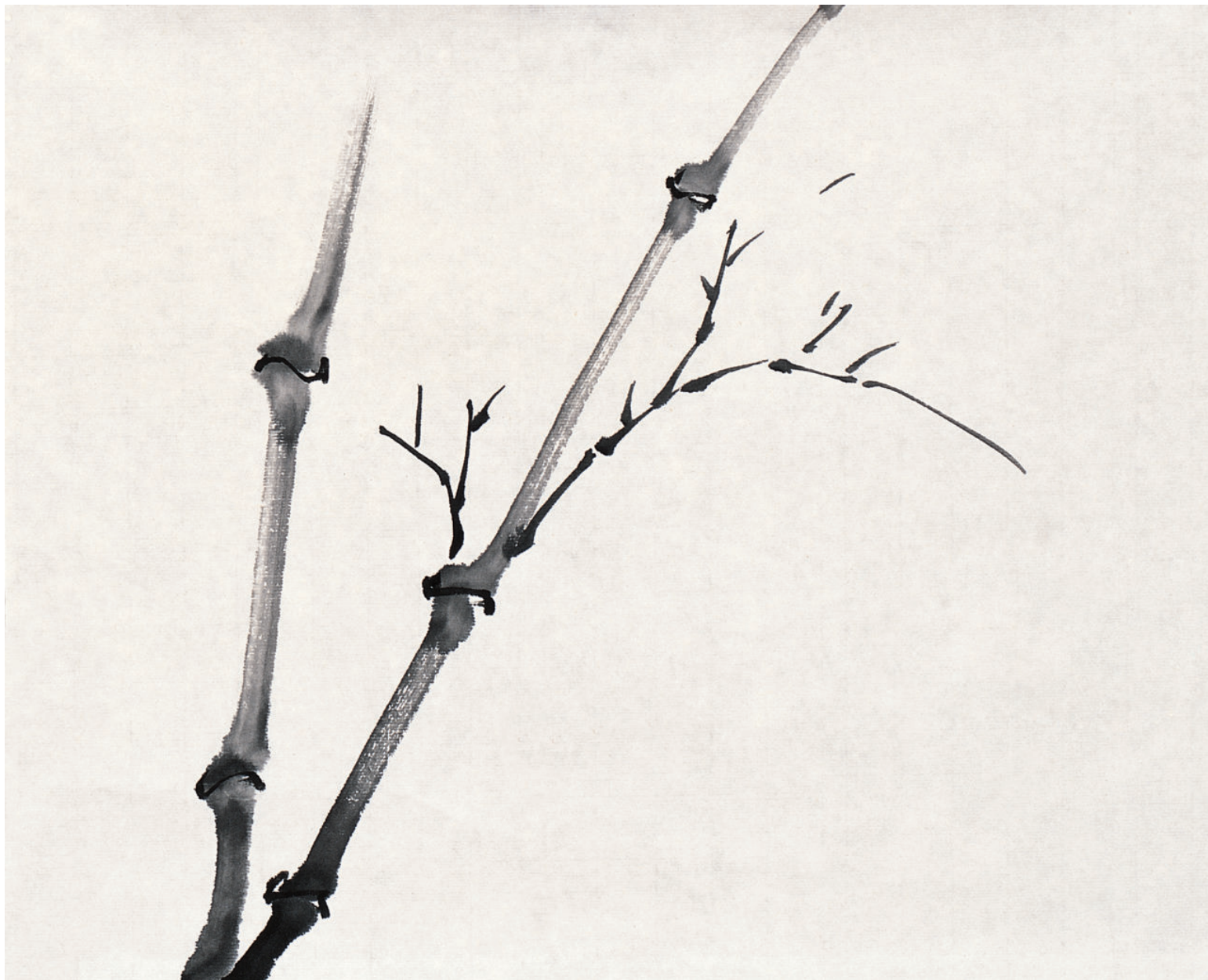
两竹秆穿插小枝，可简，不可繁多。