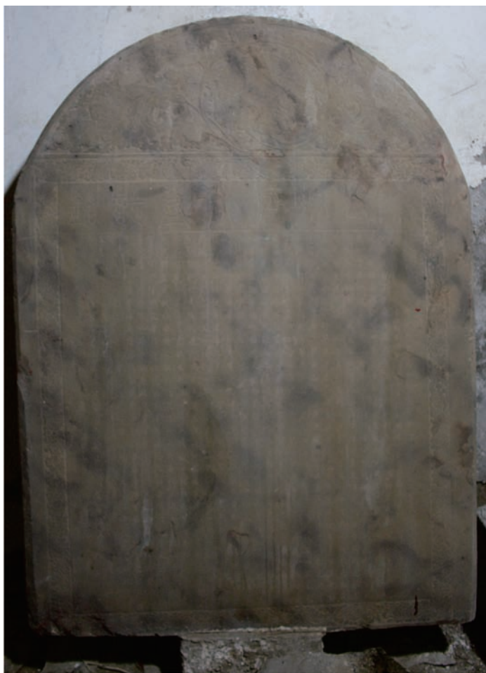
宋故冯府君墓志铭 正面