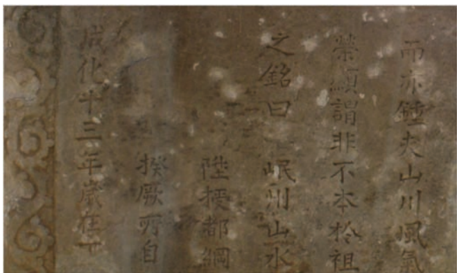
明岳家湾成化十三年碑 局部