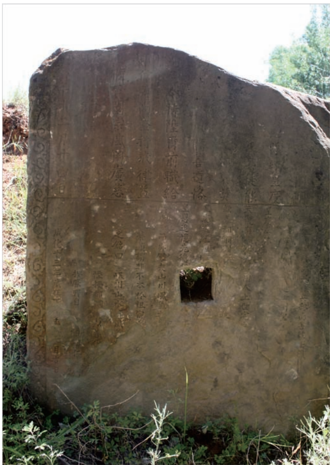
明岳家湾成化十三年碑 正面