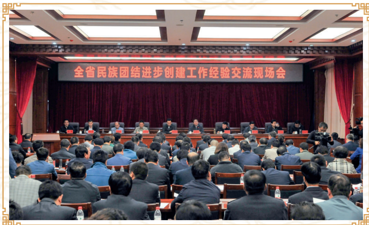
2017年9月5日，全省民族团结进步创建工作经验交流现场会在合作召开