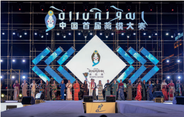
2017年8月11日，首届中国藏模大赛决赛在合作举行