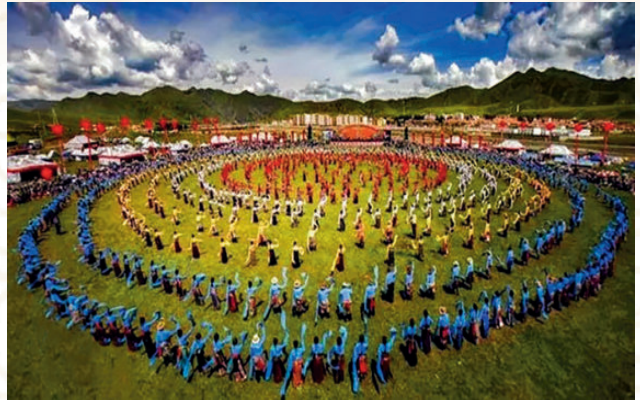
2017年8月6日，中国碌曲第六届锅庄舞展演暨首届房车旅游大会在碌曲县夏泽滩草原开幕