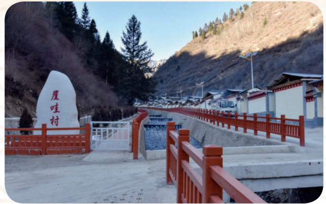
迭部县崖哇生态文明小康村