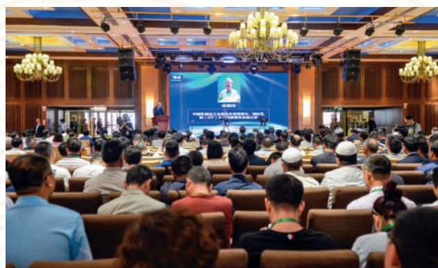
2017年7月13日，中国牦牛乳产业论坛在合作举行