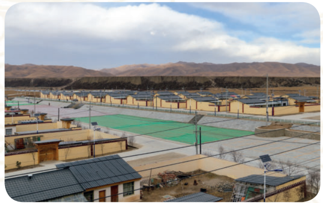
玛曲县欧拉乡生态文明小康村