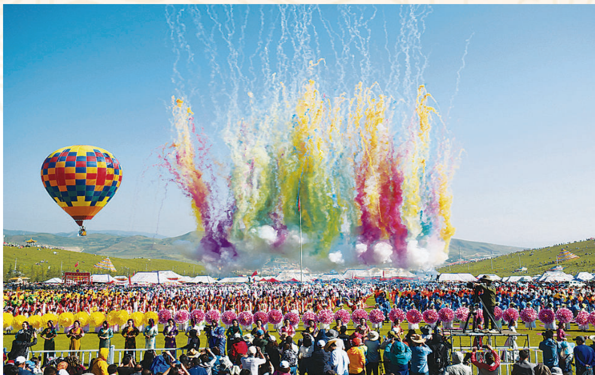
2017年7月17日，第十八届中国·九色香巴拉旅游艺术节在合作当周草原开幕