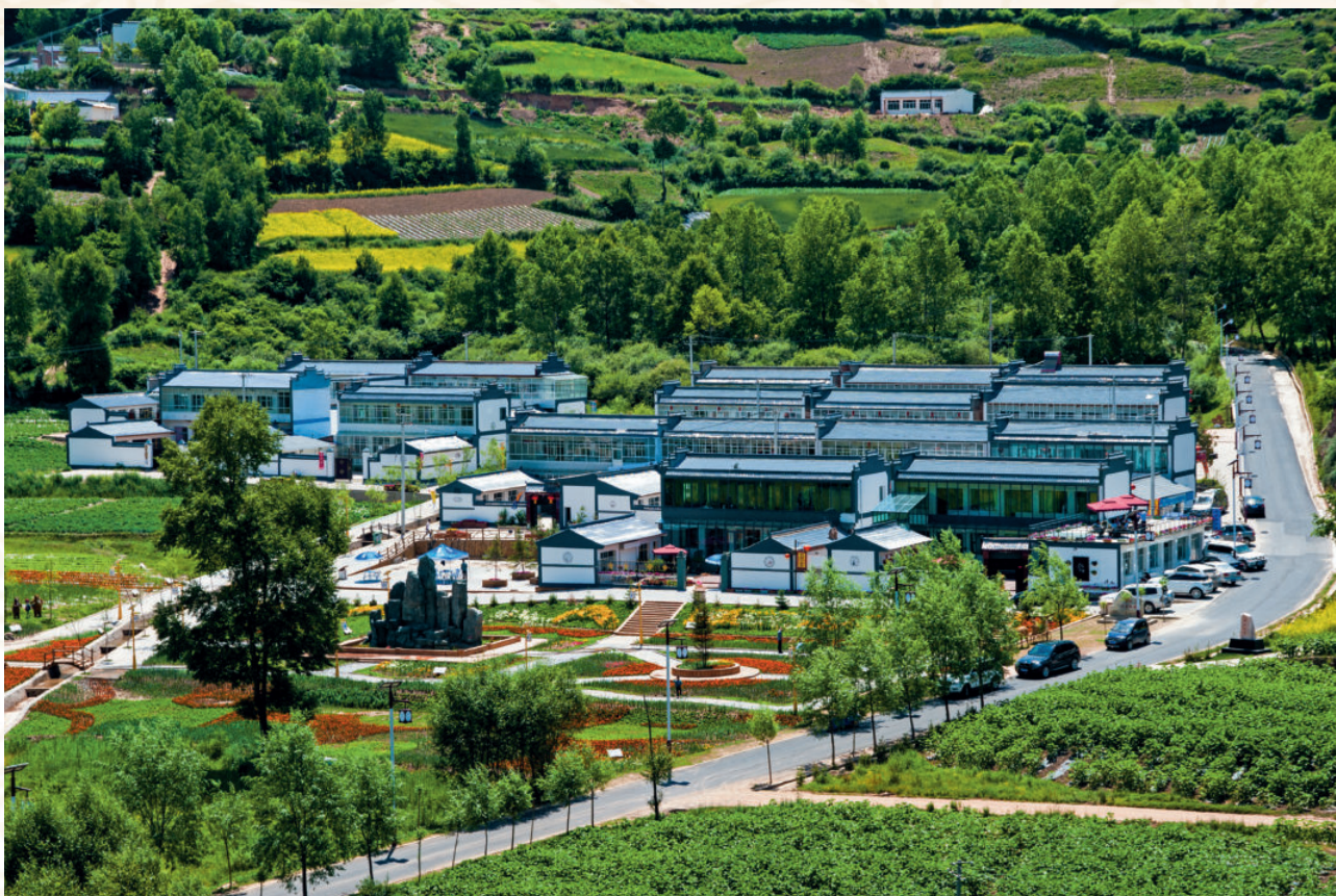
临潭县八角镇庙花山生态文明小康村