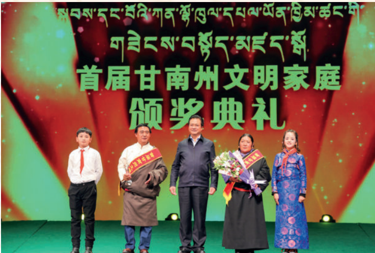
2017年9月28日，“弘扬优良家风 传承中华美德”，首届甘南州文明家庭颁奖典礼在合作举行