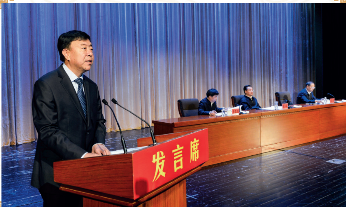
2017年6月28日，全省全域无垃圾现场推进会上，甘南州委书记俞成辉作经验交流发言

2017年6月28日，全省全域无垃圾现场推进会在合作召开，省委副书记、省长唐仁健到会并讲话。