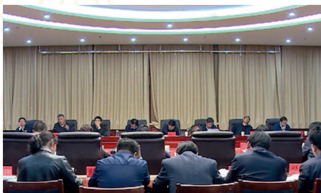
2017年5月31日，全州生态文明小康村建设工作领导小组会议在合作召开