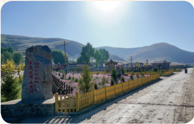
合作市拉响生态文明小康村