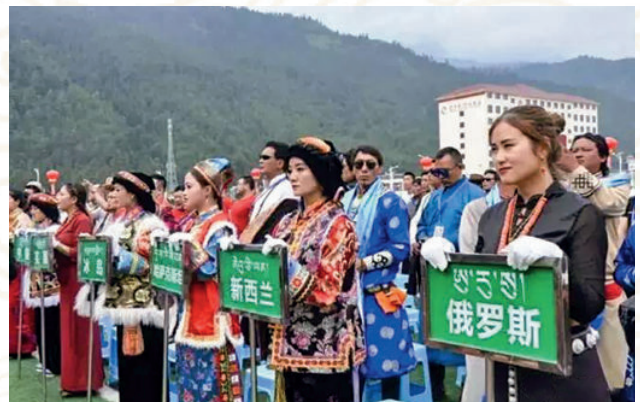
2017年7月3日，迭部国际大力士中国公开赛、第三届安多地区“腊子口杯”则巴邀请赛暨第七届迭部腊子口红色文化旅游艺术节在迭部开幕