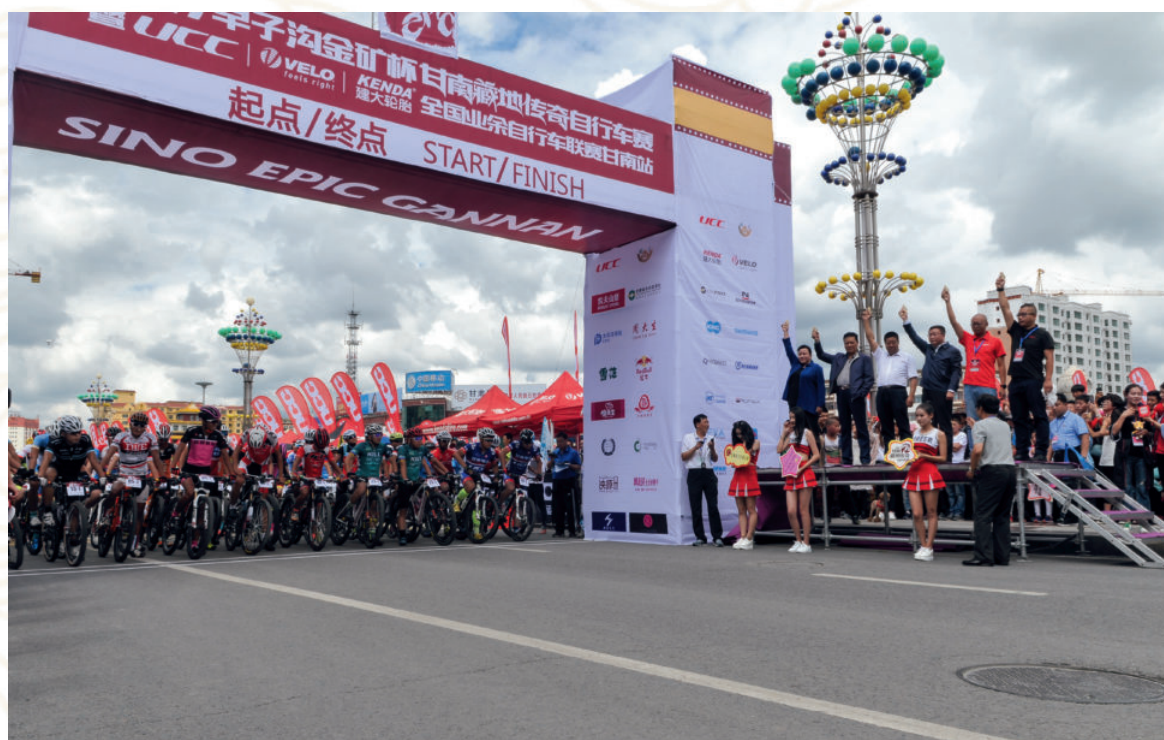
2017年8月18日，甘南·藏地传奇自行车赛在合作开赛