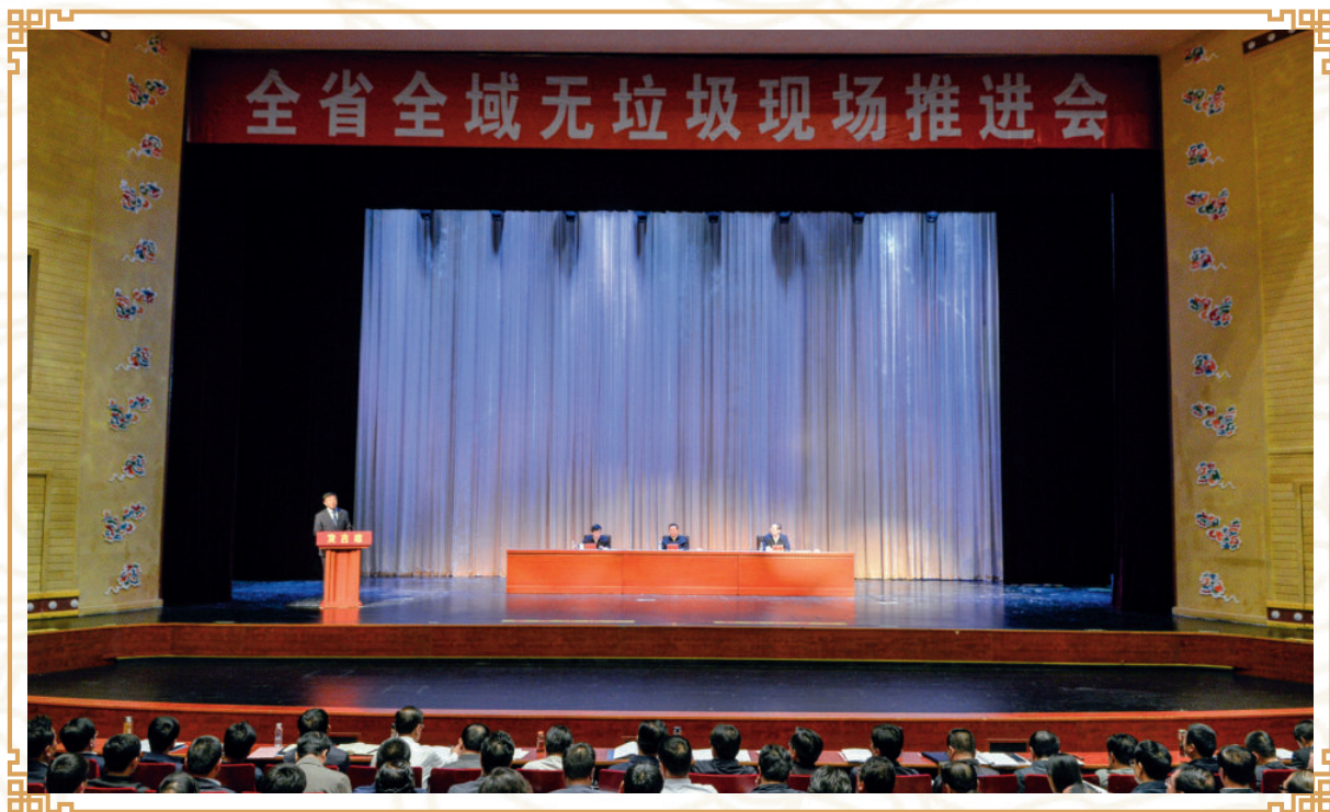
2017年6月28日，全省全域无垃圾现场推进会会议现场

2017年6月28日，全省全域无垃圾现场推进会在合作召开，省委书记、省人大常委会主任林铎对全域无垃圾示范区创建工作做出批示。