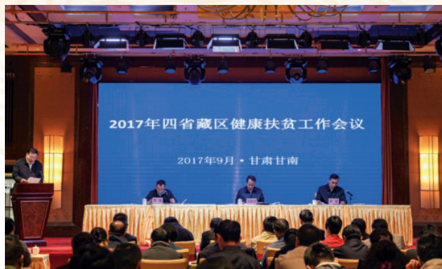
2017年9月22日，甘、青、川、滇四省藏区健康扶贫工作会议在合作召开