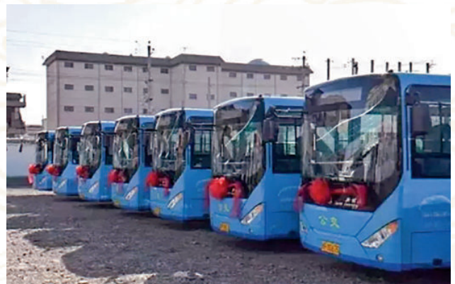
2017年1月6日，甘南州首批16辆新能源纯电动公交车投入运营