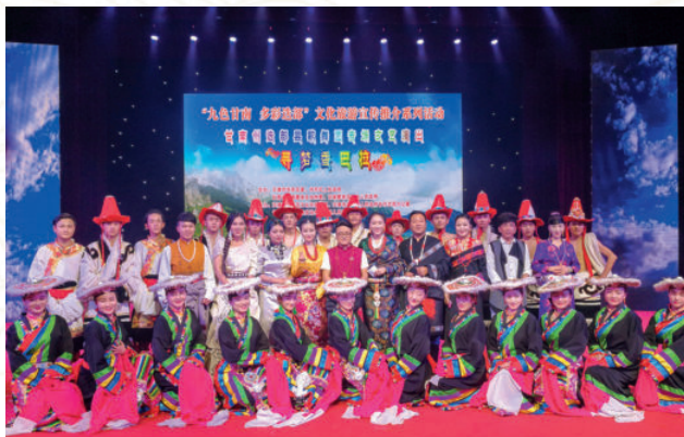
2017年9月13日，“九色甘南 多彩迭部”文化旅游宣传推介会在天津举办