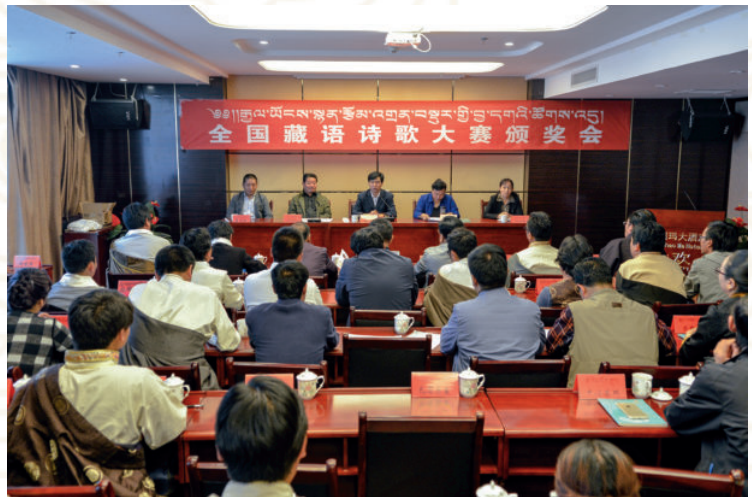
2017年7月7日，全国藏语诗歌大赛颁奖会在合作召开