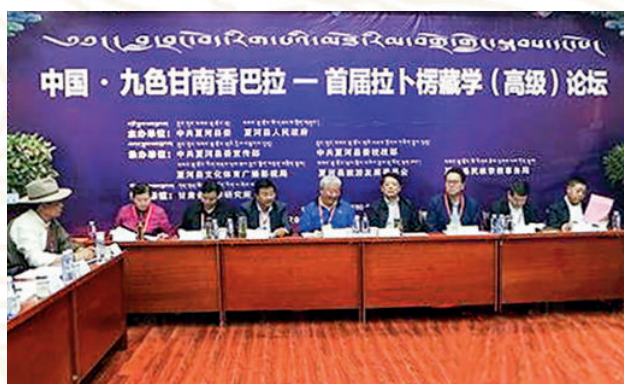
2017年8月7日，首届拉卜楞藏学（高级）论坛在夏河县举行