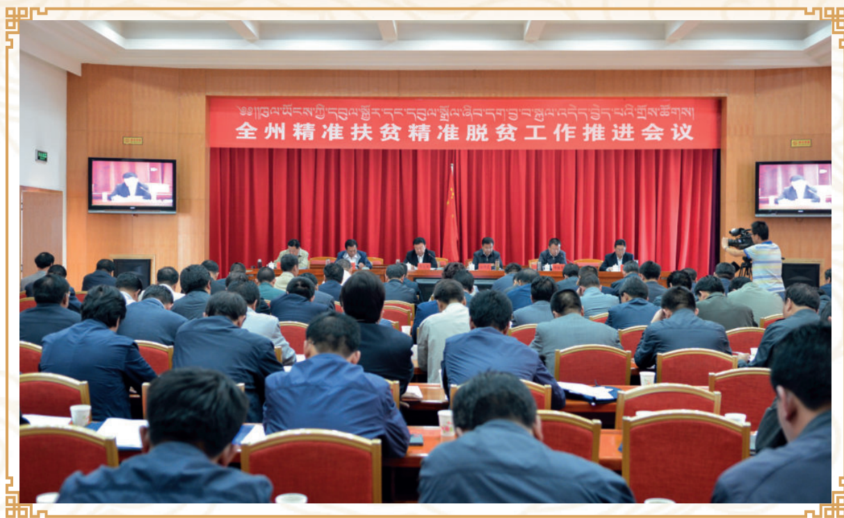
2017年7月7日，全州精准扶贫精准脱贫工作推进会议在合作召开