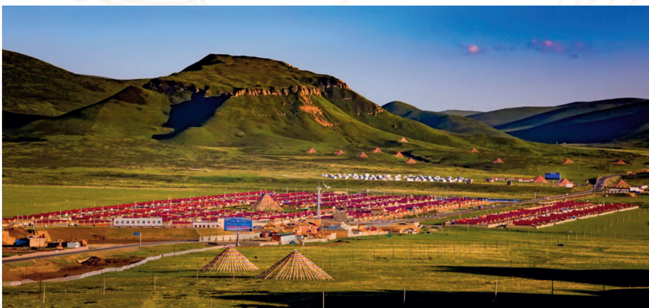
碌曲县尕海镇尔秀生态文明小康村