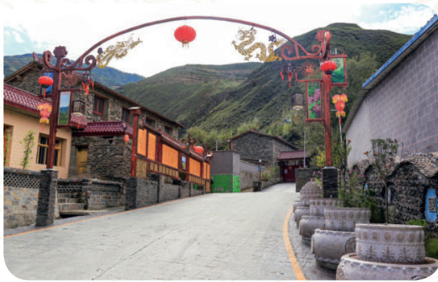
舟曲县巴藏乡格皂坝生态文明小康村