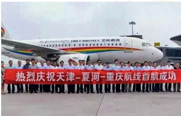
2017年7月31日，甘南夏河机场开通天津—夏河—重庆航线