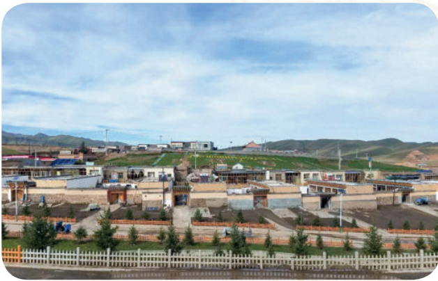
夏河县阿木去乎镇安果生态文明小康村