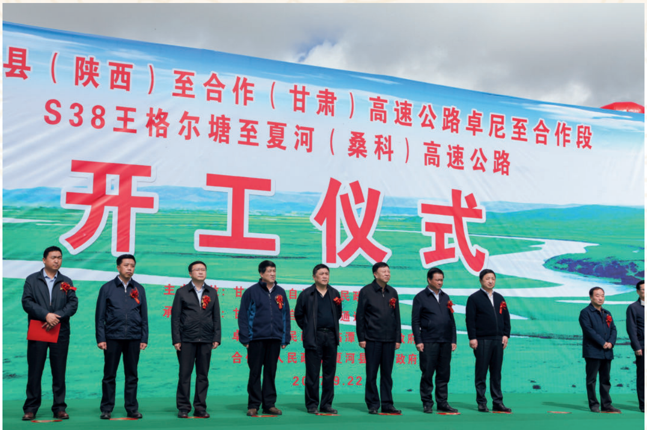
2017年9月22日，甘南州举行S10 凤县（陕西）至合作高速公路卓尼至合作段和S38 王格尔塘至夏河（桑科）高速公路开工仪式