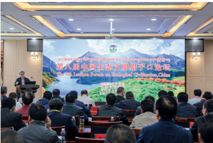
2017年8月8日，第八届中国生态文明腊子口论坛在临潭县冶力关镇召开