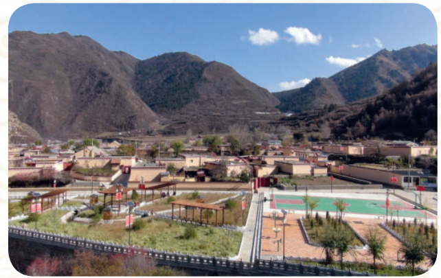
卓尼县木耳镇博峪生态文明小康村