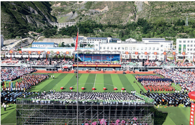
2017年6月30日，第四届舟曲民俗风情楹联文化节暨“一带一路”国学文化翠峰山高峰论坛在舟曲开幕