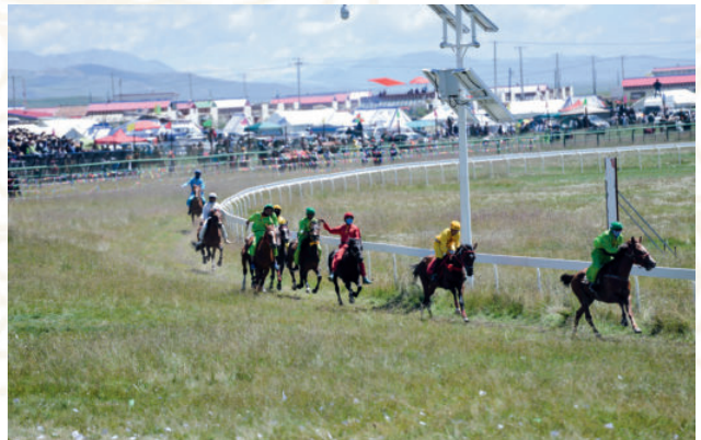
2017年8月13日，中国·九色甘南香巴拉玛曲第十一届格萨尔赛马大会在玛曲开幕