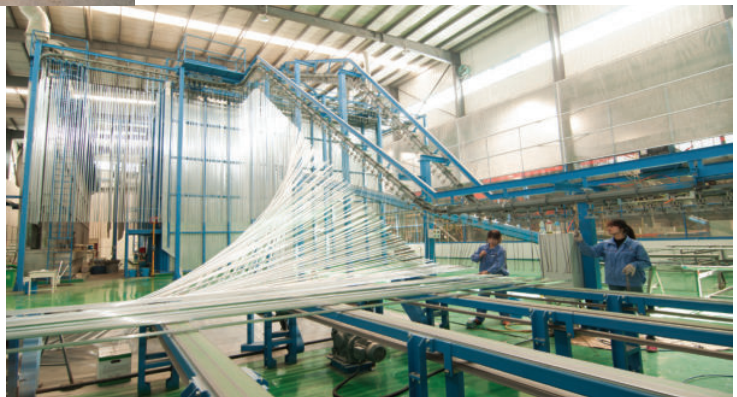
甘肃东方铝业股份有限公司铝型材生产线