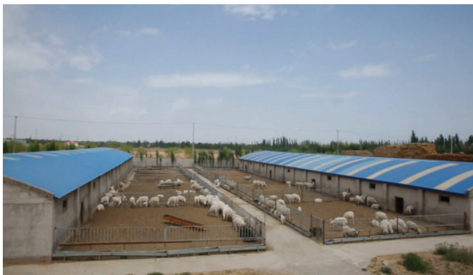
肃州国家现代产业园东洞标准化养殖示范园