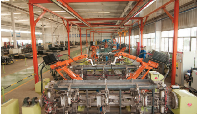
甘肃酒泉奥凯种子机械有限公司智能机器人焊接生产现场