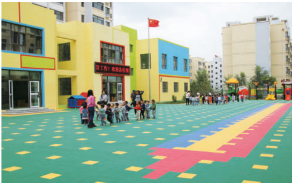
酒泉市第五幼儿园