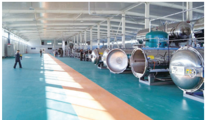
酒泉西部农业股份有限公司玉米加工生产线（一）