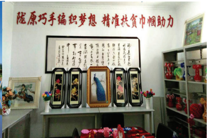
丰乐镇巧姐手工坊