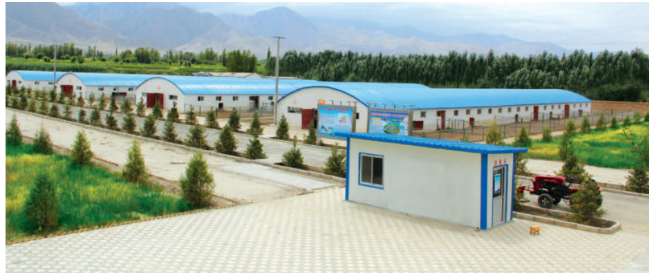
肃州区丰乐乡龙德盛生态养殖场场房