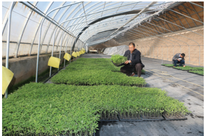
上坝镇金涛育苗中心