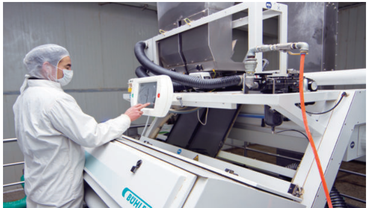
敦煌百佳食品脱水菜加工车间