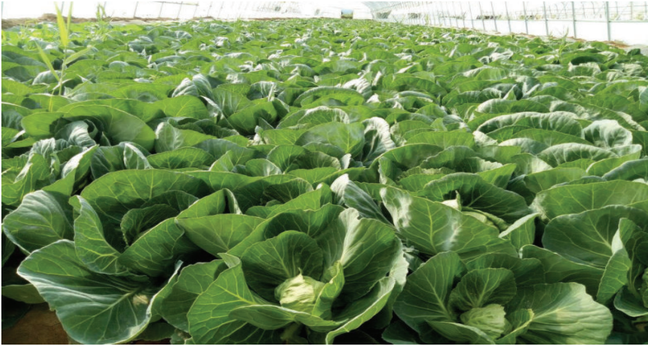
东洞镇高原夏菜基地