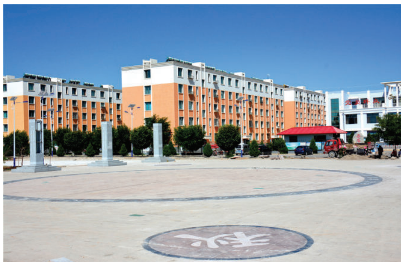
正在修建中的肃州区总寨镇西店村农耕文化广场