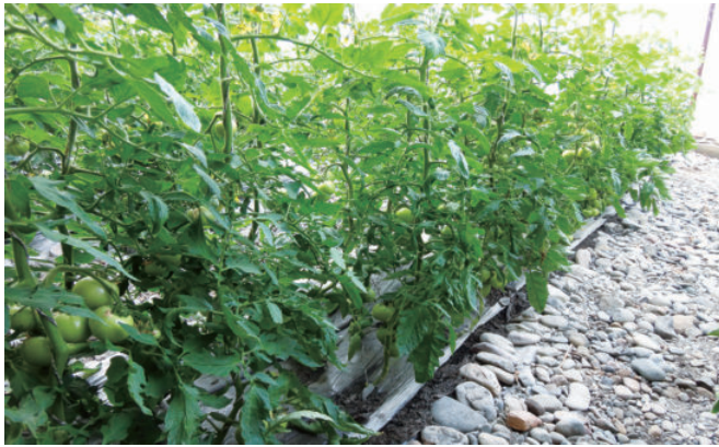
总寨有机生态无土栽培技术种植的番茄