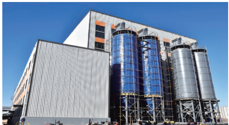
新城区二期集中供热项目一期工程