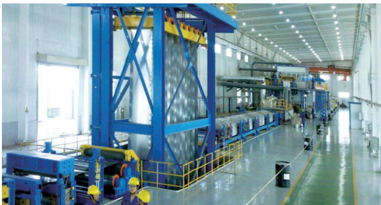
酒泉西部农业股份有限公司玉米加工生产线（二）