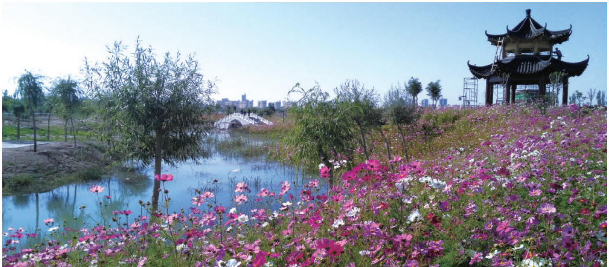
四坝海子生态治理项目