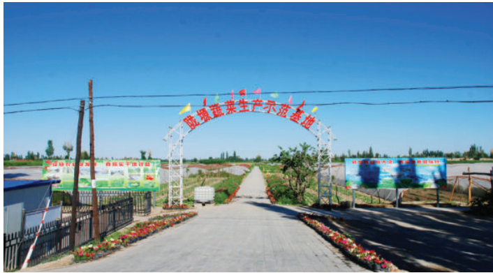
陇塬蔬菜生产示范基地