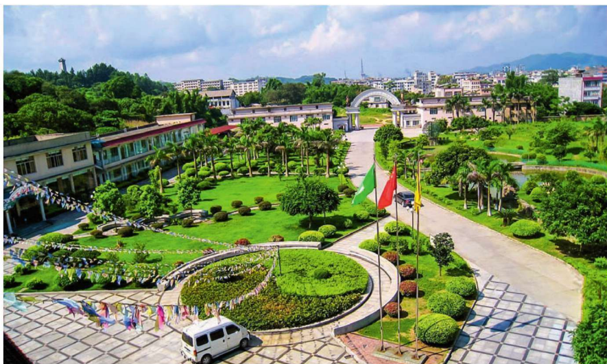
九龙山庄

可抽取温泉水3600立方米以上。经科学测定，水温达53℃；热气腾腾，云蒸霞蔚。此泉属碱性磷酸盐泉，略带硫磺味。除含有较高碳酸盐外，还含有氢、钾、钠、钙的硫化物等24种化学成分和一些放射性微量元素。温泉设施主要有陆川温泉疗养院、温泉九龙山庄和温汤花园。