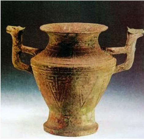
西周时期兽耳蝉纹铜尊