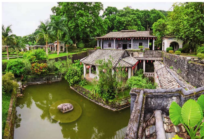
谢鲁山庄

多种。山庄熔中国名庄之大观于一炉，素有“岭南第一庄”的赞誉，是全国迄今保存最为完整的四大私人庄园之一。