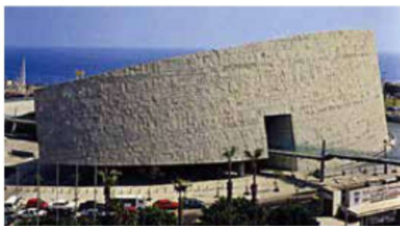
图 1-7 新亚历山大图书馆

随着人类文明的发展和经济繁荣的国家的出现，图书馆的规模和功能也在不断拓展。根据文献记载和考古发现，世界上最古老的图书馆之一的埃及亚历山大图书馆早在公元前 200 年左右就已经拥有了专门供读者阅读的场所，在奴隶主统治下的古罗马更是产生了现代公共图书馆的雏形。古罗马的图书馆建筑，大多与神庙毗连，以石料为主材料，纪念大厅为主体，大厅内部空间中央一般由石柱撑起，顶部采光，周围有柱廊，大厅四周、壁龛和柱廊装饰有雕塑、壁画、人物肖像等 ① ，建筑外观富丽豪华，宏伟壮观，但是这一时期的图书馆多呈现出馆藏有限、功能简单的特征。