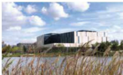
图 1-1 宁波图书馆

图书馆建筑是为实现图书馆使命与功能，满足读者文化需求，为人们在图书馆内外的活动创造良好环境的大型公共文化服务场所。著名建筑大师贝聿铭先生认为：图书馆的责任就是创造一种环境，更多地关注读者，让所有人能够在里面尽情地享受知识的甘露。所以，读者是图书馆的最终享用者和最终评估者，图书馆设计应将读者的需求与感受放在首位。