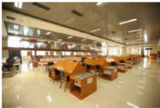
图 1-6 沧州图书馆报纸与期刊阅览区