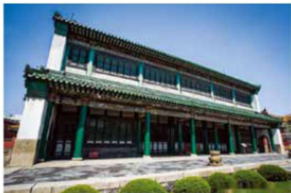
图 1-10 沈阳文溯阁