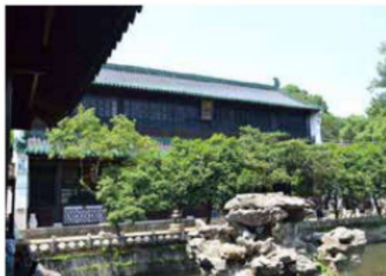
图 1-11 杭州文澜阁