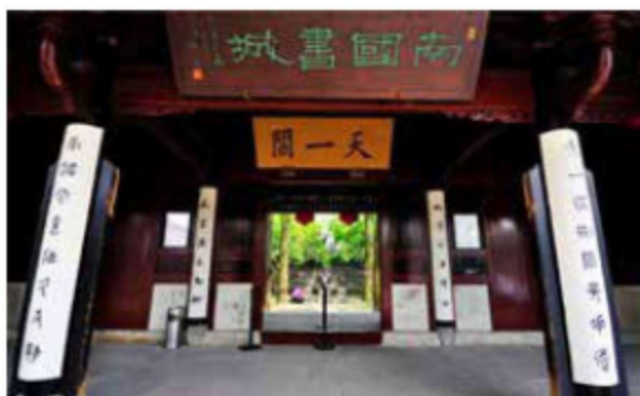
图 1-13 天一阁正门