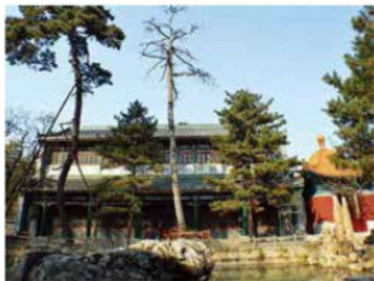
图 1-12 承德文津阁