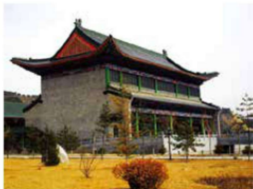
图 1-9 北京文渊阁

一类是学者的私人图书馆（私人藏书楼），这两类藏书楼均以藏为主，且仅供特定人群或所有者的至亲好友使用，所以藏书楼往往建在独立庭院、高墙之内，实行严格的封闭管理，注重防盗、防火、防潮、防虫和防鼠的设计。中国私人图书馆的典型是浙江省宁波市明朝兵部右侍郎范钦（1506—1585年）建立的天一阁，它是中国现存最早、最完好的，亚洲现存最古老的图书馆，也是世界最早的三大家族图书馆之一（其他两座分别是意大利的马拉特斯塔图书馆和美第奇家族图书馆），建于1561—1566年。这座图书馆是木构建筑，两端为砖墙，其正面被分为六个开间，四进深，阁两层，一层有较大的空间供家族成员阅读写作，二层是藏书处。天一阁建在与外界隔绝的私人院落内，采用江南民居的建筑方式，融合造园手法，开创了“园中有馆，馆中有园”的先河。这个时期，官方图书馆的典型则是最初为收藏《四库全书》修建的七所图书馆，其中北京的文渊阁、沈阳的文溯阁、杭州的文澜阁和承德的文津阁保留至今。它们一、二层之间有专门用于存放其他书籍的隔层，二楼存放《四库全书》，一楼有为皇帝特设的阅览室。