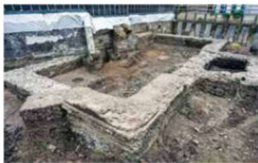
图 1-8 古罗马图书馆遗址