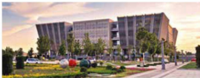
图 1-2 沧州图书馆

图书馆建筑形体和外立面设计要首先做到大气、和谐、美观，且必须做到实用、坚固、安全、环保。大多数现代图书馆建筑在形体和外立面设计上注重吸收中西方优秀传统元素和现代进步元素，在保证安全性和实用性的基础上注重绿色节能与人性化，同时追求建筑的艺术美、协调美及技术的人性化，力求为所在区域带来文化品位的提升，给读者一种建筑美感的享受。