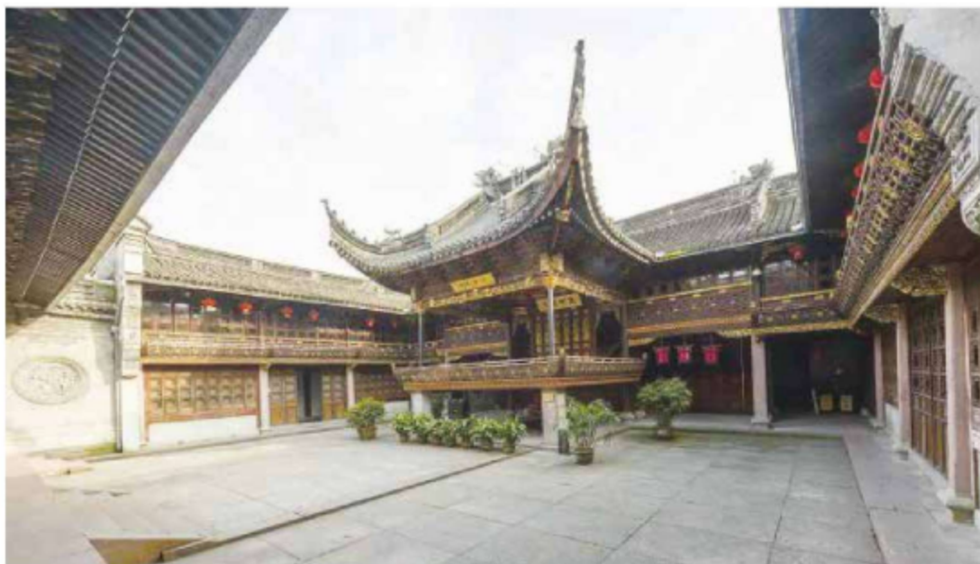
图 1-15 天一阁全景