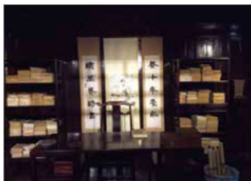
图 1-14 天一阁内部阅览室