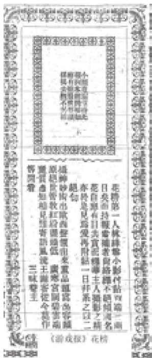
图 1-1 《游戏报》花榜