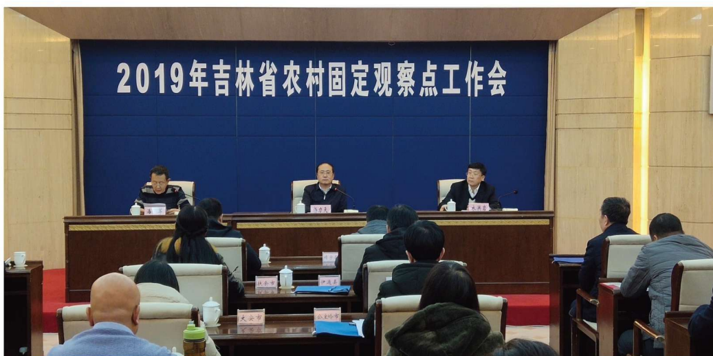
2019年全省农村固定观察点工作会议在长春举行