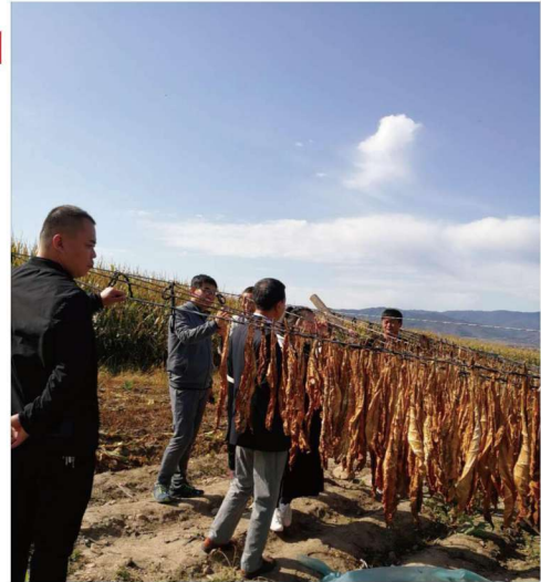
吉林省农村固定观察点 办公室工作人员与蛟河市石 头河村工作人员到种植晒烟 记账户田地开展调研