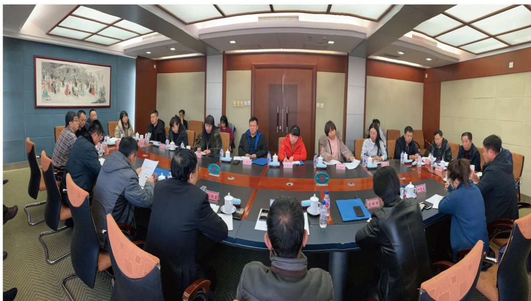
2019年全省农村固定观察点工作研讨会在长春举行