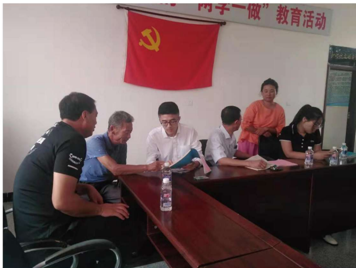
吉林省农村固定观察点办公室工作人员到平岭村开展“不忘初心，牢记使命”主题教育与农户面对面交流