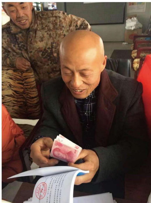
靖宇县程山村记账户领取补贴