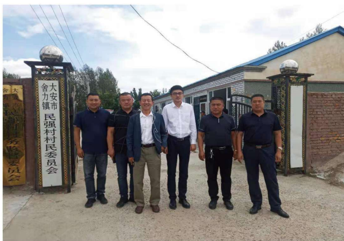
吉林省农村固定观察点办公室工作人员到民强村开展“不忘初心，牢记使命”主题教育活动