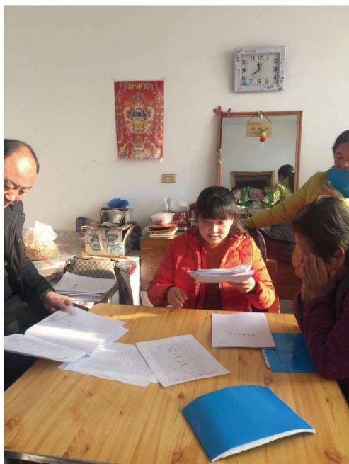
长春市观察员到龙家堡镇莲花村观察户家中开展入户指导工作