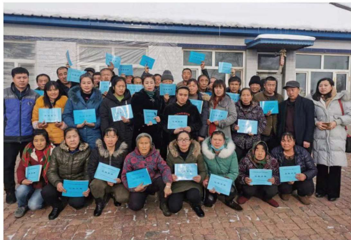
德惠市大房身镇富宁村记账户集中培训