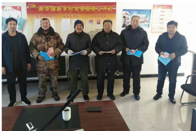
通榆县新华镇新丰村2019年优秀记账户