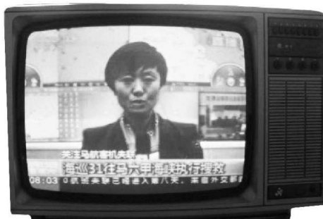
图1-3 模拟彩色电视机

1962年，联邦德国的勃鲁赫（Bruch）在NTSC制式的基础上提出PAL（Phase Alternate Line）制式，其方案将NTSC制式中色度信号的一个正交分量逐行倒相，从而有效抵消了相位误差并把微分相位误差的容限式由NTSC制式的正负 12^\circ 提高到了正负 40^\circ ，该制式先后被120多个国家所采用。几乎与此同时，法国人于1956年开始研究并发明了SECAM（Sequential Colour with Memory）制式，于1961年成功地进行了系统展示。在SECAM制式中，两个色差信号是逐行轮换传送的，色差信号对色副载波的调制采用的是调频方式，该制式为法国、苏联等国家采用，是欧洲的第一个彩色电视标准。1972年，中国决定将PAL作为彩色电视制式。如图1-3所示。