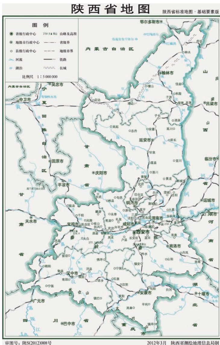
1 : 500 万陕西省地图基础要素版

渭南地处黄河流域中游、黄土高原的东南、陕西关中盆地的东部，南跨秦岭与商洛市为邻，北倚黄龙山与延安市、西北与铜川市接壤，全市南北长 187.3 千米，东西宽 149.7 千米，总面积 13134 平方千米，是“八百里秦川”最开阔的地带。全市自南向北分为五个自然区域：秦岭北坡山区、秦岭北麓黄土台塬区、渭河冲积平原区、渭北黄土塬区、北部边缘低山丘陵区。地貌类型多样，山河壮丽，有以“奇险天下第一山”而著称的西岳华山，以及黄河龙门、洽川黄河湿地等众多自然景观。整个区域自然条件优良，适宜农、林、牧的发展，是全国重要的农业生产基地。