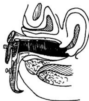
图 1—2 暴露宫颈

(3) 双合诊检查：经阴道手指触诊的同时用手在腹部配合检查称为双合诊，主要方法为检查者一手的两指或一指放入阴道，另一手在腹部配合检查(见图 1—3、1—4)。目的在于摸清阴道、宫颈、子宫、输卵管、卵巢、宫旁结缔组织以及骨盆腔内壁的情况。检查时，右手(或左手)涂润滑剂，顺