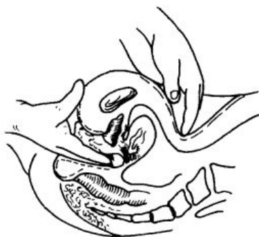
图 1—3 双合诊检查子宫

阴道后壁轻轻插入，通过阴道口时，可感觉阴道松紧，加用食指或拇指可触摸阴道口两侧有无肿块或触痛，再深入可检查阴道长度及是否通畅、阴道后穹窿是否饱满，有无先天畸形、疤痕和肿块，同时可触摸宫颈大小、硬度、有无抬举痛及宫颈口是否松弛。随后腹部上的手自脐部向下移动配合阴道内的手，检查子宫大小、位置、质地、形状、活动度及有无压痛。再将阴道内手指移向一侧穹窿，腹部手从同侧下腹部髂嵴水平，自上而下按压腹壁，触诊该侧附件区有无增厚、压痛或肿块及其与子宫的关系。双合诊结束后，应检查阴道指套有无血迹及其他沾染物。