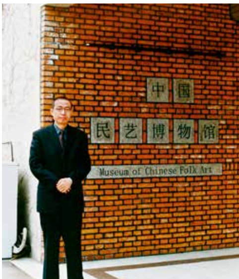
2000年元旦，千禧年第一天，中国民艺博物馆（青岛馆）开馆仪式在全国青少年青岛活动营地举行

为在她们手中的“针线活”就是她们生活的一部分。在她们看来，为孩子做鞋做帽，缝纫刺绣，为装点生活环境，剪纸贴花，为老人长寿祝福，蒸作面塑，都是理所当然的事。“这种自发、自作、自给、自用、自娱的艺术创造，最能说明艺术与人生的关系。”当这些自然而然的传承与创造逐渐从日常生活中退出，人们也许热衷于从所谓国际时尚中建立一种生活定位。民艺收藏既是无奈之举，也是为昔日生活艺术的创造者立档存志，是集体的、无名的，却是真实存在的，不应被新的潮流湮没，要留下它的脉络和踪迹。