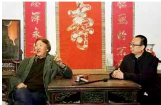
2013年，中国文联副主席、中国民协主席、国务院参事冯骥才参观中国民艺博物馆

成为主流。传统民艺与民风民俗相依存，作为传统民间生活的有形载体，从生活舞台的中央走向边缘，一些品类的技艺与传承甚至走向消亡。生活在变，不变的是人们对美好的永恒追求。民艺维系的是一份亲情、乡情、民情，连接的是民族精神的根脉与情感的纽带。在今天，民艺有生活的土壤和情感的需求，我们甚至比以往任何时候都更需要民艺，需要承载、安放、传递生活里最朴素亲和的情谊，需要传承生活的艺术和智慧，创造民间的生活之美，实现民生的审美关怀。传承和发展民艺，是一个生活文化的建构过程，把生活与美统一起来，使生活不是物质化的、空虚的、贫弱的，而是有匠心、有境界、有情感寄托的。美在生活，美在日常，在生活日用中塑造美、直观美，充实和提升的是最广泛深刻的社会认同。