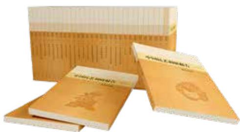
潘鲁生主持国家社科基金艺术学重大项目，百部《中国民艺调查报告》文库出版

借助《中国民艺馆》丛书，让我们再次凝视民艺之美，感受生活之美。也希望丰富多彩的民艺回归朴素的生活，如不息的河流随岁月流转，哺育滋养一代代人的生活，在造物的智慧、用物的享受、爱物的快乐中寻得更美好的境界。