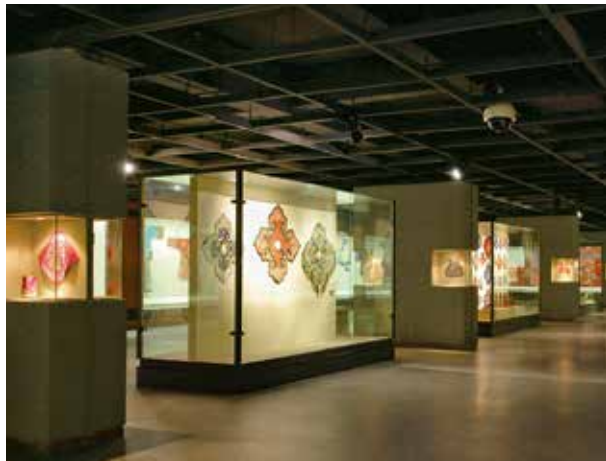
中国民艺博物馆场景