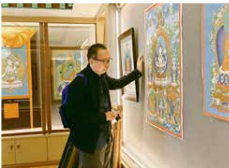
2017年，潘鲁生考察西藏拉萨夏鲁旺堆唐卡