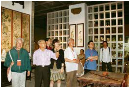
2010年，中国工艺美术学会民间工艺美术专业委员会专家考察中国民艺博物馆