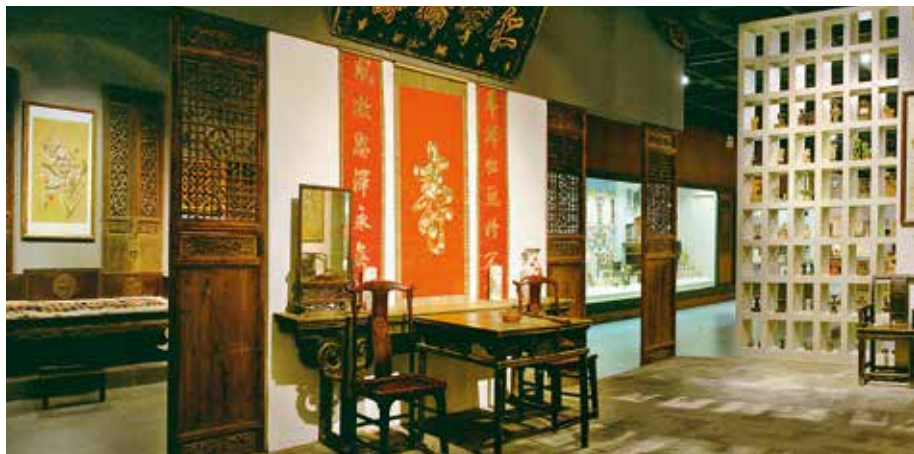
中国民艺博物馆场景