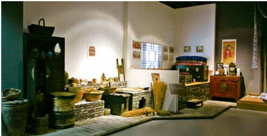
中国民艺博物馆场景