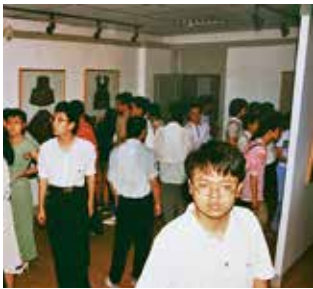
1998年，“中国民艺博物馆藏品展”在山东工艺美术学院收藏展览中心开展