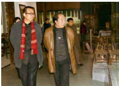
2009年，著名美术学家邓福星一行参观中国民艺博物馆