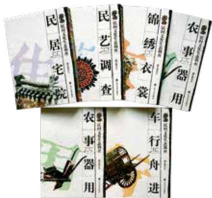
潘鲁生主编《民间文化生态调查》

我与民艺有缘，从求学到教学，从书斋到田野，希望自己下得苦功夫，做些深入的研究和探索。