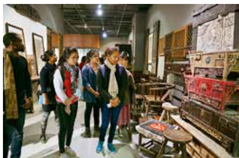
2015年，南京艺术学院留学生参观中国民艺博物馆

者忘源，人各竭其力于生活之一隅，而丧失其人生之常情。于是世间始立‘艺术’为专科，而称专长此道者为‘艺术家’。”他还说：“艺术教育是一种品性陶冶的教育，不是技巧的能事。极端地说，学生不必一定要描画、作诗、唱歌。懂得昼夜的情调、诗歌的趣味，而能拿这种情调与趣味来对付自然人生，便是艺术教育的圆满奏效。虚荣实利心切的，头脑硬化的，情感的绝缘体，在人群中往往做很不自然的障碍物，即使会描画作诗，乃是俗物。”让读者感知民艺的生活、民艺的世界，也是回归生活本身，于朴素的情感和趣味中体会创造，当生活的艺术家。民艺的复兴需要的正是万千生活主体的创造，复兴民族文化的创造力。