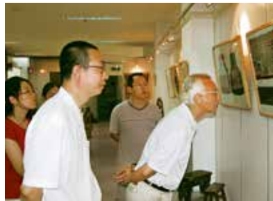
2005年，中国民俗学会会长、中国社会科学院学部委员刘魁立参观中国民艺博物馆

年实施的国家社科基金艺术学重大课题研究中提出了城镇化进程中传统工艺的发展策略，其间会同国际文化人类学家开展民艺田野调研，进行了深入研究和交流。