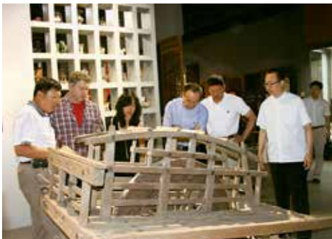
2010年，凤凰卫视考察团参观中国民艺博物馆