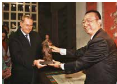
2009年，国际奥委会主席雅克·罗格(Jacques Rogge)参观中国民艺博物馆