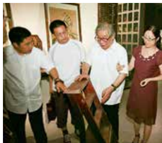
2009年，国务院学位委员会艺术学科评议组召集人、著名民艺学家张道一参观指导中国民艺博物馆

民艺中体现了一种美学观，其中包含一个丰沛的精神世界。在生活日用、装饰陈设、传统节日、人生礼仪、游艺娱乐以及生产劳动中，寄予了朴素的劳动感情、乐观的生活态度和美好的理想追求，充满了除恶扬善、辟邪扶正、和合圆满、吉祥如意的主旋律，反映出百姓对生活的热爱、对乡土的真情、对幸福的祈望，形成了我们民族乐观向上的精神风貌和民族气派。福禄寿喜的吉祥图案、避鬼驱邪的门神年画充满了人们对生活的期待与寄托，是真挚的，也是朴素而充满韧性的，更是无常、短暂甚至苦难也浇不灭的昂扬精神。张道一先生曾感慨，当他深入民间，与那些从未离开过家门的农村妇女交谈时，不仅感到她们情真、开朗、大方，也会被她们的“女红”所感染，从中领受到艺术的真实和人生的意义，“在民间艺术中蕴含着一种人间的真美，那是在美学书中找不到的”。