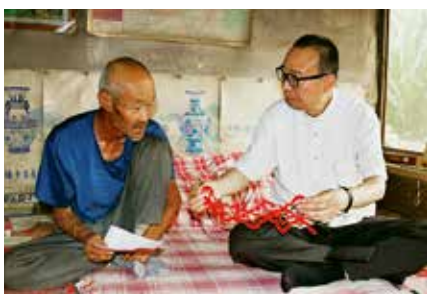
2018年，潘鲁生考察内蒙古和林格尔县舍必崖乡民间剪纸

劳和名次的。我希望他继续躬行于兹，成为在这块园地上耕耘的坚强者；既要坚强地做下去，又要坚强地站起来。虽然在当前的世风面前它显得有些软弱，甚至被冷落，但我坚信，这是中华民族文化发展的需要，也将是民族的光荣。”这几十年，研究中国的民艺学和手工艺学，成为我的学术目标和使命。调研工作是艰苦的，探究事理更需有严格的科学态度，既要把根扎在田野，还要由表及里、综合分析，把规律事理学深悟透。如张道一先生所言，“既然社会关系像一个蛛网，互相牵动着，民间艺术处在社会的底层，也必然有它的复杂性，有些问题仅仅用艺术的某些观点是难以解决的”，研究民艺需要更开阔的视野、更全面的思考和探索，对我来说，它已不只是志趣，更是一种人生的使命。