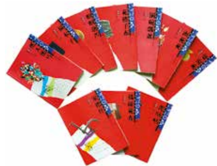
潘鲁生著《民艺学论纲》（上图）