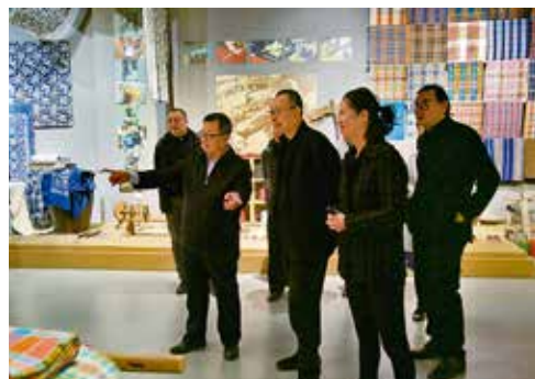
2019年，中国国家博物馆馆长王春法一行参观中国民艺博物馆