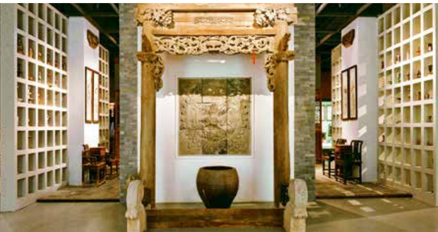
中国民艺博物馆场景