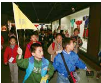
2008年，济南市青少年活动中心组织小学生参观中国民艺博物馆