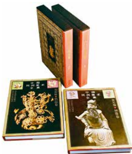
王朝闻、潘鲁生主编《中国民间美术全集·祭祀编·神像卷》《中国民间美术全集·祭祀编·供品卷》

我十分庆幸在世间千万行当里能与民艺结缘。这是一块坚实的土地，使我更深刻地感知过往、理解艺术、认识生活。在流水般的日子里，民艺承续着人之常情，即使看起来简单朴素的用具，其中也有岁月的磨砺、艰辛的劳动以及在单调反复中积淀的成熟，一切众生都云集于这个世界。民艺让人感到充实、活得踏实，没有荒废世间际遇所给予的一切。