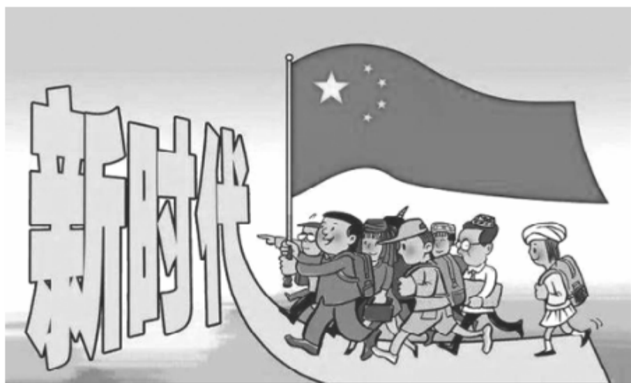
中国共产党的领导是“中国之治”的根本保证

“艰难困苦，玉汝于成。”近百年来，党团结带领人民在前进道路上遇到的艰难险阻是世界上其他任何政党所不能比