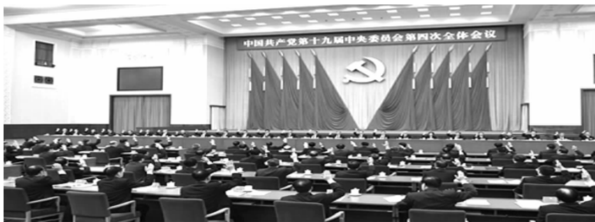
党的十九届四中全会对推进国家治理体系和治理能力现代化作出战略部署

“天下之势不盛则衰，天下之治不进则退。”要实现国泰民安、繁荣有序，必须健全制度、强化治理。“治理”一词，在我国春秋战国时期就已出现。《荀子·君道》中载：“明分职，序事业，材技官能，莫不治理，则公道达而私门塞矣，公义明而私事息矣。”此时的“治理”之意更倾向于要建立通过某些途径调节行政行为的机制。“国家治理体系和治理能力现代化”的内涵远不止于此。国家治理体系现代化是在党的领导下管理国家的制