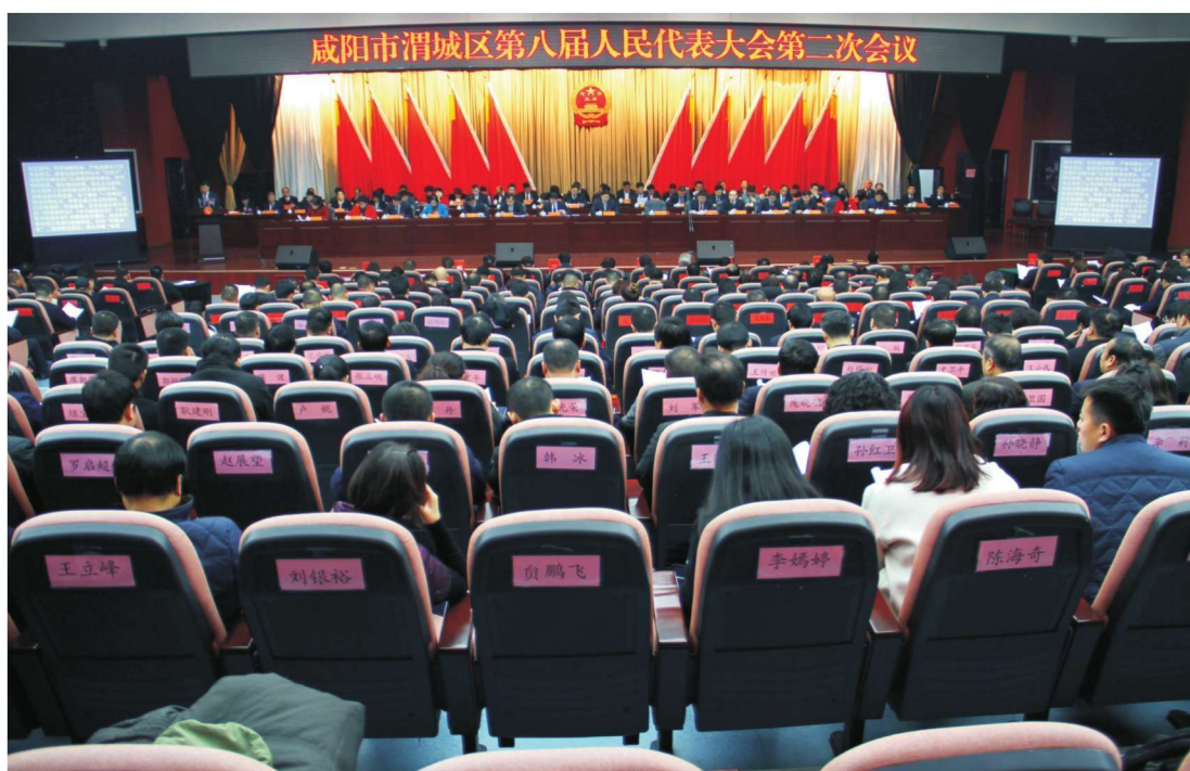
2018年2月2日，咸阳市渭城区第八届人民代表大会第二次会议在区行政中心大礼堂召开