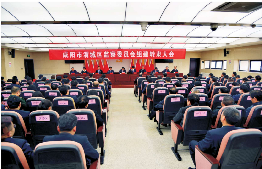
2018年2月6日，渭城区纪委监委组建转隶大会在区行政中心11楼报告厅召开