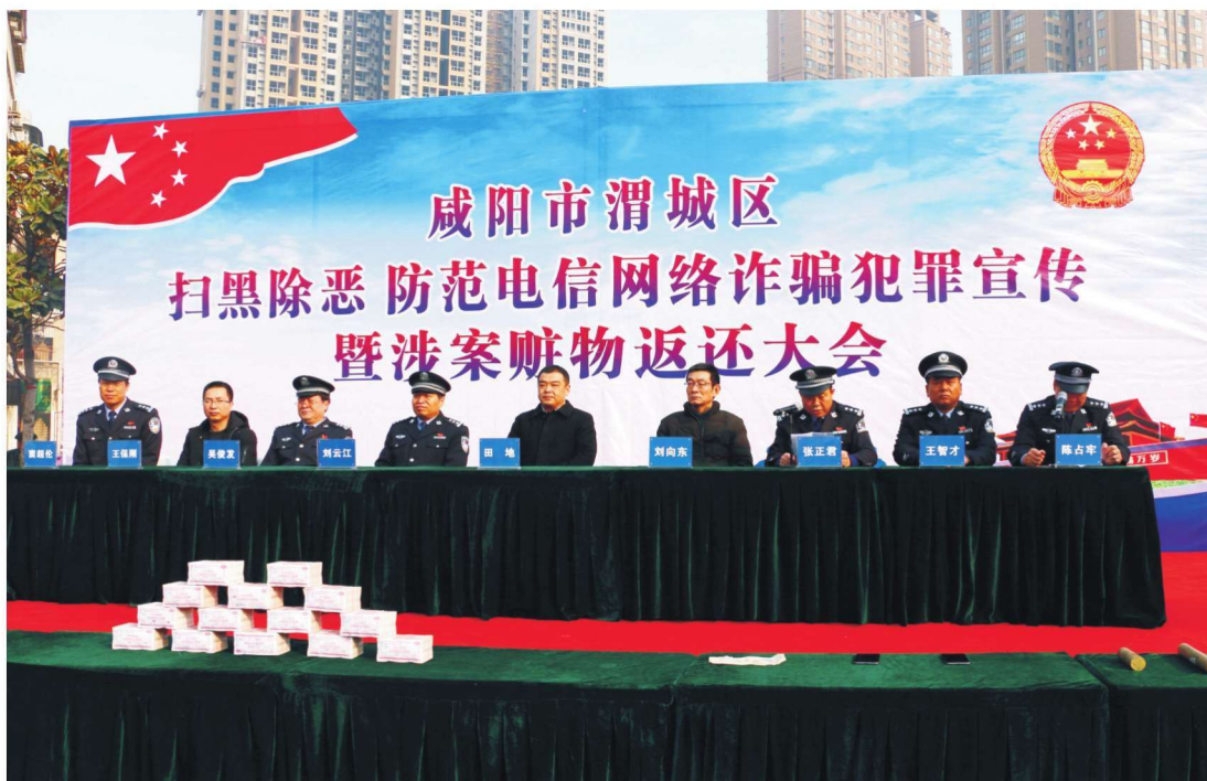
2018年12月20日，渭城区在凤凰广场举办扫黑除恶、防范电信网络诈骗犯罪宣传暨涉案赃物返还大会