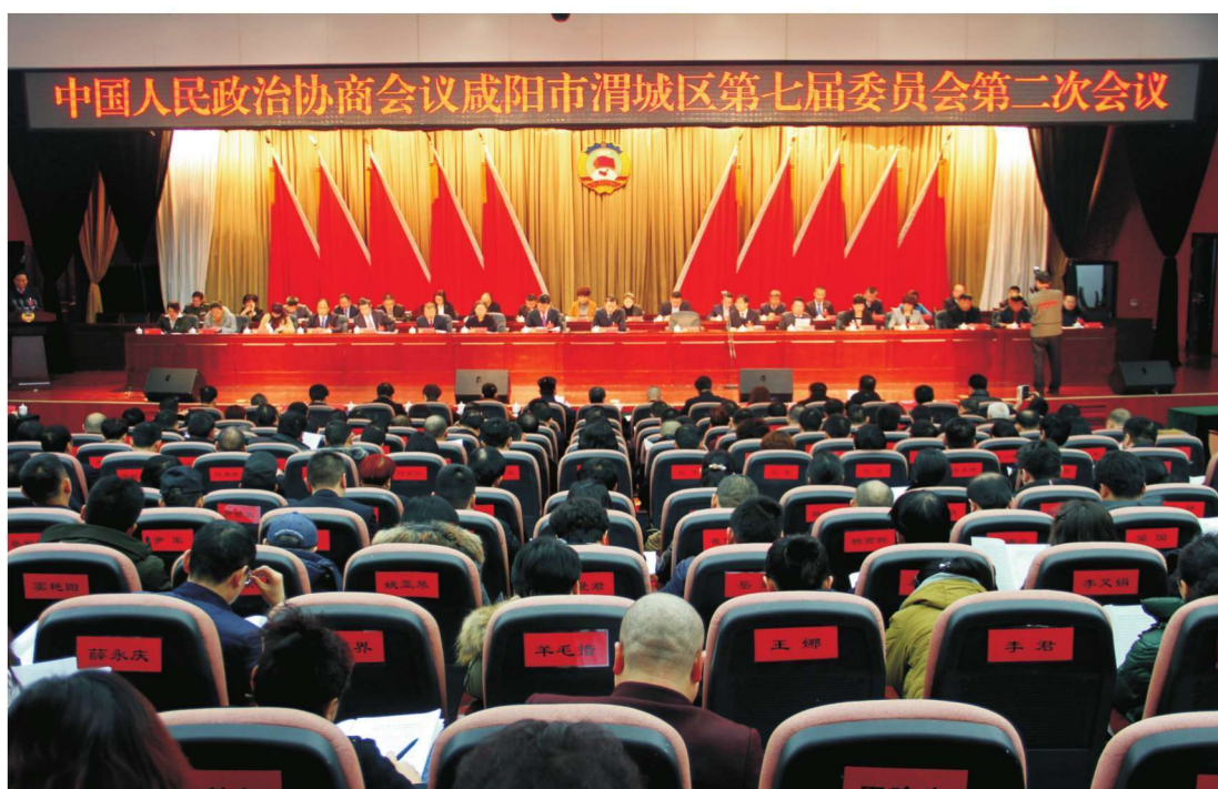
2018年2月1日，政协咸阳市渭城区七届二次会议在区行政中心大礼堂召开