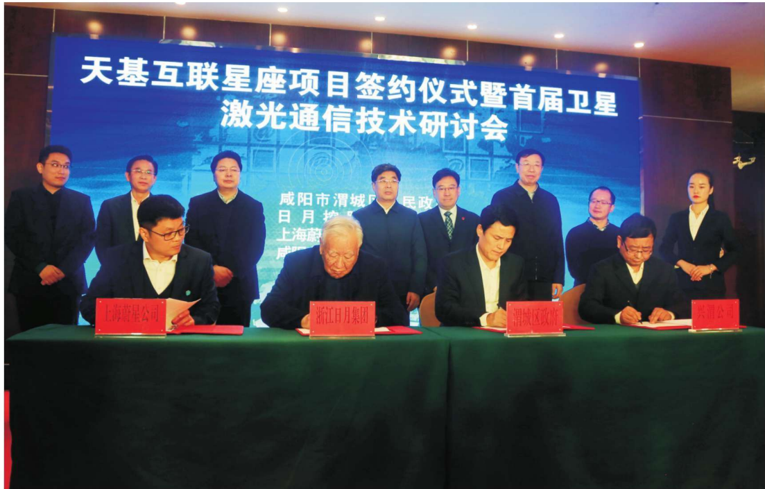
投资92.3亿元天基互联星座项目落户渭城