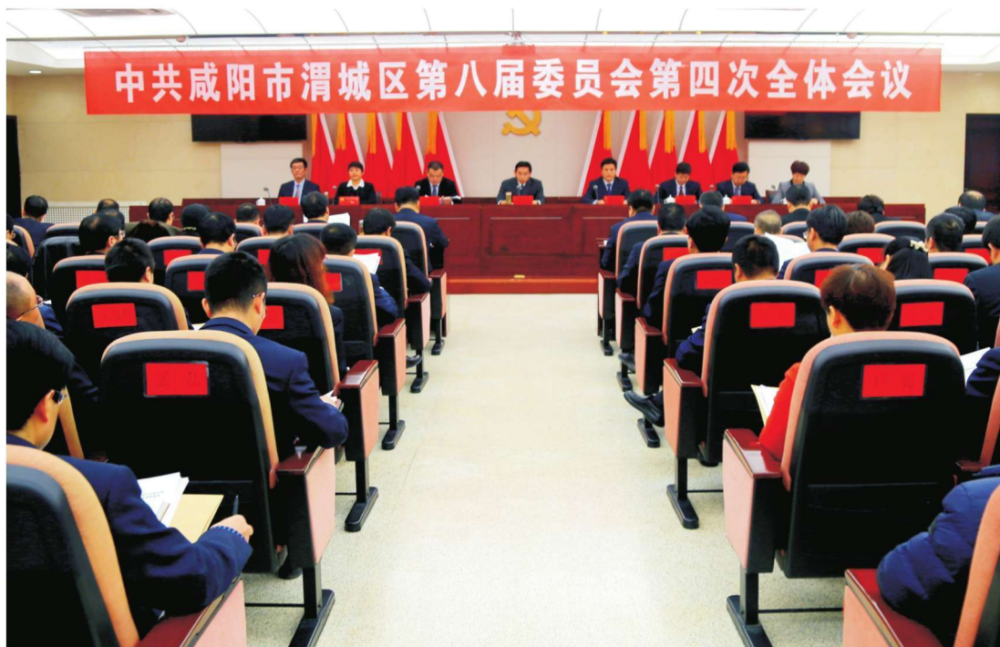
2018年1月23日，中共咸阳市渭城区第八届委员会第四次全体会议在区行政中心11楼报告厅召开