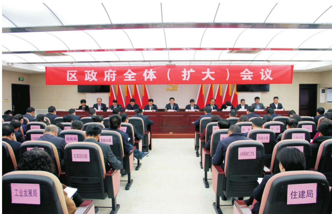
2018年3月5日，区政府全体（扩大）会议在区行政中心11楼报告厅召开