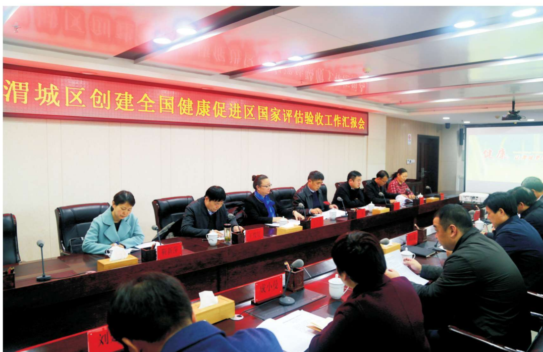
2018年11月27日，省创建全国健康促进区省级考核评估组来渭城区考核评估第三批创建全国健康促进示范区工作