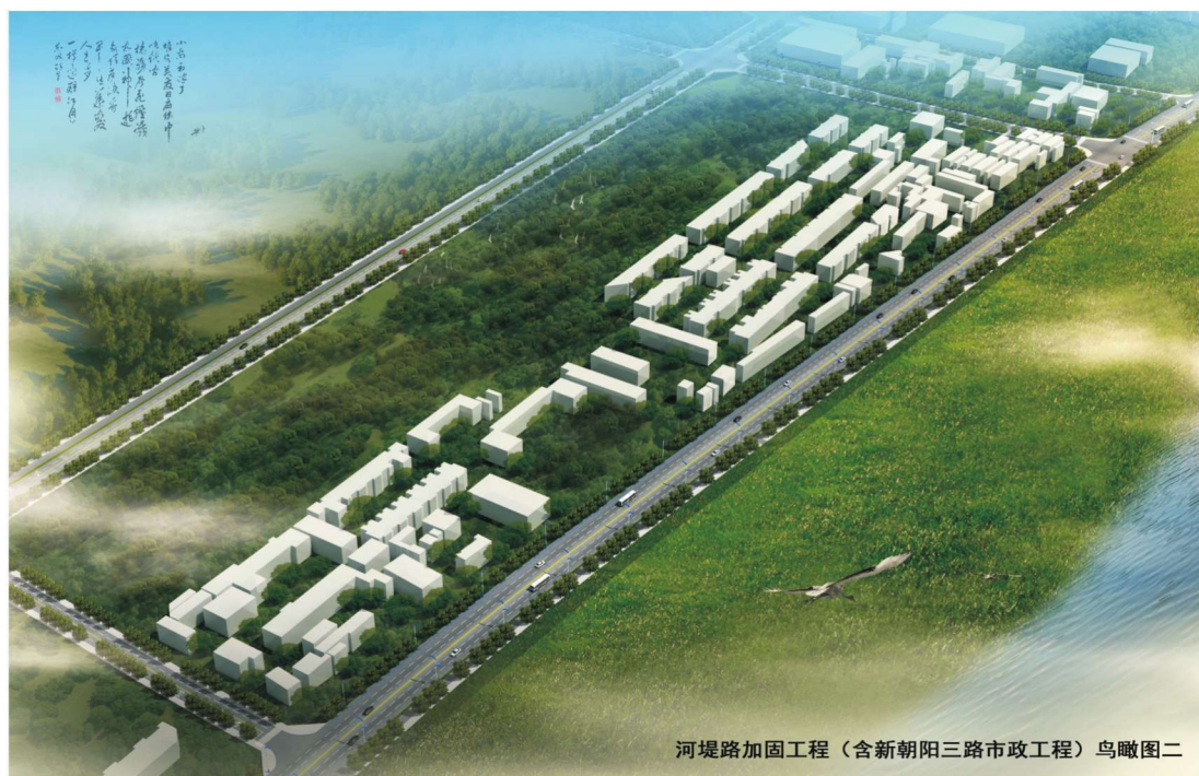
河堤路加固工程（含新朝阳三路市政工程）鸟瞰图二