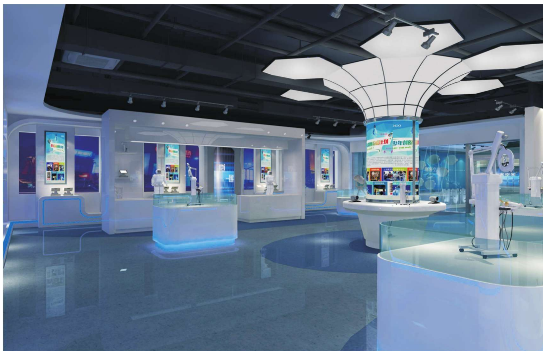
军民融合科技创新园一层创客展厅一隅