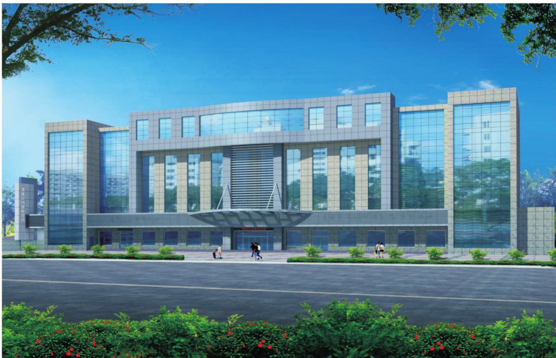
军民融合科技创新园