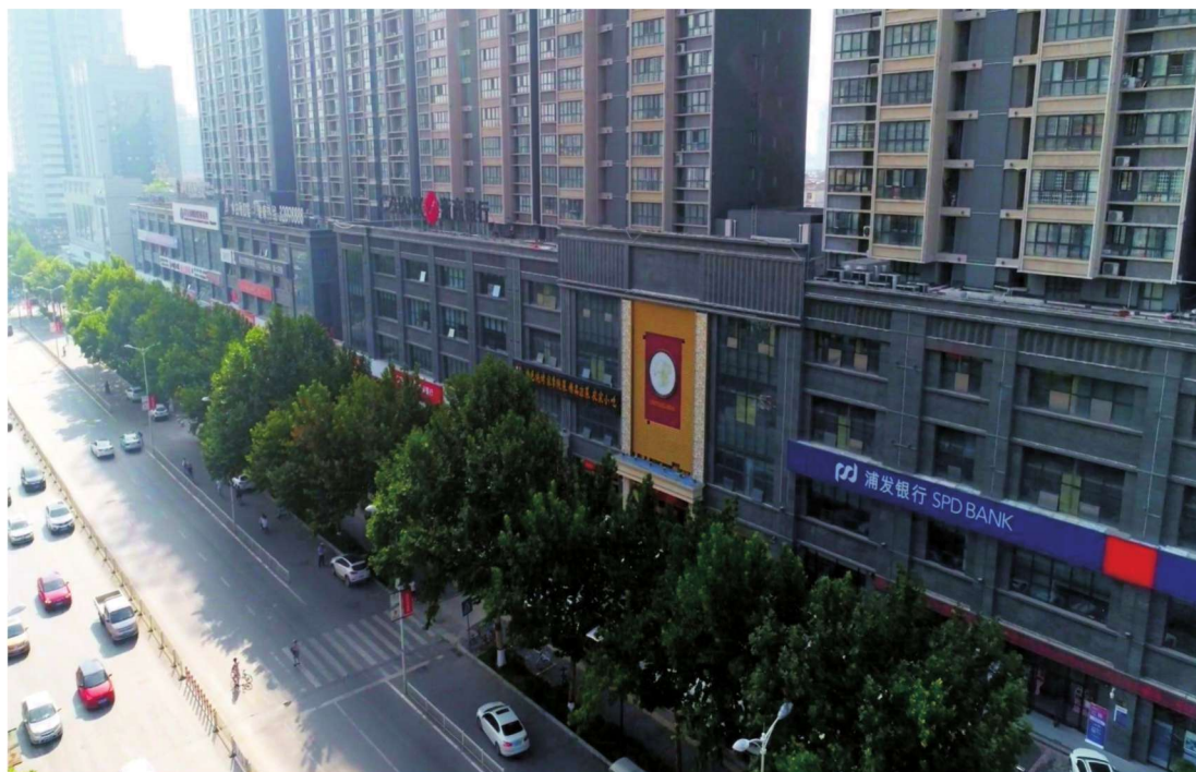
人民东路金融超市服务区