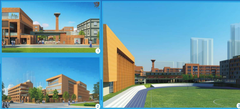
渭城中学迁建项目

渭城中学迁建项目是列入咸阳市政府（2014—2020年）基础设施建设规划项目库的重点工程，是市政府向全市人民承诺的三十件民生实事之一，也是渭城区实施的重点项目和重大民生工程。项目建设地址位于渭城区民生西路以北，纺织东路以南，原陕西八方纺织集团有限公司生产区所在地。占地面积约107亩，规划建设总面积约95941平方米。总投资5.7亿元，由渭城区政府采取PPP项目模式建设，由清华大学建筑设计研究院有限公司进行总包设计。建设期限2018—2020年。建成后的新校区可容纳72个教学班，在校学生3600名，主要建筑有：教学楼、科技楼、综合楼、图书馆、学生公寓、餐厅、多功能体育馆、运动场、艺术中心、校史馆及地下车库等。 渭城中学新校区位于城市政治、经济、文化中心区，该区域是咸阳市最繁华的地段之一，主要服务于四个街道办事处，40余个社区，随着城市规模的不断扩大，居住人口的不断增多，辖区内群众子女入学需求将越来越大。渭城中学这一知名品牌学校的迁址新建，将能极大地平衡市区教育资源，解决区域内群众子女上学的需求，凸显教育服务功能。 渭城中学新校区的兴建，是实施科教强市，优化我市教育战略布局调整，促进学校长远发展的一项重大举措。新校区的建成，将大大拓展渭城中学的办学空间，优化育人环境，增强办学实力，提高办学档次，更好地满足全市人民群众对优质高中教育的需求，更好地发挥教育教学示范引领作用。