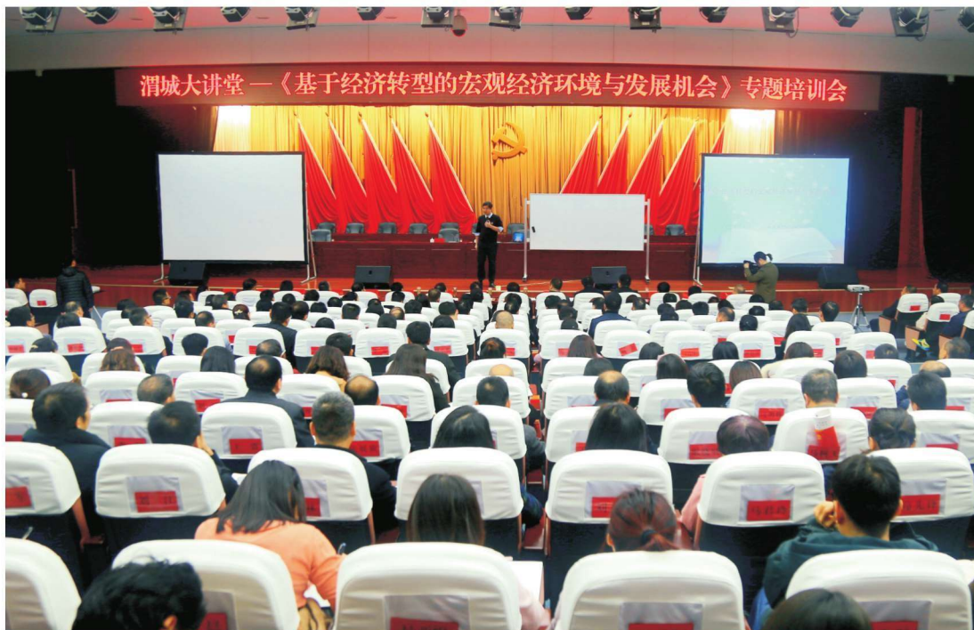
2018年11月23日，渭城大讲堂—《基于经济转型的宏观经济环境与发展机会》专题培训会在区行政中心大礼堂举办