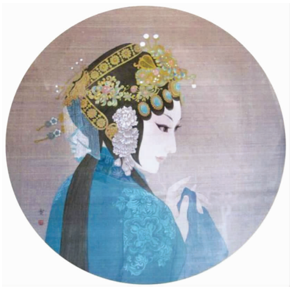
图1 京剧人物旦角壁画

大行当；三是有夸张性的化妆艺术——脸谱；四是“行头”（即戏曲服装和道具）有基本固定的式样和规格；五是利用“程式”进行表演。中国民族戏曲，从先秦的“俳优”、汉代的“百戏”、唐代的“参军戏”、宋代的杂剧、南宋的南戏、元代的杂剧，直到清代地方戏曲空前繁荣和京剧的形成，在世界戏剧史上独树一帜。