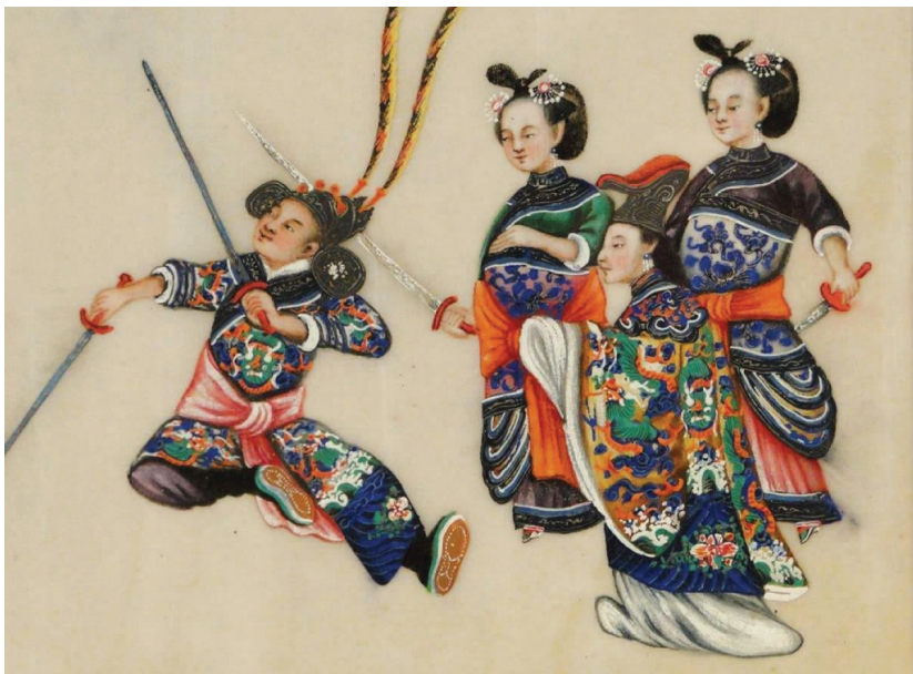
图6 清代戏曲人物通草水彩画(一)

戏曲到了明代,传奇发展起来了。明代传奇的前身是宋元时代的南戏(南戏是南曲戏文的简称,它是在宋代杂剧的基础上,与南方地区曲调结合而发展起来的一种新兴的戏剧形式。温州是它的发祥地)。南戏在体制上与北杂剧不同。它不受四折的限制,经过文人的加工和提高,这种本来不够严整的短小戏曲,终于变成相当完整的长篇剧作。例如高明的《琵琶记》就是一部由南戏向传奇过渡的作品。这部作品