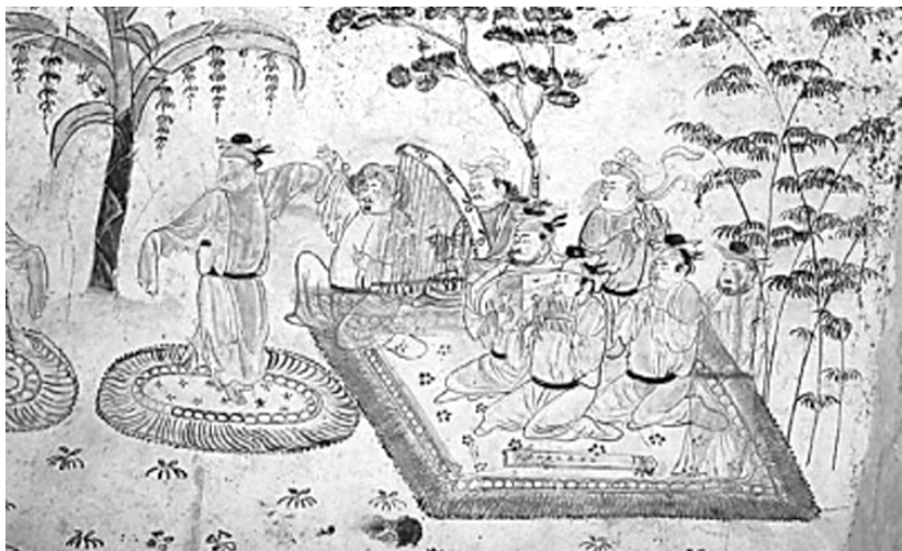
图3 唐墓壁画演剧图

唐代的主要戏剧有全能戏、歌舞戏、参军戏、傀儡戏等,但唐戏的剧目及其表演在当时远比目前所能看到的记载更为丰富生动。唐代戏剧是跨文化传播的成果。它在当时既受到西域歌舞戏剧的深刻影响,又受到印度梵剧的濡染,形成了颇具特色的唐代戏剧文化,进而向亚洲其他国家和地区广泛传播,在世界范围内产生了深远的影响。