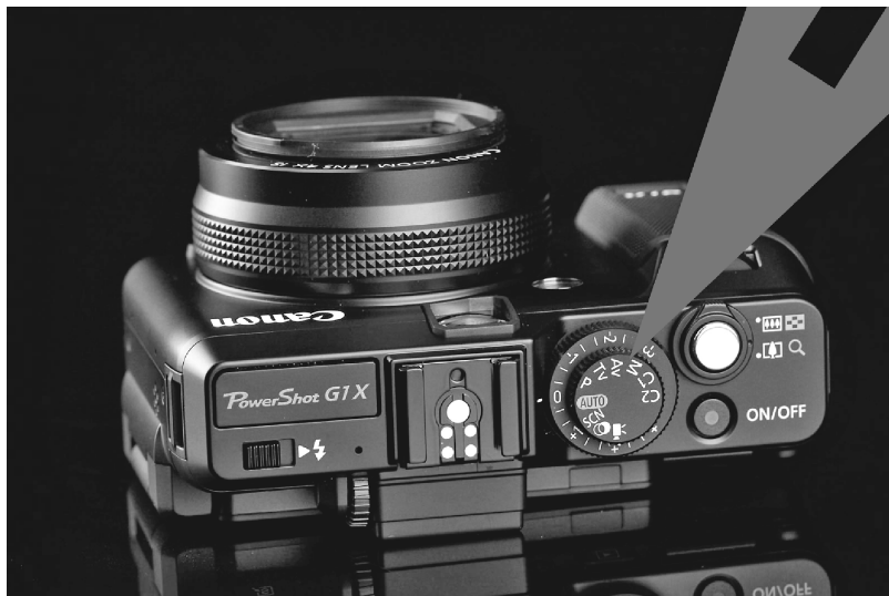
图 1-2 卡片机上的可手动切换的曝光模式

可手动切换的曝光模式有:全自动程序曝光模式(P)是卡片机的常规配置,除此之外,光圈优先曝光模式(Av)、速度优先曝光模式(Tv)和全手动曝光模式(M),也各具实用价值(见图 1-2)。