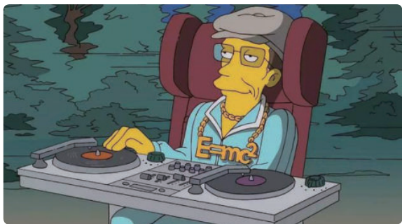
动画片《辛普森一家》中的霍金

2018年3月14日，史蒂芬·霍金去世，享年76岁。霍金的研究在统一20世纪物理学两大基础理论——爱因斯坦创立的相对论和普朗克创立的量子力学方面走出了重要一步。虽然他一生的大部分时光在轮椅上度过，与人交流只能依靠三根手指操作，但这不妨碍他成为世界上最伟大的物理学家之一。