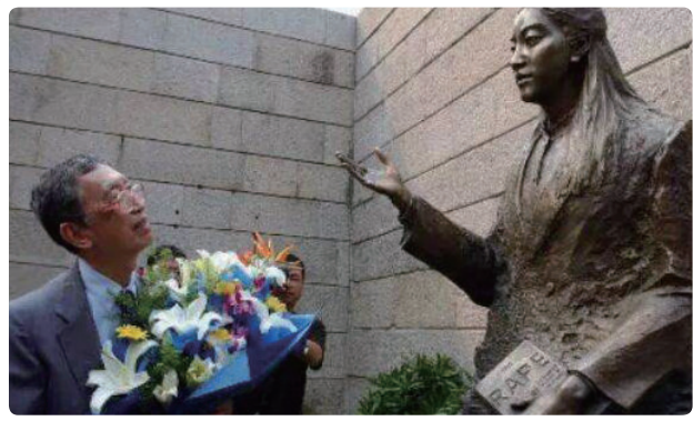
侵华日军南京大屠杀遇难同胞纪念馆外的张纯如铜像

华裔作家张纯如如是小编乌米非常喜爱的一位历史作家。她生于1968年3月28日，可惜英年早逝。她的代表作是《南京大屠杀：第二次世界大战中被遗忘的大浩劫》，这是第一本充分研究南京大屠杀的英文著作。在书中，这位美丽的女子以巨大的勇气，首次向西方国家揭露了南京大屠杀事件的真相。记录真实，正是历史学家的责任。