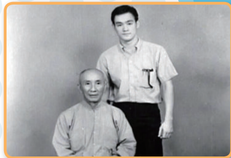
一张珍贵的老照片，左为叶问，右为李小龙。

提起“叶问”和“咏春拳”，在读《探索历史》的男同学有没有感到热血沸腾？叶问七岁时拜师学习咏春拳，刻苦钻研拳技，将咏春拳推广至世界各地。叶问的弟子中，最著名的莫过于将中国功夫发扬光大的武打巨星李小龙。1972年的今天，一代宗师叶问在香港逝世。