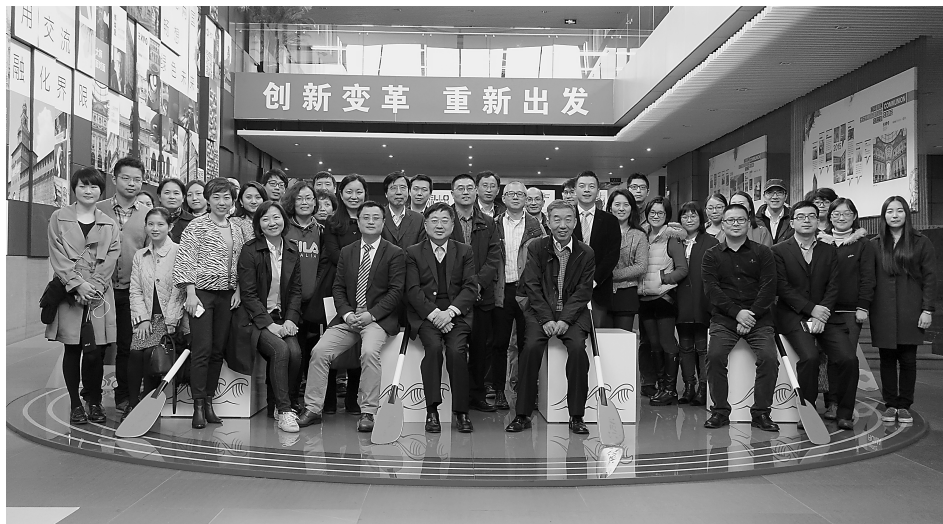
2015年张江高科对标先进学习活动