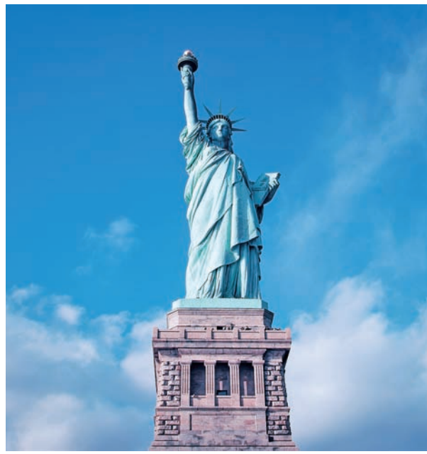
图 1.16 美国纽约 自由女神塑像 弗里德利·奥古斯特·巴特勒迪设计 于 1886 年落成