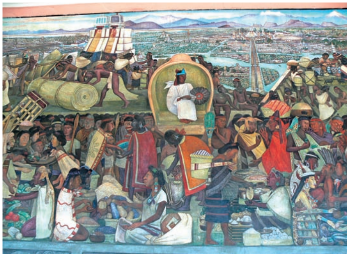
图 1.18 墨西哥城国家宫《墨西哥的历史与未来》局部 (一) 迭戈·里维拉 1929—1935