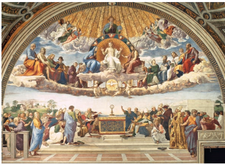
图 1.11 拉斐尔《圣礼的辩论》1510—1511