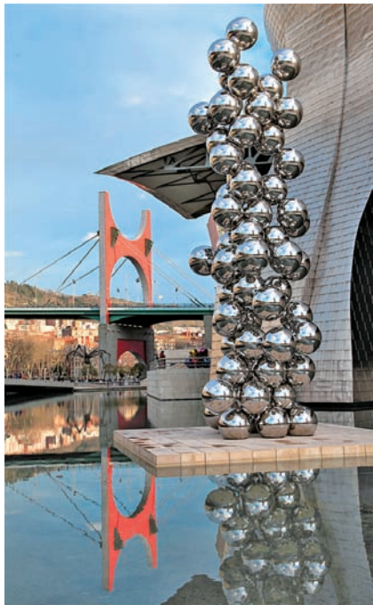
图 1.1 古根海姆美术馆《高大的树木与眼睛》阿尼什·卡普尔 2009

公共空间虽是公众共有，但多由政府管控，因此公共艺术创作需要考虑当地法律政策，有时需要