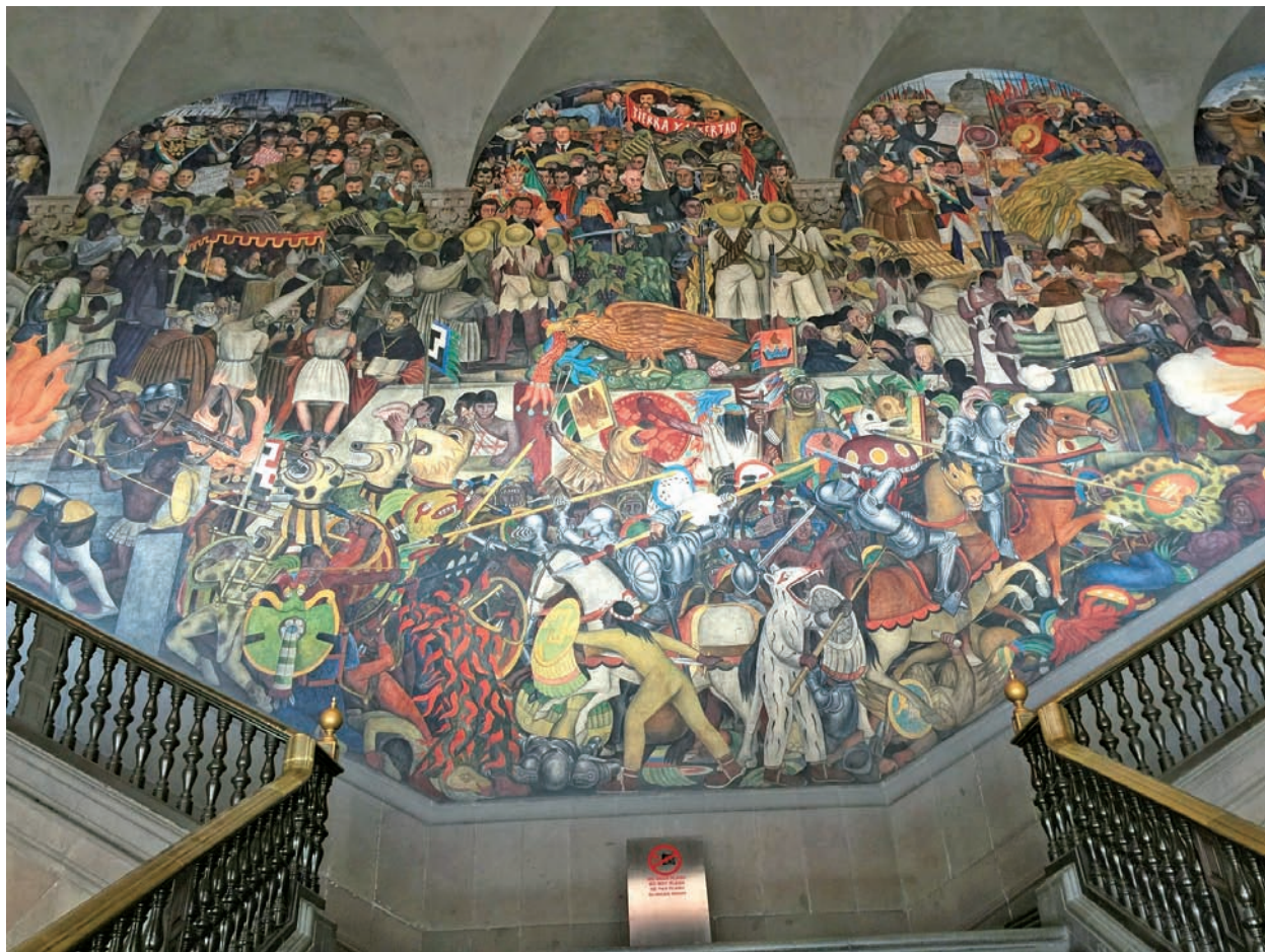
图 1.17 墨西哥城国家宫《墨西哥的历史与未来》迭戈·里维拉 1929—1935

里维拉为墨西哥城国家宫创作的作品是在殖民政府遗留下来的宫殿中央楼梯的回廊所做的大型历史题材壁画（图 1.17～图 1.20），创作历时 7 年。内容自印第安人创造文化和神话开始，经过西班牙殖民时代，一直到墨西哥人民为争取民族独立而进