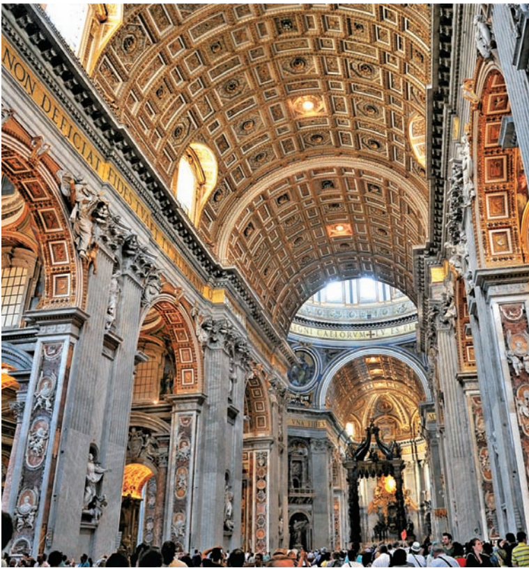
图 1.13 梵蒂冈 圣彼得大教堂（二） 建于 1506—1626 年

始于 17 世纪的巴洛克艺术出现在天主教反对宗教改革最强烈之时的教廷所在地罗马。在建筑上，最有代表性的就是位于梵蒂冈的圣彼得大教堂（图 1.12、图 1.13），它是全世界第一大圆顶教堂。意大利文艺复兴时期的多位建筑师与艺术家如多纳托·伯拉孟特、拉斐尔、米开朗琪罗和小安东尼奥·达·桑加罗等都曾参与圣伯多禄大殿的设计。教堂广场的设计人是吉安·洛伦佐·贝尼尼。教堂内保存有欧洲文艺复兴时期许多艺术家如米开朗琪罗、拉斐尔等的壁画与雕刻。