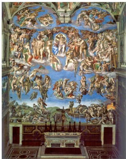
图 1.10 梵蒂冈西斯廷教堂 壁画《最后的审判》 米开朗琪罗 1534—1541