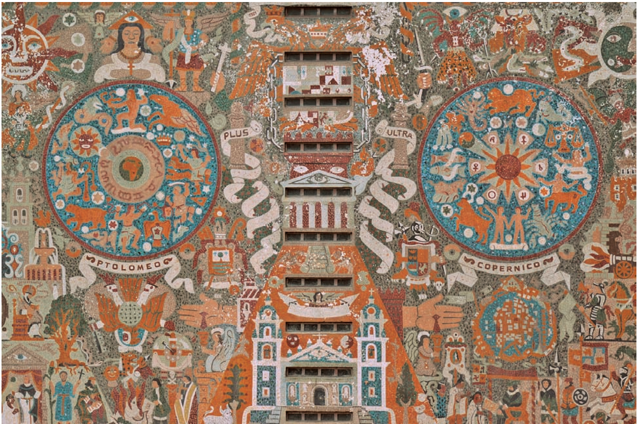
图 1.22 墨西哥城国立中央图书馆 壁画《人类的进步和奋斗》(二) 奥戈尔曼

国立自治大学中央图书馆是一幢 10 层高的大楼,整幢大楼外侧装饰有五彩缤纷的巨幅壁画,全部用 1 厘米见方的彩色马赛克拼接而成。楼南面是图书馆入口,此处壁画描绘的是西方对墨西哥的影响、西班牙对墨西哥的征服以及太阳中心说;北面壁画表现的是西班牙殖民前的印第安社会、古代墨西哥城的奠基、印第安人传说中主宰生死的神;东面壁画反映的是墨西哥革命和现代社会的生活变迁;西面则是国立自治大学的标志(图 1.23)。2007 年,中央图书馆被联合国教科文组织列入世界文化遗产名录。