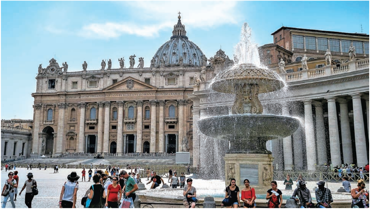
图 1.12 梵蒂冈 圣彼得大教堂（一） 建于 1506—1626 年