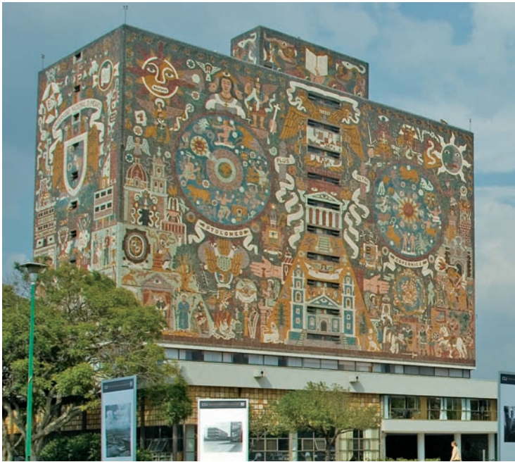
图 1.21 墨西哥城国立中央图书馆 壁画《人类的进步和奋斗》(一) 奥戈尔曼

墨西哥城国立自治大学中央图书馆(图 1.21、图 1.22)外墙绘有墨西哥最大的壁画,是由著名画家胡安·奥戈尔曼创作的《人类的进步和奋斗》。