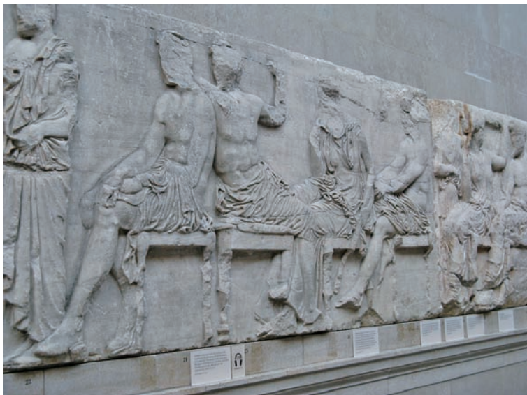
图 1.3 帕特农神庙 (建于公元前 447 年—公元前 432 年)

之后，罗马帝国继承并发扬了古希腊的艺术文化成果，成为西方艺术中心。例如，建于公元 315 年的君士坦丁凯旋门及其上的浮雕 (图 1.6、图 1.7)。