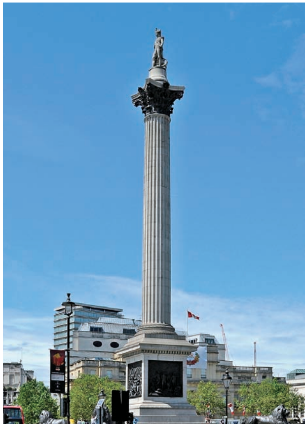
图 1.14 英国伦敦市 纳尔逊纪念柱 威廉·莱尔顿设计 建于 1840—1843 年

在欧洲，公共艺术呈现多元化，有新古典主义风格的伦敦国家画廊，新哥特风格的英国议会大厦（即威斯敏斯特宫），哥特风格的法国巴黎歌剧院、现代主义建筑风格的埃菲尔铁塔等。