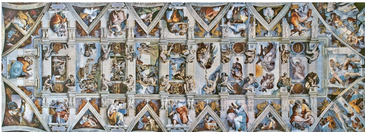
图 1.9 梵蒂冈西斯廷教堂天顶画《创世纪》局部 米开朗琪罗 1508—1512

米开朗琪罗最著名的绘画作品是梵蒂冈西斯廷教堂的天顶画《创世纪》（图1.9）和壁画《最后的审判》（图1.10）。拉斐尔的《圣礼的辩论》（图1.11）是文艺复兴时期湿壁画的代表作。