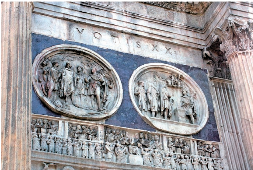
图 1.7 君士坦丁凯旋门的浮雕 建于公元 315 年（二）