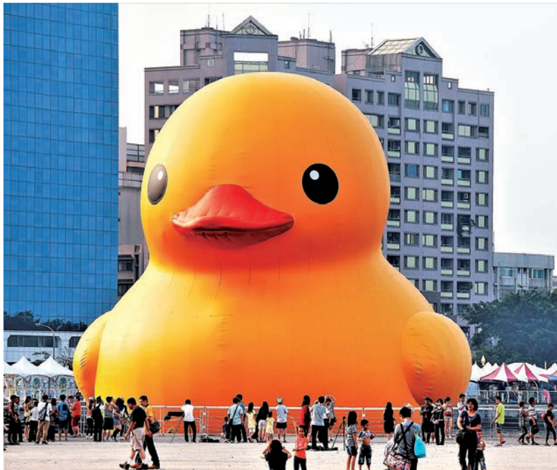
图 1.2 中国香港《大黄鸭》弗洛伦泰因·霍夫曼 2013