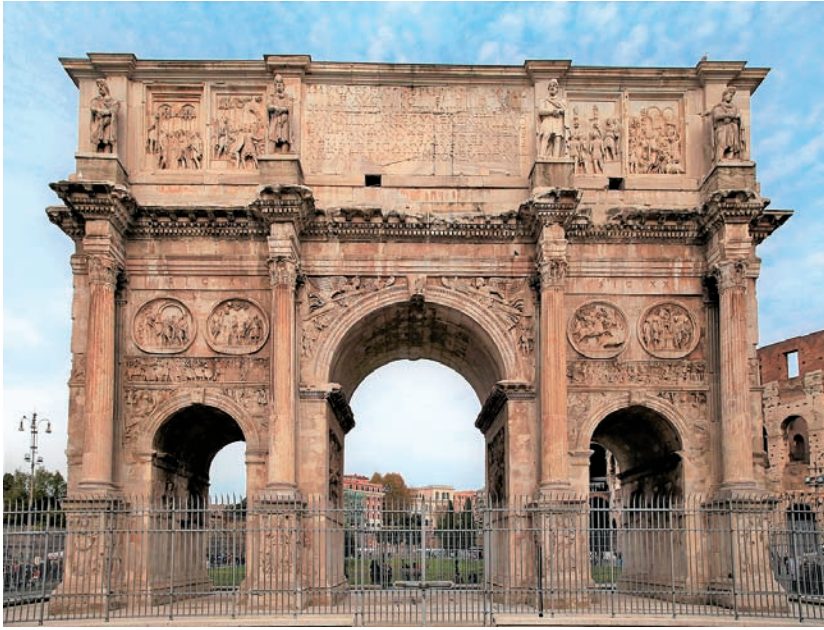
图 1.6 君士坦丁凯旋门的浮雕 建于公元 315 年（一）

此外，罗马帝国还兴建了很多纪念性建筑，其中最具代表性的就是图拉真纪功柱。公元 113 年，为纪念皇帝图拉真胜利征服达西亚，由建筑师阿波罗多洛斯（Apollodorus）建造，以柱身精美浮雕而闻名（图 1.8）。