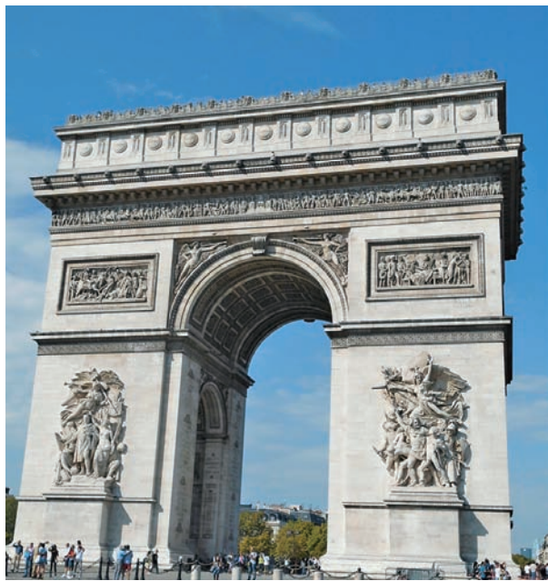
图 1.15 巴黎凯旋门 建筑师让·夏格伦设计 建于 1830—1836 年