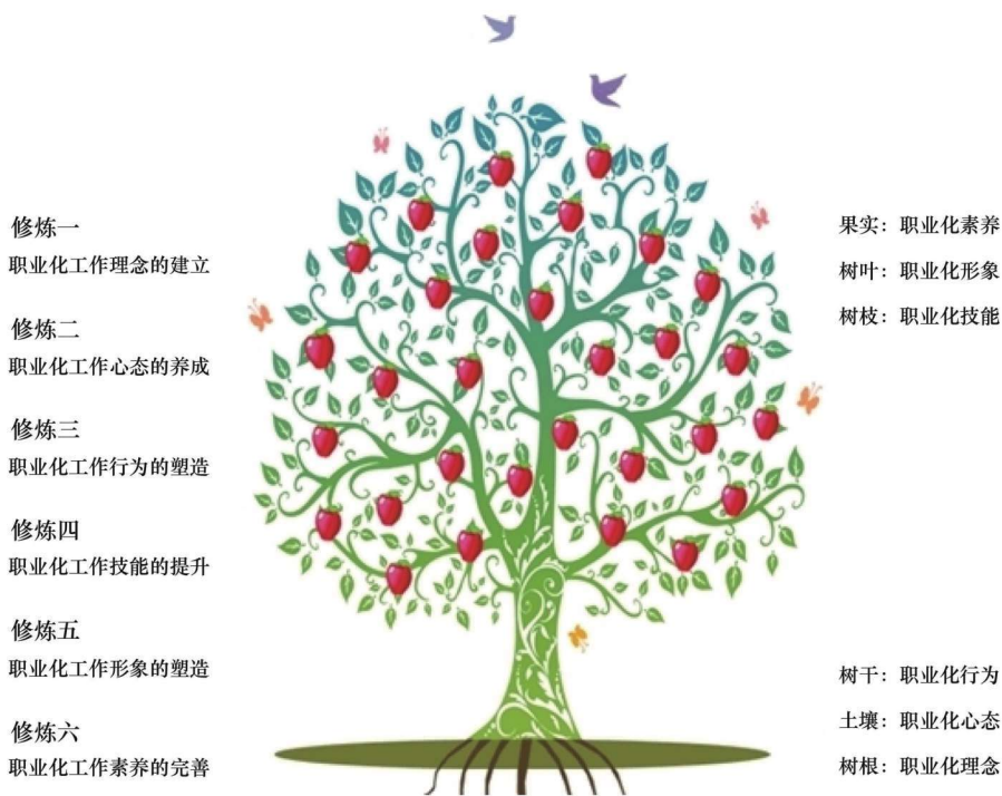
图 1-1 企业全员职业化成长“六维修炼模型树”

如果将整个职业化过程比喻成大树，那么它的体系呈现为一种“树形”结构，最重要的“根部”就是职业化的理念和心态，“树干部分”是职业化的方法和技能以及有关的工具，“枝叶部分”则是职业化的形象和礼仪。现在我们通过一个模型，可以更清楚地了解。图 1-1 为企业全员职业化成长“六维修炼模型树”。