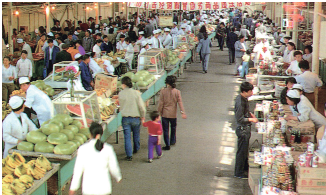
20 世纪 80 年代，辽宁鞍山的农贸市场。

与全国人民一样，仍旧在短缺经济的困境中艰难度日。相比于发达的重工业，轻工业和日用品生产相对薄弱。特别是农业生产，当时的辽宁还是粮食调入省，不能自给自足，辽宁人民的生活，尚不能实现温饱。20 余年的时间里，虽然时有小幅提高，但又经常因特殊情况陷入回落。