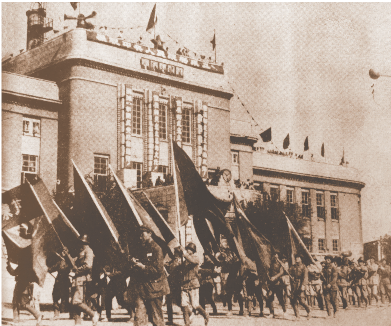
1949年10月1日，中华人民共和国成立，沈阳市举行庆祝大会，图为庆祝队伍。