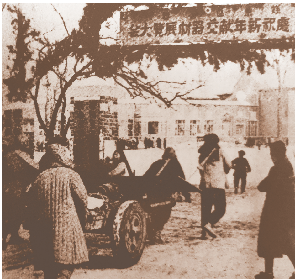
1949年初，鞍山掀起献纳器材运动。图为工人将献纳的各种器材送往展览会。

单军帽、单胶鞋、军毯以及军用毛巾、袜子寸带、麻袋、哗叽布和帆布等，全部支援了关内我军作战。很多人都听过开国元帅陈毅的一句名言：“淮海战役的胜利，是（沂蒙）人民群众用小推车推出来的。”但很多人并不知道，淮海战役的另一位大功臣、当时的华东野战军副司令员粟裕还有一句补充：“华东地区的解放，特别是淮海战役的胜利，离不开山东的小推车和大连的大炮弹。”