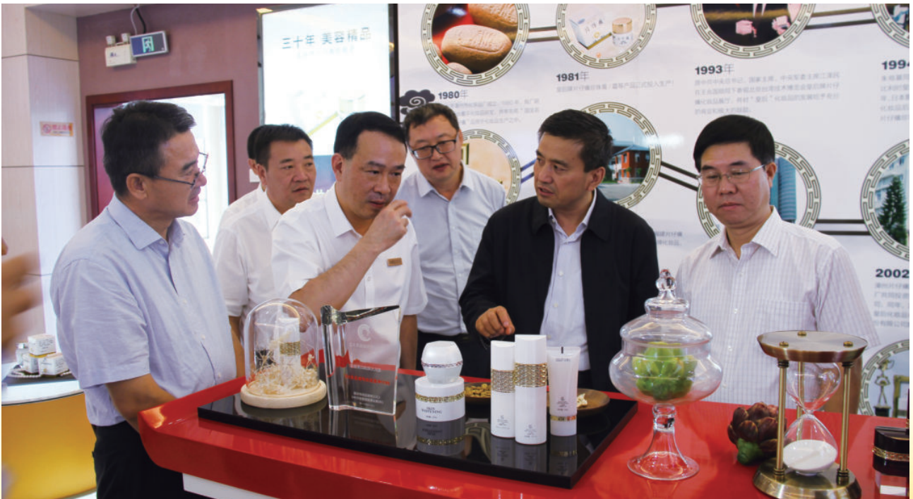
2018年9月，吴忠市市长喜清江带队赴福建漳州考察