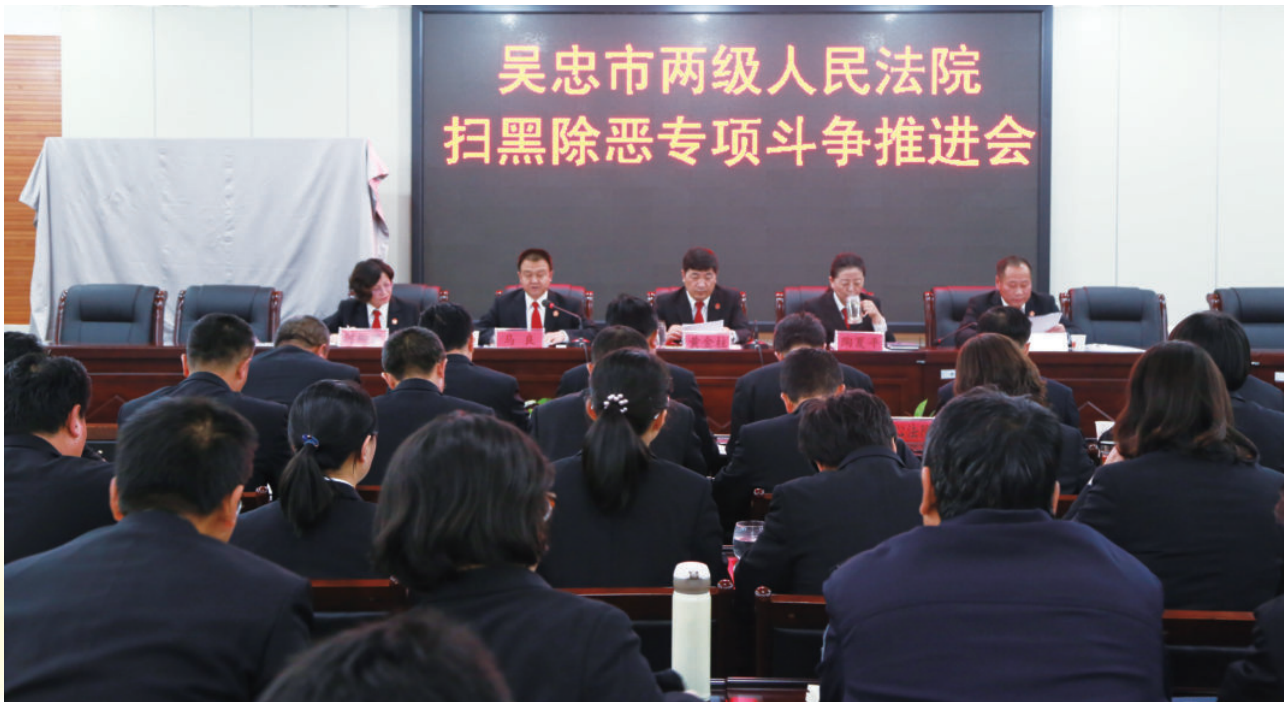
2018年11月16日，吴忠两级人民法院扫黑除恶专项斗争推进会召开