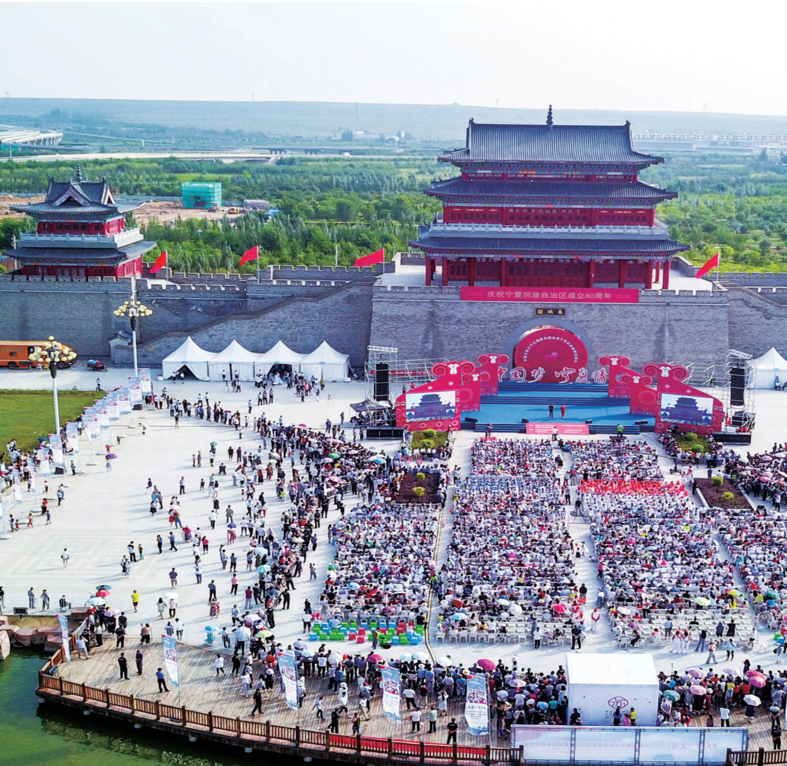
2018年8月10日，“中国梦 宁夏情”中国文联文艺志愿服务团走进盐池县慰问演出