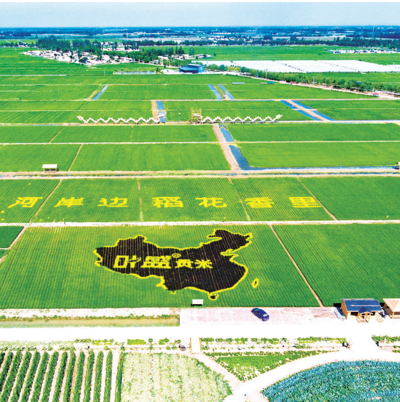
青铜峡优质大米种植基地