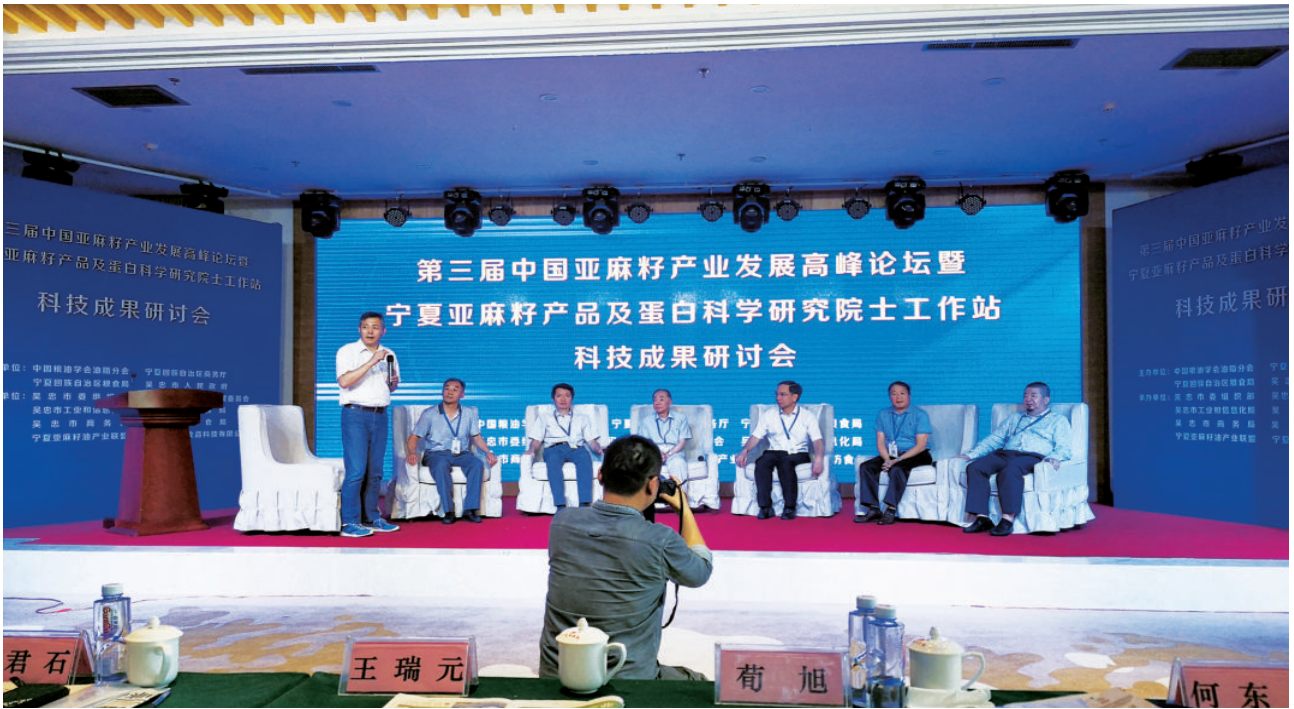
2018年8月，第三届中国亚麻籽产业发展高峰论坛暨宁夏亚麻籽产品及蛋白科学研究院士工作站科技成果研讨会在吴忠召开