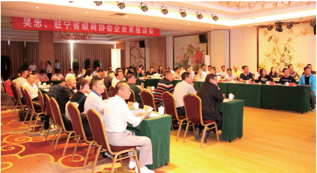
2018年6月1日，吴忠市召开吴忠、驻宁省级商协会企业家座谈会