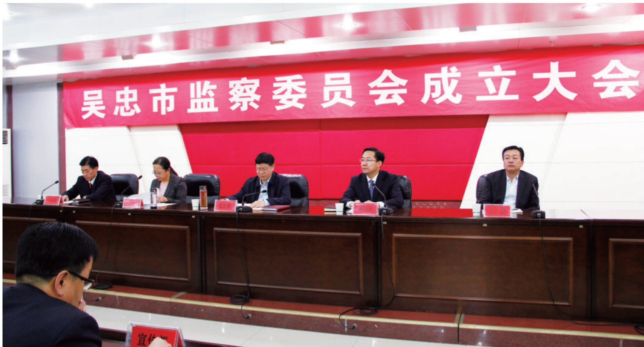
2018年1月8日，吴忠市监察委员会成立大会召开