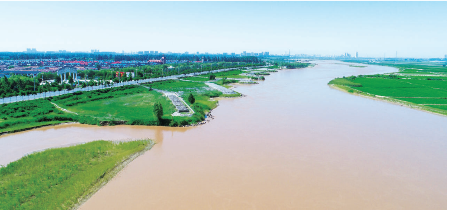
黄河吴忠段二期防洪治理工程