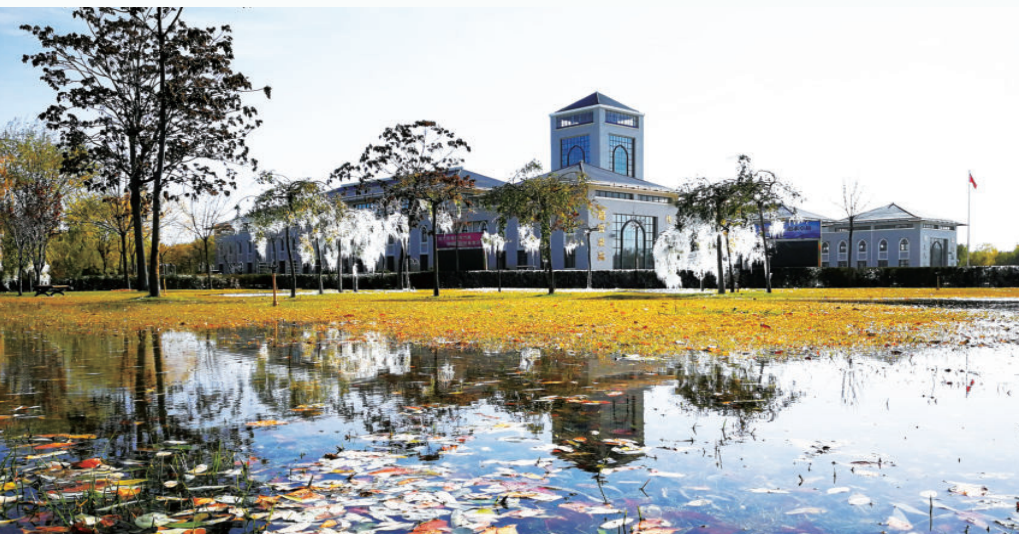
宁夏民族职业技术学院一角