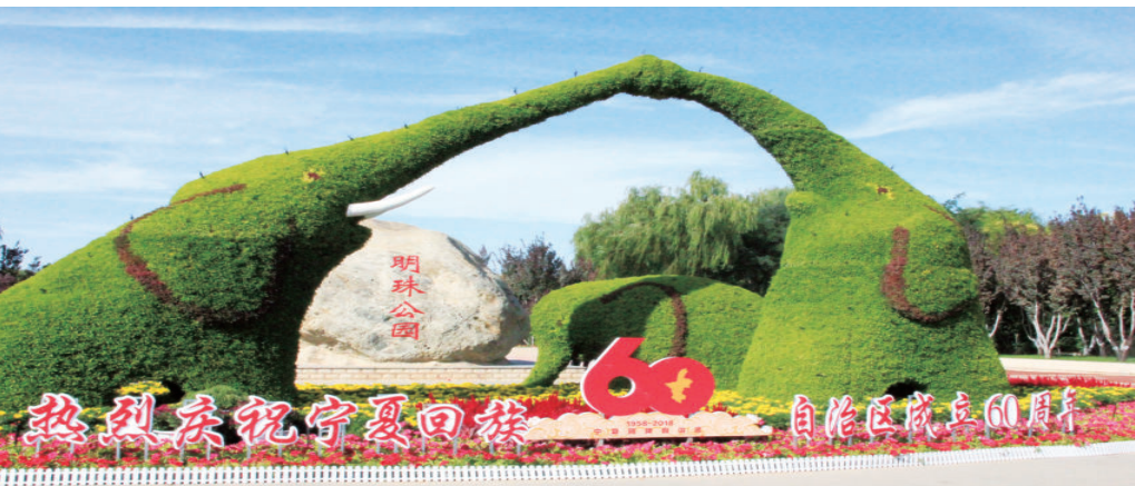
庆祝宁夏回族自治区成立 60 周年布展景观