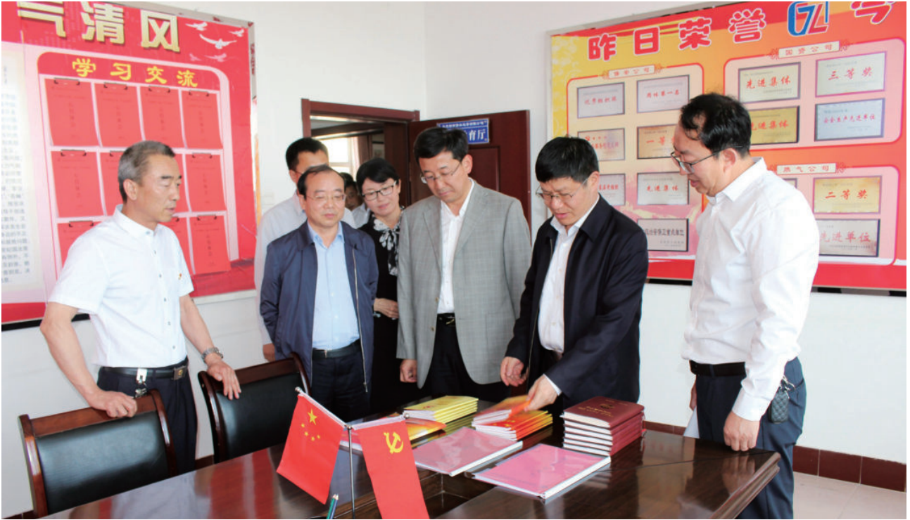
2018年5月，吴忠市委书记沈左权调研国有企业党建工作