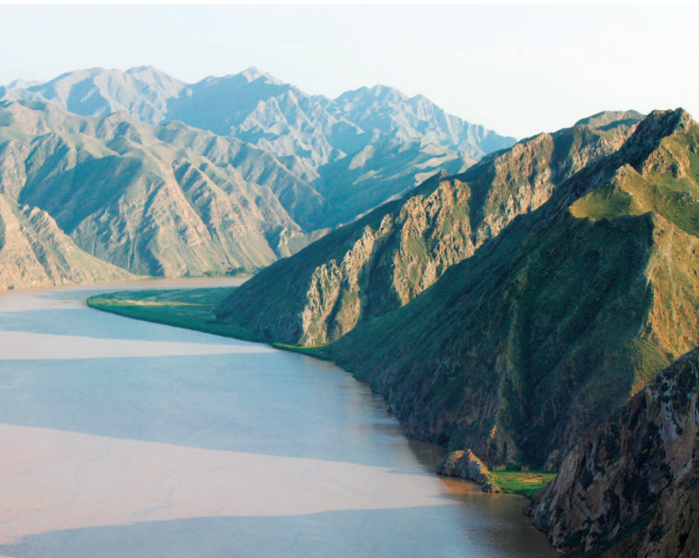
青铜峡黄河大峡谷