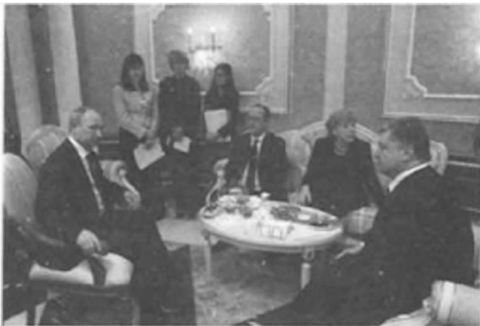
俄罗斯、乌克兰等五国就乌克兰危机进行和平谈判

现代国防虽然与传统的国防一样都是为了维护国家利益，但它所维护的国家利益，无论是内涵，还是范围，以及维护国家利益的行为方式，都远比以前丰富得多。国防所维护的国家利益主要是安全利益。首先，它是指国家作为一个政治利益实体的安全，包括巩固国家政治制度和领土主权完整，维护主导意识形态、民族团结和统一等。其次，它还指国家作为一个经济利益实体的安全，包括国家资源和经济活动、人民群众生命财产的不可侵犯性等。此外，它还指国家作为国际社会成员的地位和威望。一个国家在国际上的地位、尊严、荣誉、信誉、对外友好关系等，对国家的生存与发展都有着十分重大的影响。