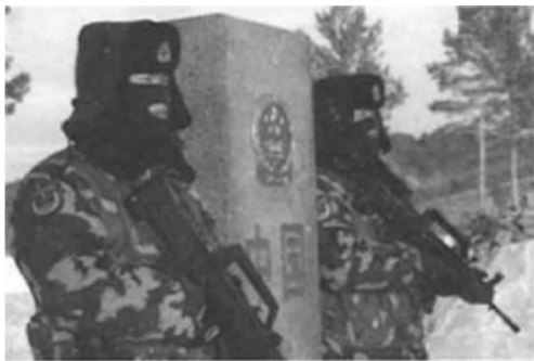
边防官兵雪中巡护边境

国防是指国家为了防备和抵抗侵略，制止武装颠覆，保卫国家主权、统一、领土完整和安全所进行的军事活动以及与军事有关的政治、经济、外交、科技、教育等方面的活动。维护国家安全利益是国防的根本职能；捍卫国家主权、领土完整和防止外