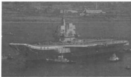
中国首艘国产航母下水，百年航母梦终圆

法》的界定，国防的对象，一是“侵略”，二是“武装颠覆”。“侵略”包括武装侵略和非武装侵略。武装侵略是指战争状态的侵略行为。对付武装侵略，国防行为使用战争手段进行制止。非武装侵略，是指运用各种经济、外交等手段进行的侵略行为。对付非武装侵略，国防行为则相应使用非战争手段。“武装颠覆”是指颠覆国家政权、推翻社会主义制度的武装叛乱或者武装暴乱。这些武装叛乱、武装暴乱，对国家主权、统一、领土完整和安全，对我们的社会主义制度都构成严重威胁，必须运用国防力量加以制止。