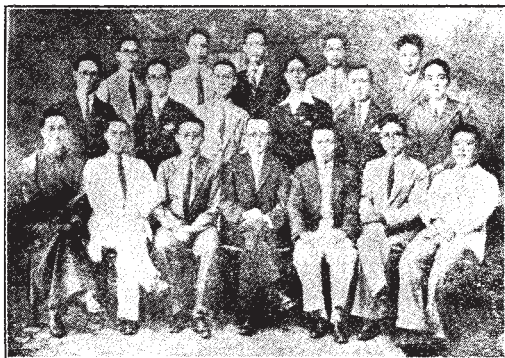
↑這是現在在開羅的中國回教人，總數有十八位都在愛登哈大學讀書；都住在麥達賴斯街五號。以後，中國回教學生能加到少人，不敢定，往上溯，這十八個人的合影已然空前了！