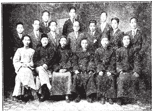
↑這是民國廿一年在開羅的中國回教人合影。那時已然有十六個人了。這兩幅圖，可以表示在開羅中國回教人今昔的兩個全盛時期。