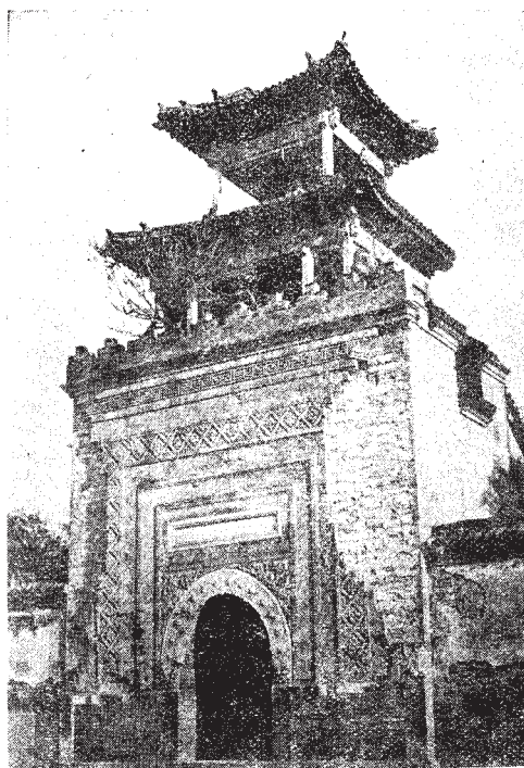
↑這是昔年北平回回營清真寺的宣禮樓。至今已傾圮已有卅年了。圖為光緒末葉所攝