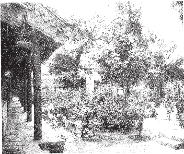
←這是現在的北平東四牌樓清真寺中院。屋舍精潔，花木滿院；置身其間，心神怡爽；人世之天堂也。