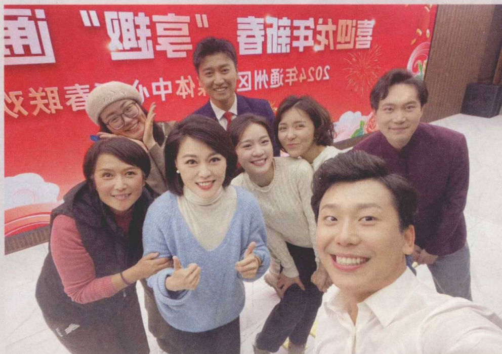
在一年一度的通州融媒新春联欢会上，播音员、主持人们绝对是活宝级别的存在