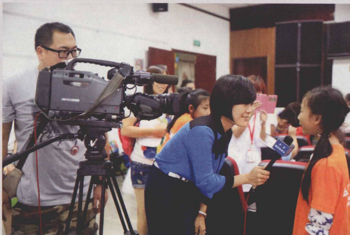
十年记者生涯，比起镜头前的光鲜，我更珍视手中的话筒，它让你我都能发声。深入街道乡镇，探访学校、民居，让我离北京城市副中心这片土地的心跳更近