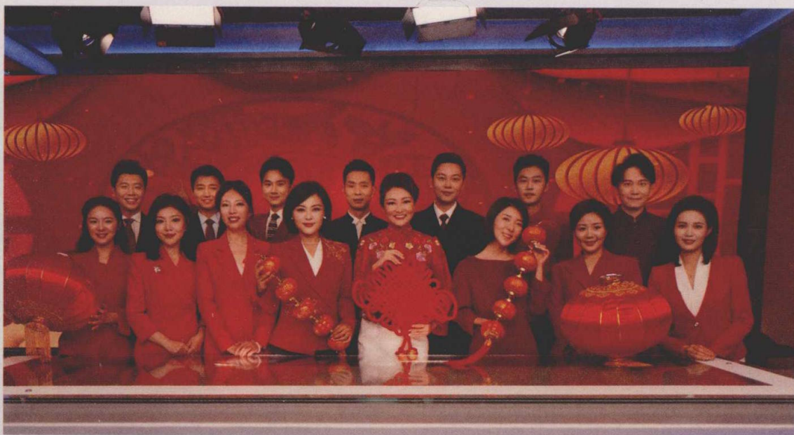
新年伊始，通州融媒史上主播最强合体大拜年