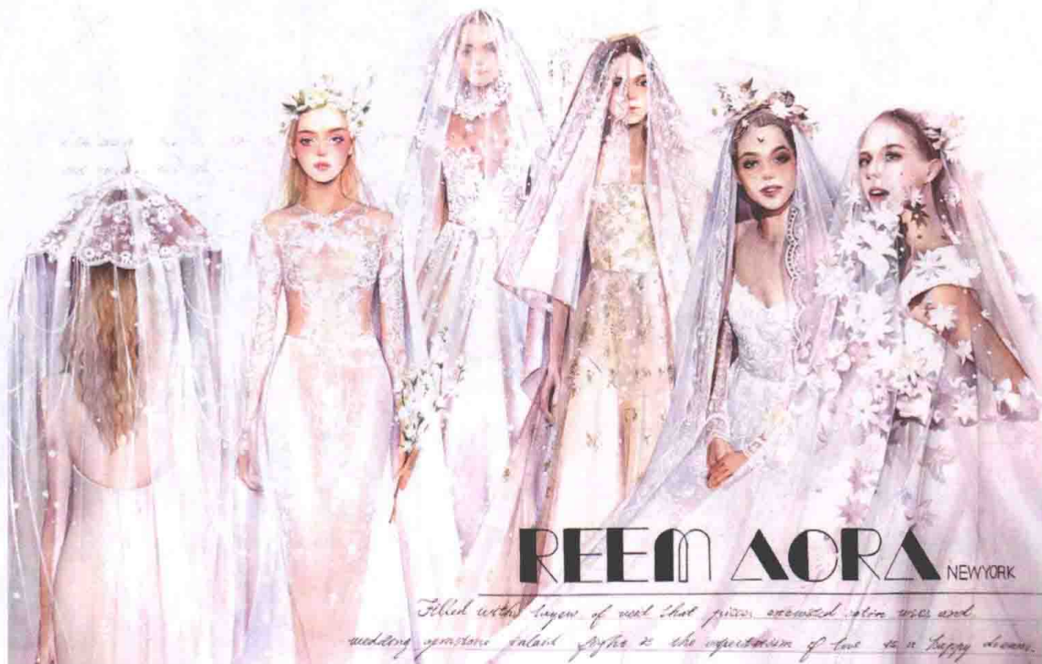
图1-1 时装画（李慧慧作品）

不仅反映出不同时代的穿着方式及穿着理念，还是艺术创作观察、创作体验的深刻感悟，画面形式给人以动人的魅力与美的感受，充满着对艺术生命力的表达，如图1-1所示。