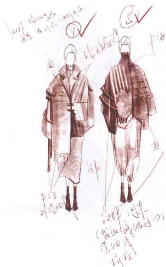
图1-5 时装设计草图(李慧慧作品)