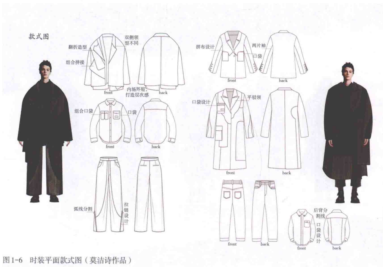
图1-6 时装平面款式图(莫洁诗作品)

时装平面款式图是指服装款式的平面表现图,也称为平面结构款式图,抛开服装的穿着效果,只针对服装款式的比例、结构等进行具体、严谨的表现,目的是指导生产和服装制板。它是服装从打板、裁剪到缝制过程的重要指导依据,也是为了把设计构思交代完整。时装平面款式图中的款式结构、工艺特点及装饰配件等都要表现得极为准确、清晰,还要精准地画出服装正、背面的平面结构图,一些需要特别交代的细小结构如领、袖、口袋、褶裥、省位、明线的宽窄等,还需要另附服装效果图和局部放大示意图,以及面料小样和具体的细节说明,并注以适当的文字说明,便于打板与缝纫制作,如图1-6所示。