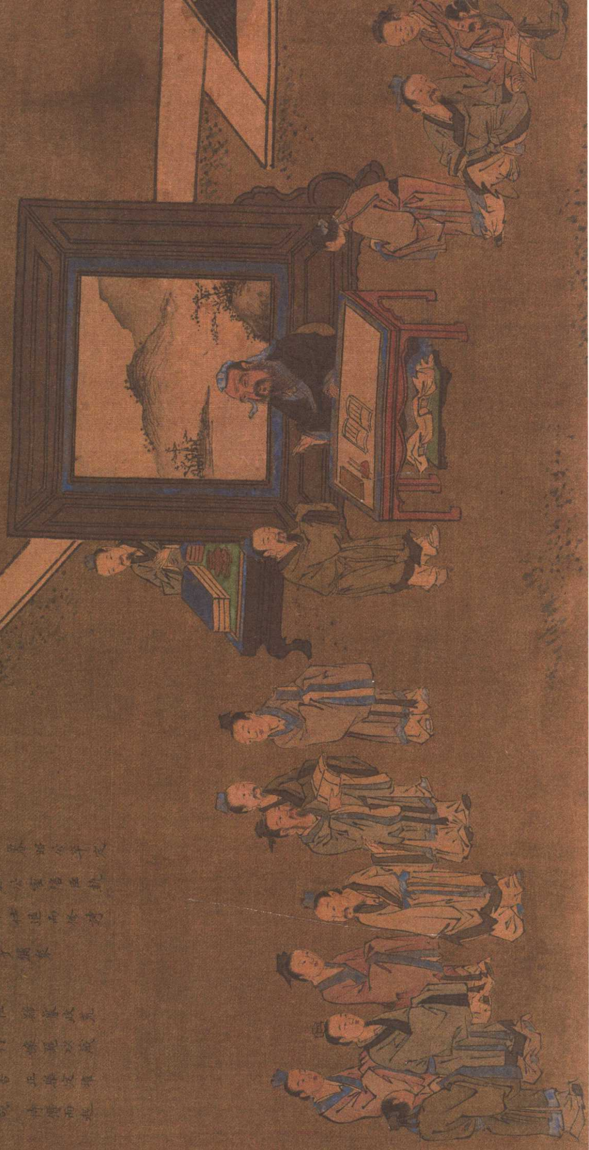
退修《诗》《书》：季氏的行为不合周礼，其家臣阳虎又干预国政，孔子不仕，退修《诗》《书》。

孔子年四十五，居鲁公卒定 公五年，氏季公室信在執 國，季氏不仕，退而修詩 禮記樂春秋 贊曰 道非志，臣節家成荒 直不可行，像死以成 乃修詩書，正樂定禮 治成治成，尚賢而起