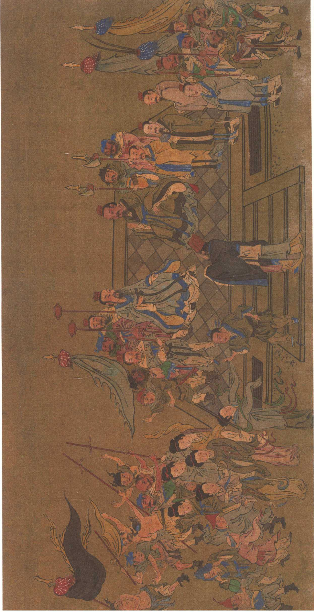
夹谷会齐：齐鲁夹谷会盟，孔子相礼，齐景公心生惭愧，归还了先前侵占的鲁国土地。