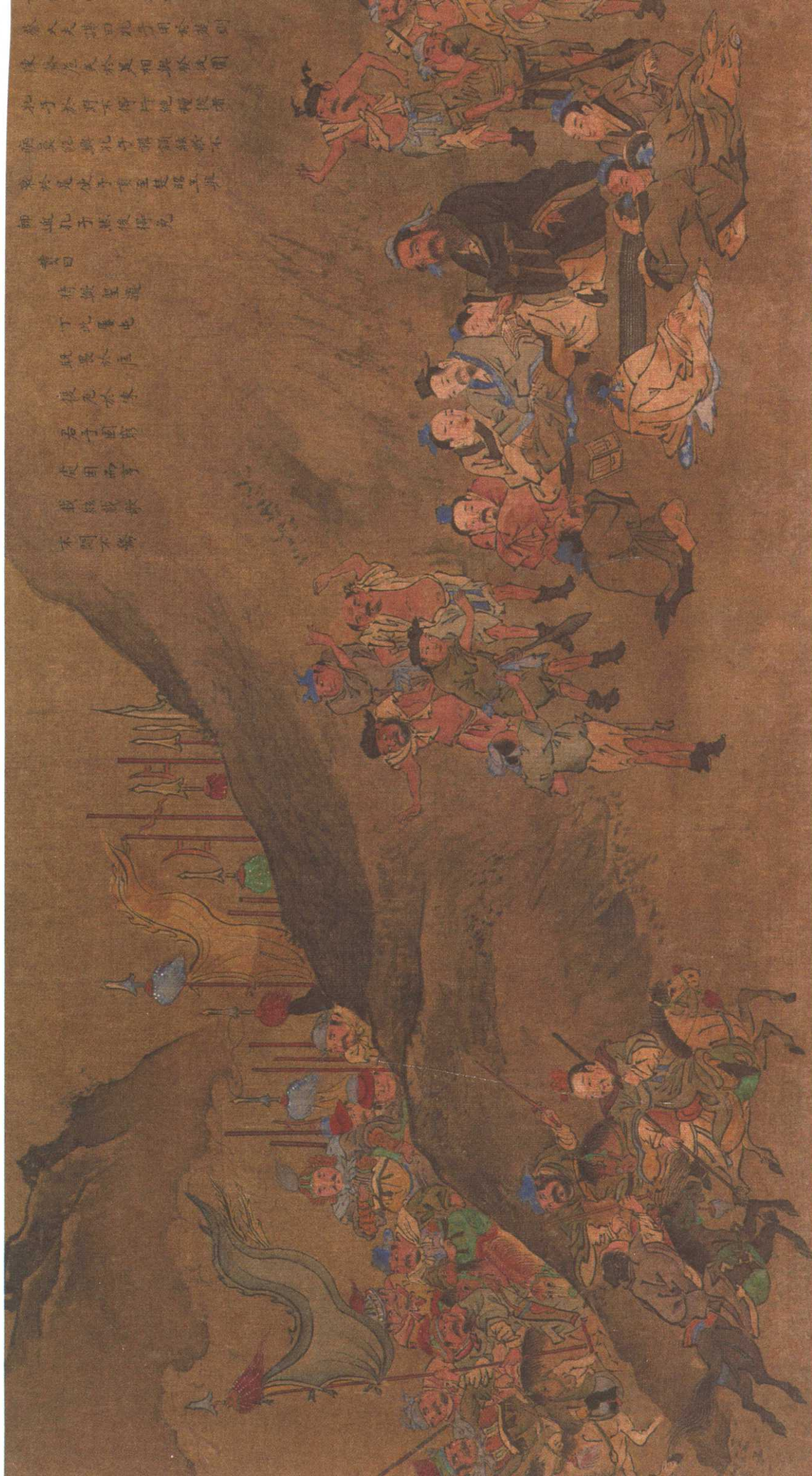
在陈绝粮：孔子路经陈蔡两国交界时，被两国士兵围困，断粮多日仍弦歌不辍。