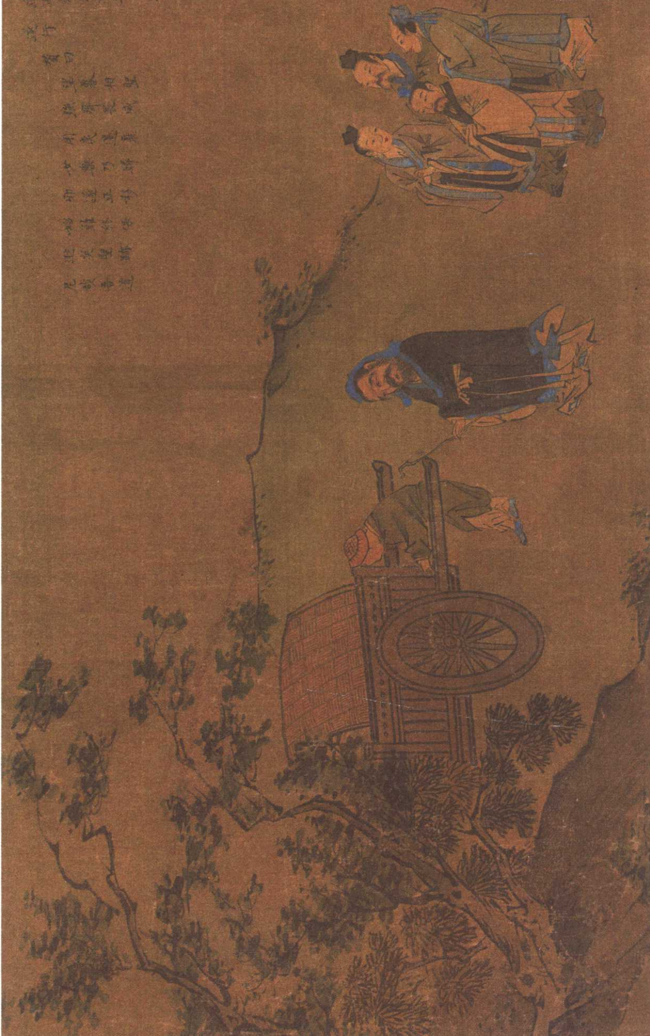
因膳去魯：季氏貪享齊國女樂，三日不聽政，又不依禮分祭肉于大夫，孔子因此离开魯國。