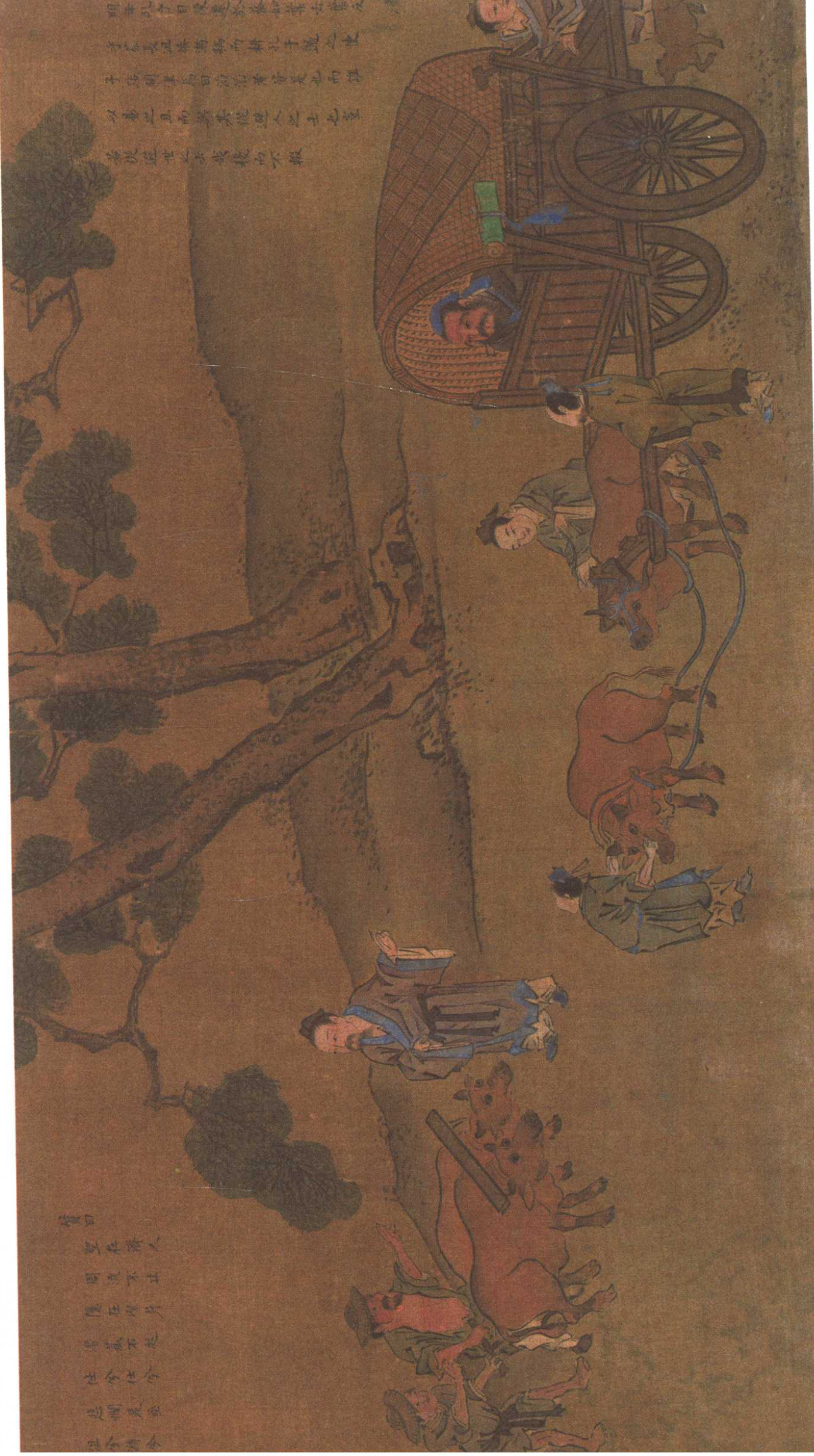
子路问津：孔子返蔡途中，见长沮、桀溺二人耕地，便派子路问路，却被嘲讽。