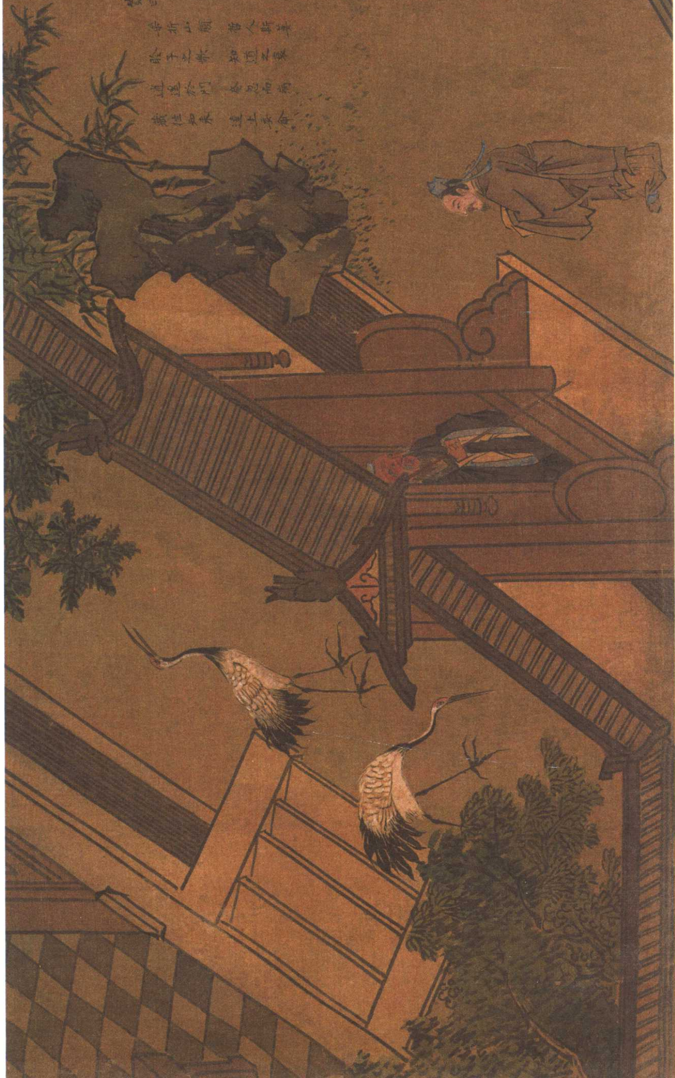
梦奠两楹：鲁哀公十六年四月，孔子生病，梦见自己坐奠于两楹之间，预知死期将至，乃有“泰山其頽”之叹。