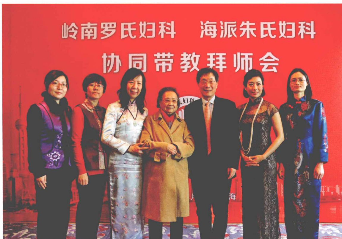
海派朱氏妇科与岭南罗氏妇科协同带教拜师会师生合影