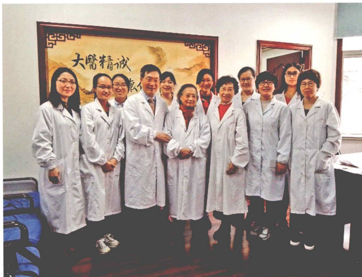
朱氏妇科传承分基地团队合影