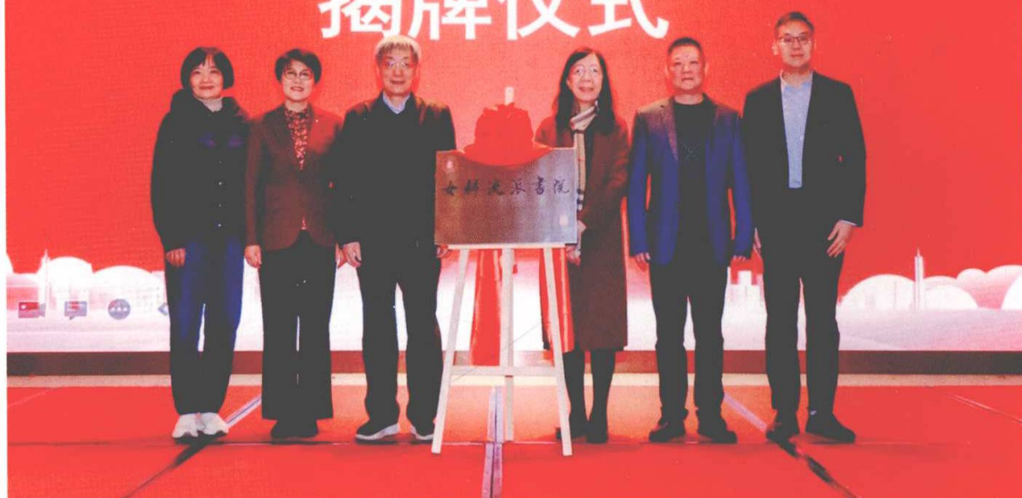
2023年12月在上海成立“女科流派书院”