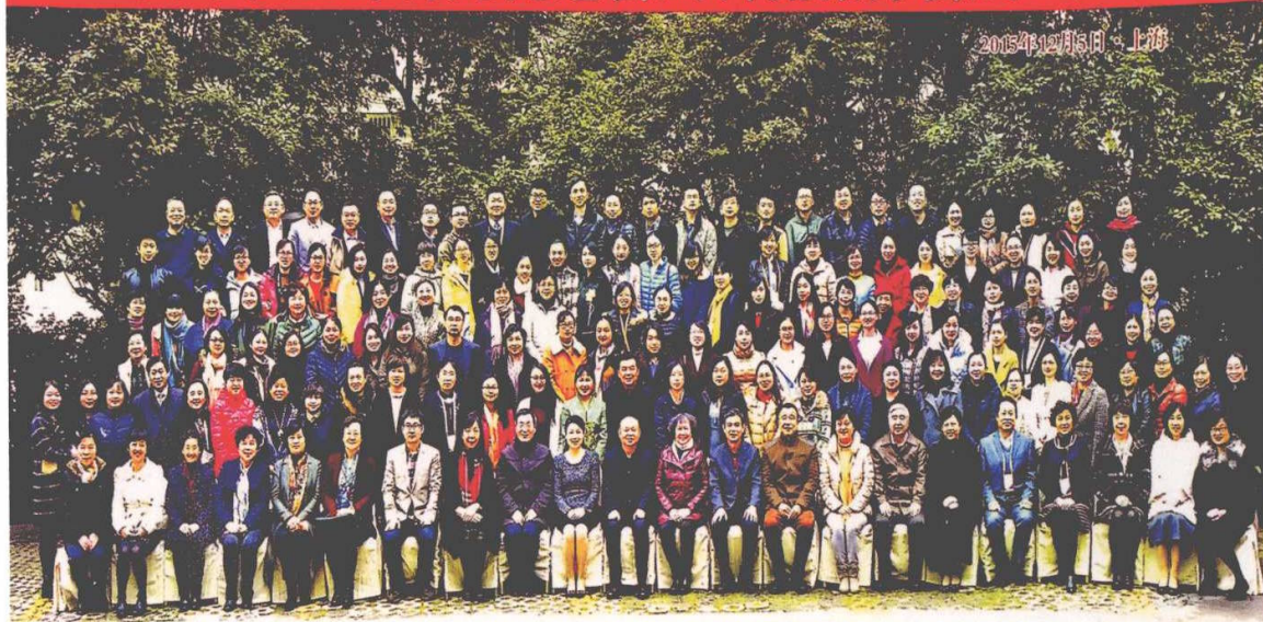
2015年12月在上海召开中国中医药研究促进会妇科流派分会成立大会