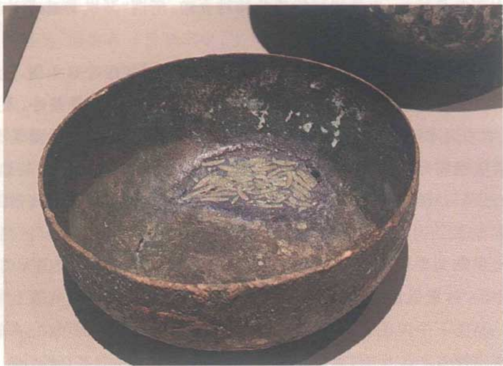
图 1-1 陕西省西安市蓝田县北宋吕氏家族墓园 M12 吕大圭墓出土的铜渣斗

至南宋,吴自牧《梦粱录·鬻铺》云:“盖人家每日不可阙者,柴米油盐酱醋茶。”这可能是最早提及国人所谓的“开门七件事”,可见全民饮茶风俗至迟在宋代已完全确立。及至元代,如杨景贤《刘行首》杂剧曰: