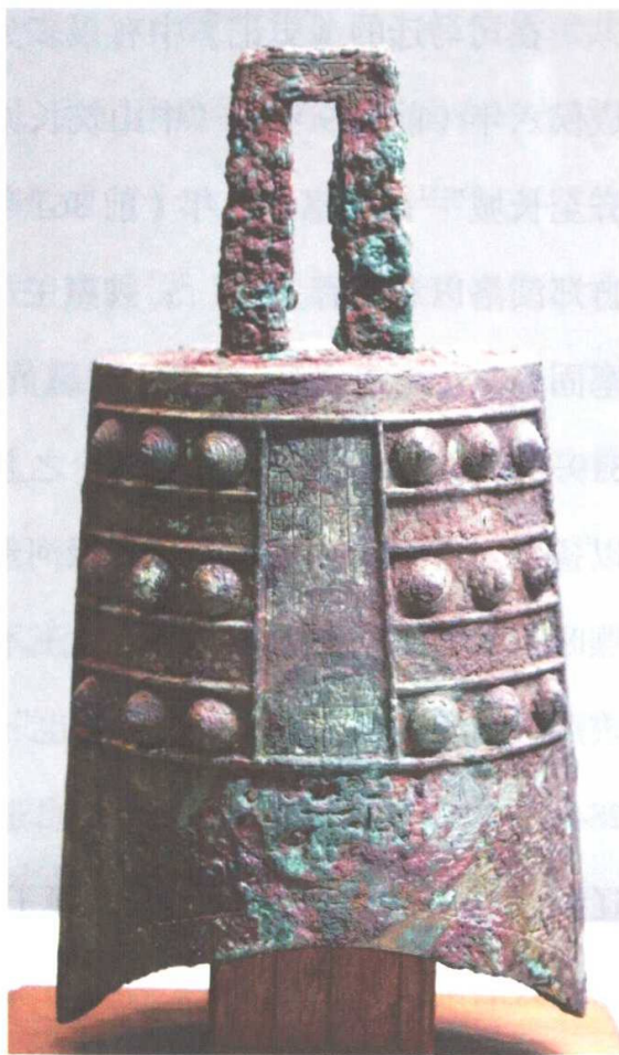
甬羌钟上的铭文中“撤率征秦连齐，入长城，先会于平阴”

天子赏文侯以上闻” 1 。这段文字明确告知后人，魏文侯在位时（前445—前396年）就有齐长城了。而魏文侯俘虏齐侯和自己被封为侯的时间大约是在公元前403年，这可以视为中国最早出现长城的时间。《水经注·东汶水注》引《竹书纪年》说：“晋烈公十二年，王命韩景子、赵烈子、翟员伐齐，入长城。” 2 晋烈公十二年，是周威烈王二十二年（前404年），文中提到了“长城”，这与上面的时间相吻合。其他可以作为佐证的是出土于洛阳金村古墓的甬