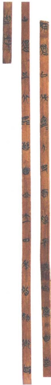
“清华简”是目前已知最早记述“长城”修建史实的竹简 / 资料图片

“长城”一词最早见于史籍记载的是《管子·轻重》篇，文中有“长城之阳，鲁也；长城之阴，齐也” 2 的表述。根据管仲生平和齐桓公在位年来推断，句子中的“长城”指齐长城，其建筑年代应该在公元前 685 年至公元前 645 年之间。由于学术界一般认为《管子》一书是后人托名于管仲的著作，因此还不能断定齐长城是最早的长城。比较可信的记载出现在战国时期秦国丞相吕不韦主编的《吕氏春秋·下贤》篇中，说魏文侯因喜好以礼待士，“故南胜荆于连堤；东胜齐于长城，虏齐侯，献诸天子，