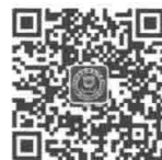
厦门大学出版社 微信二维码