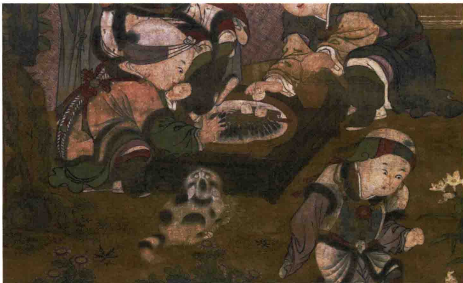
元·佚名《同胞一气图轴》（局部）

夜市美食大抵是我们阅读北宋汴梁的描写时能感受到的最诱人的标签。前面提到，北宋之前，哪怕繁华如大唐，天黑之后也都实行宵禁，一年之中只有几天