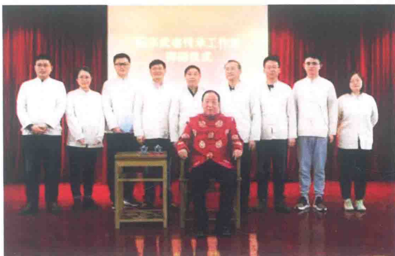
阮宗武传承工作室同志合影