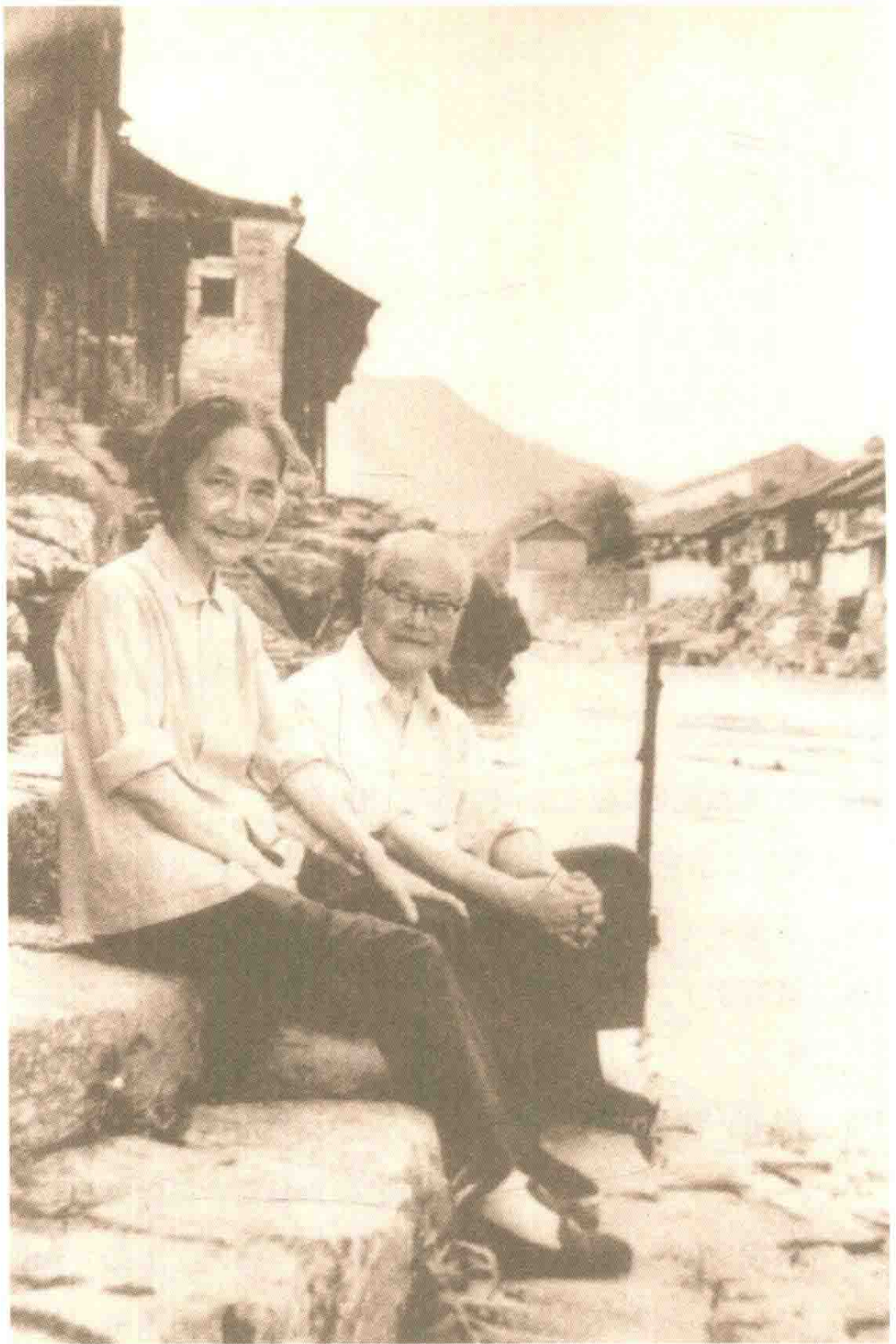
1982年。沈从文和张兆和在凤凰码头