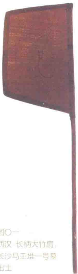
图〇一 西汉 长柄大竹扇， 长沙马王堆一号墓 出土