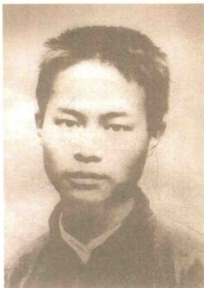
青年时期的沈从文