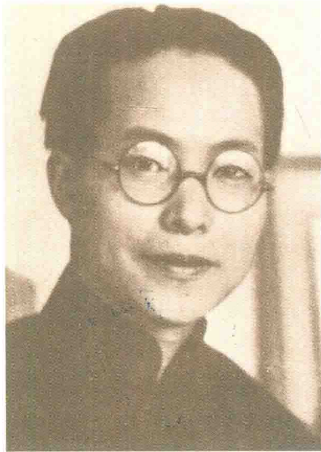
1933年，沈从文在北平留影