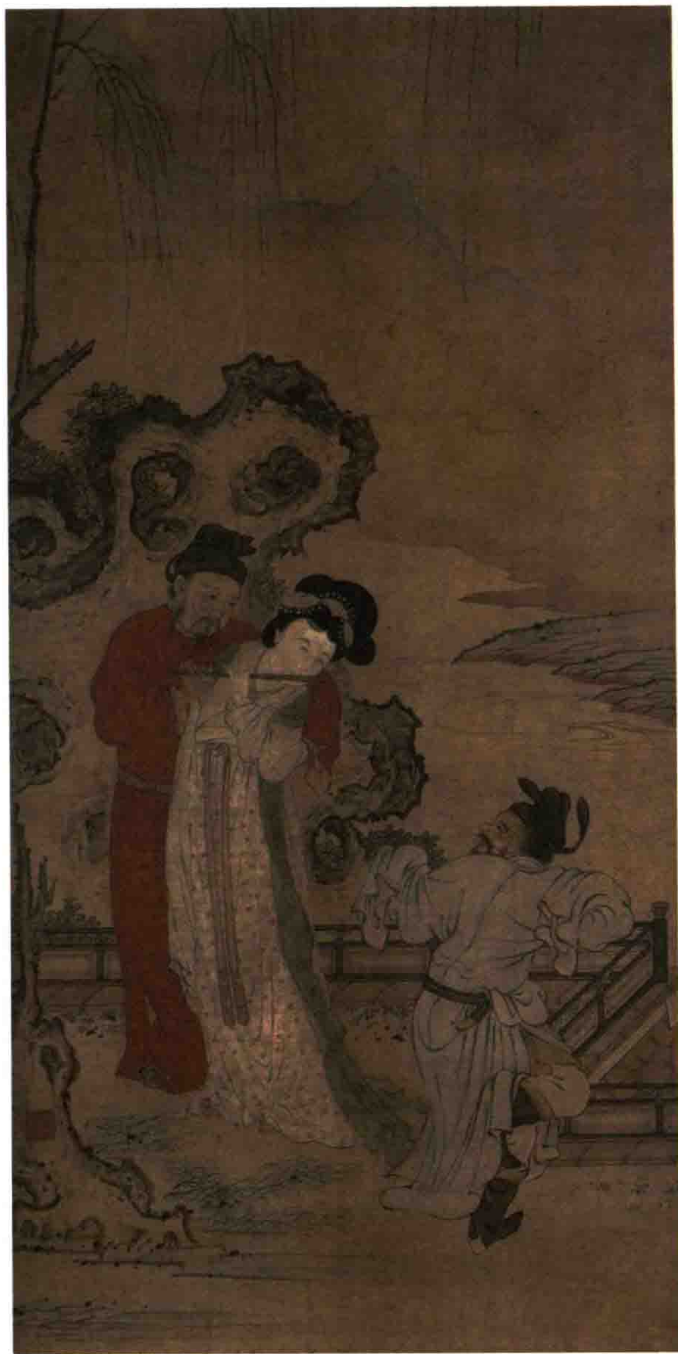
(明) 佚名 玄宗贵妃奏笛图