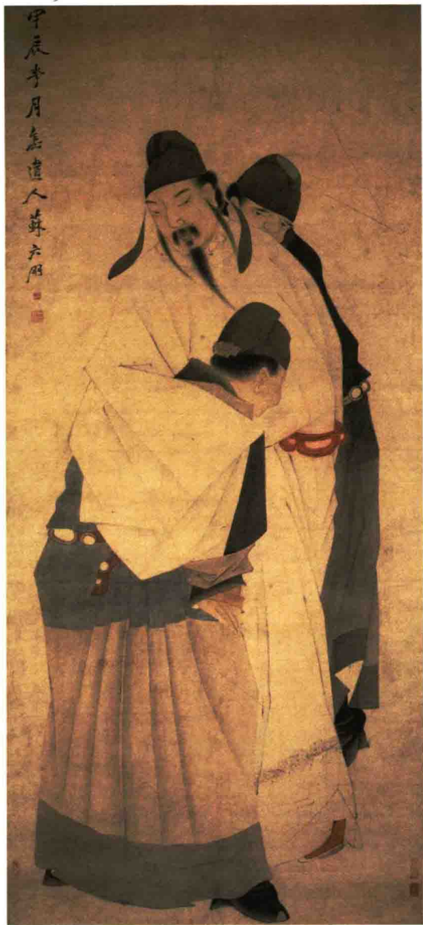
(清) 苏六朋 太白醉酒图