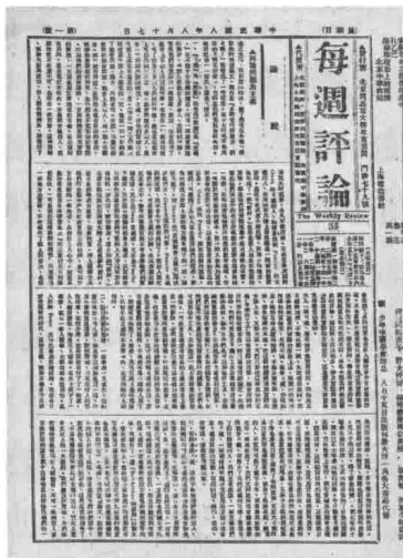
《每周评论》1919年 第35号发表李大钊 《再论问题与主义》

论问题与主义》，胡适照原样刊发在第35期最显要的位置。为回应蓝李二君的文章，把自己的意思说得更明白，胡适又写作了《三论问题与主义》与《四论问题与主义》，分发给《每周评论》第36期和第37期上。可惜的是，第37期被北洋军阀查封，只存第一版。