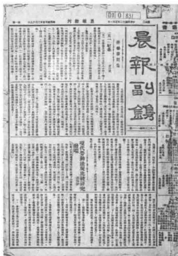
《晨报副刊》第 111 号 (1923 年)