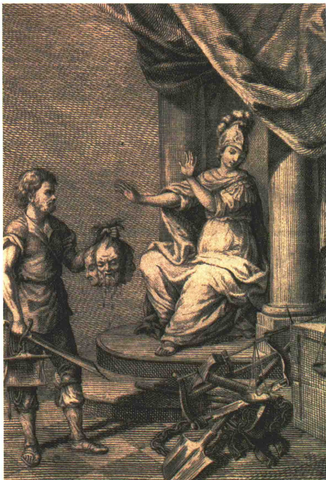
■ 1776年版《论犯罪与刑罚》( Dei delitti e delle pene )的扉页图片。