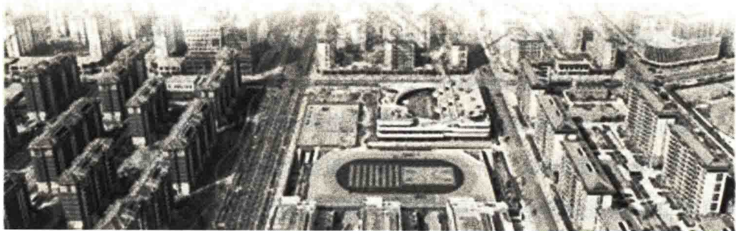
雄安新区容东片区。