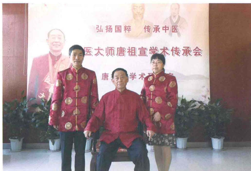
两位作者拜师唐祖宣国医大师留影