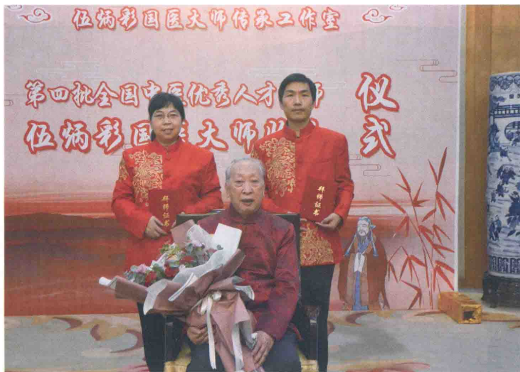
两位作者拜师伍炳彩国医大师留影