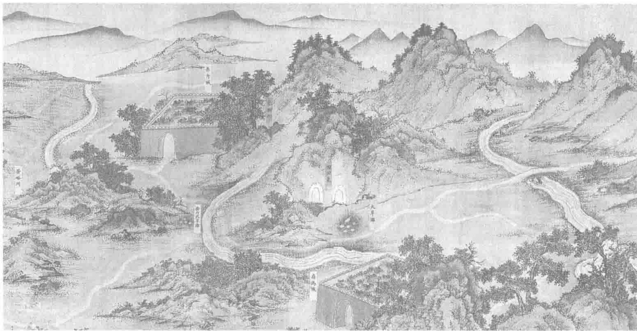
图1-3 明，佚名，《丝路山水地图，蒙古山水地图》，明内府绘，绢本设色，590 mm×30 120 mm，故宫博物院藏