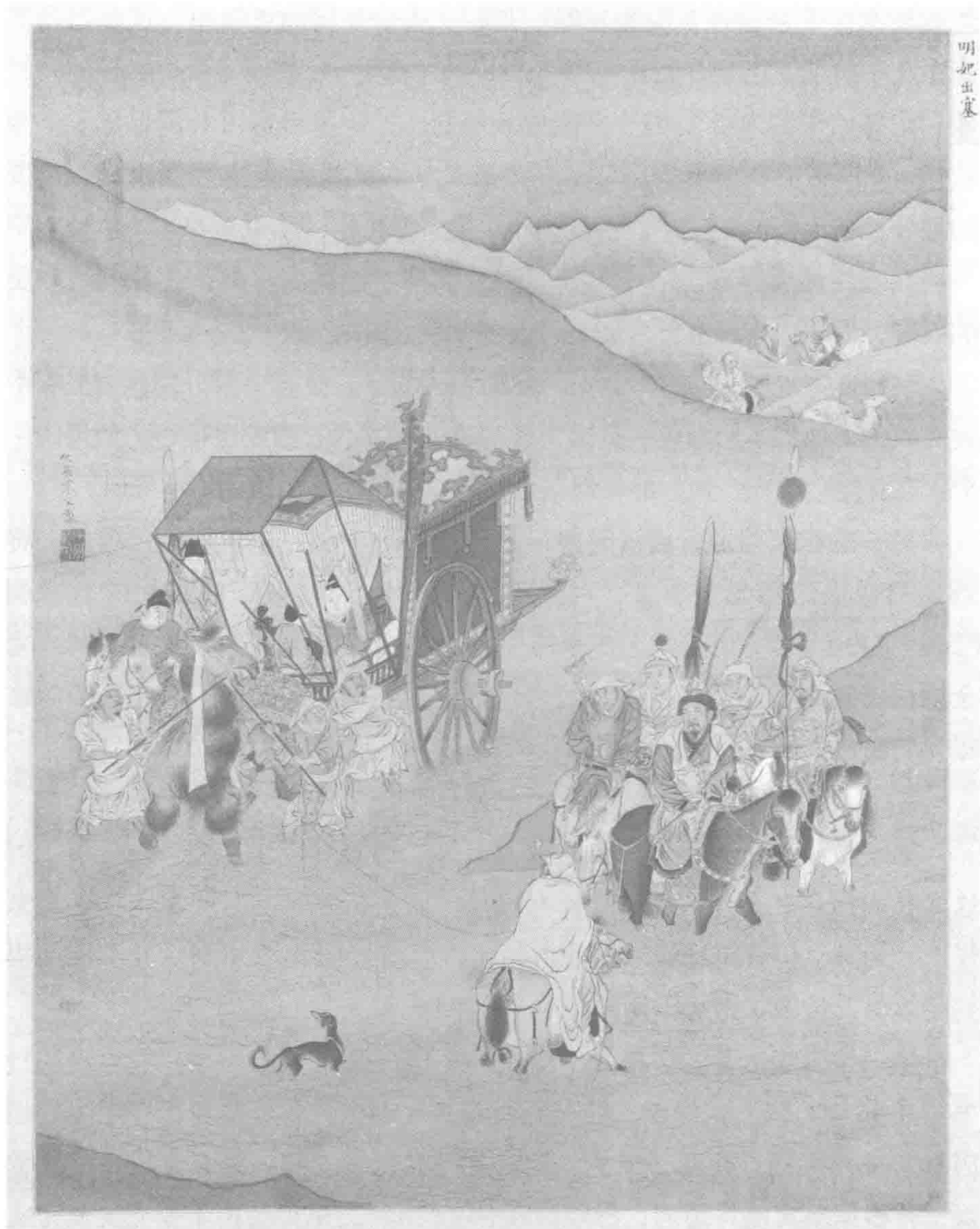
图1-4 明，仇英，《人物故事图明妃出塞》，绢本设色，414 mm×338 mm，故宫博物院藏