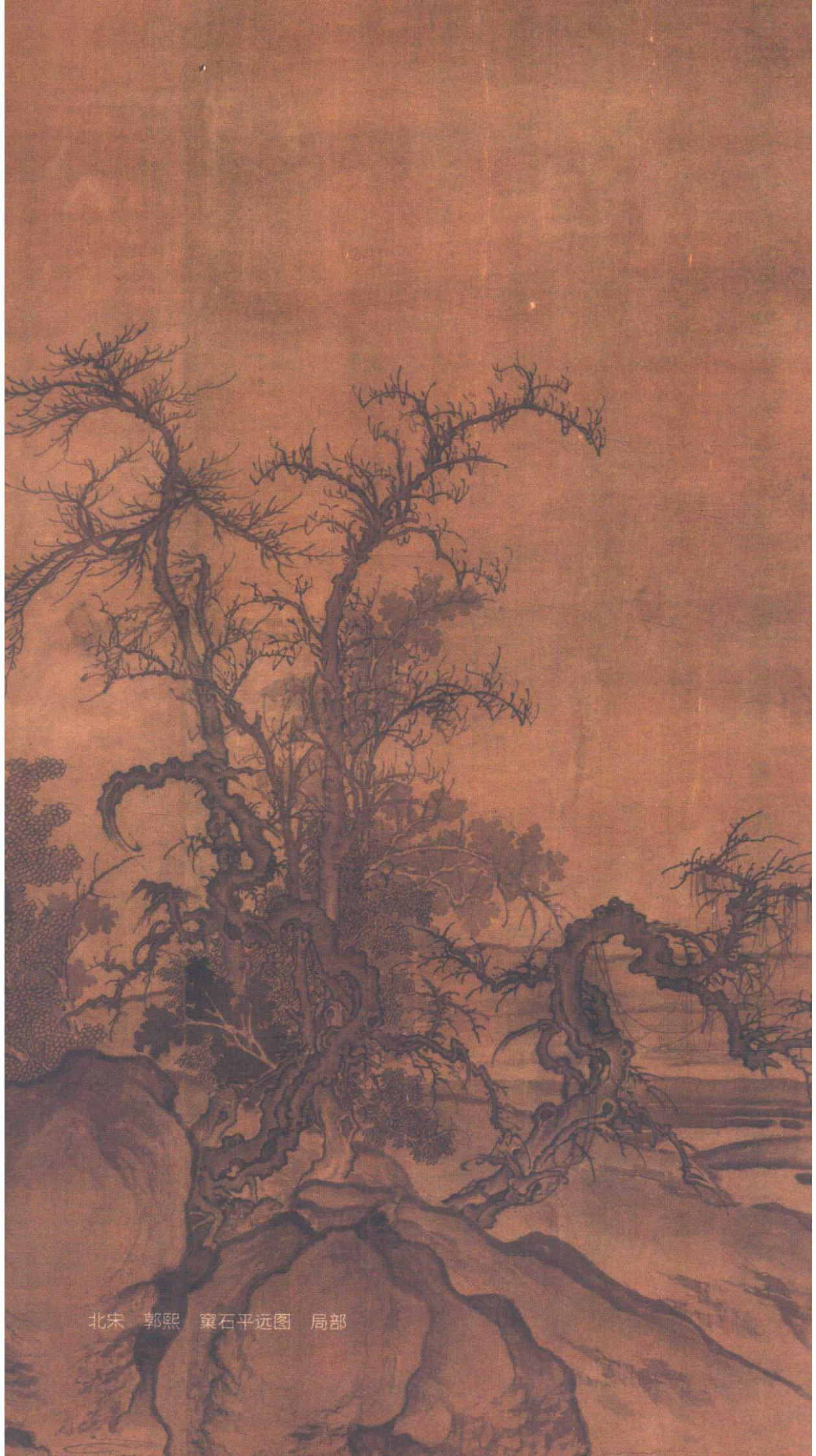
北宋 郭熙 窠石平远图 局部