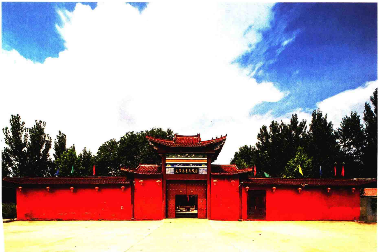
下 / 炎帝陵山门