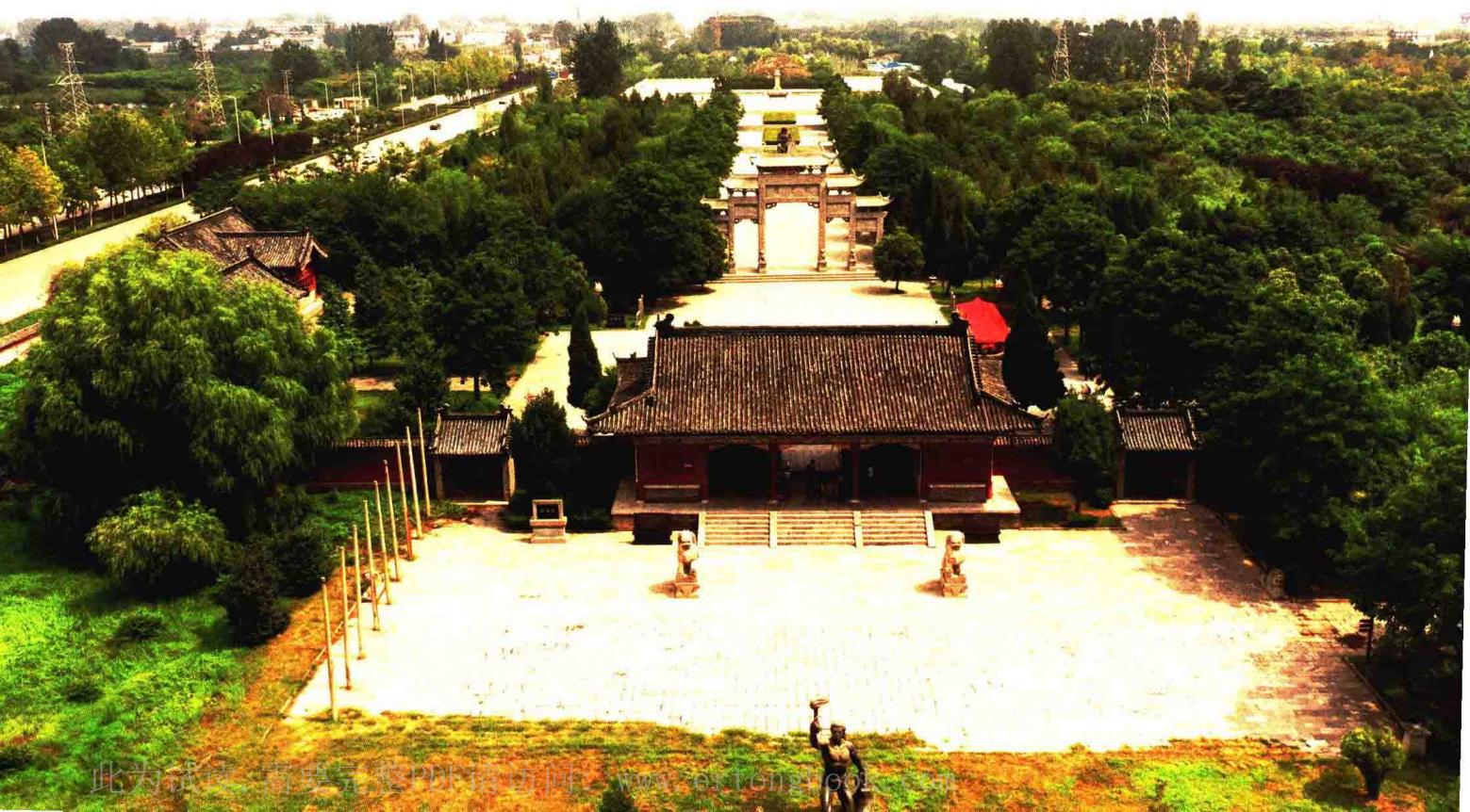
下 / 燧皇陵全景