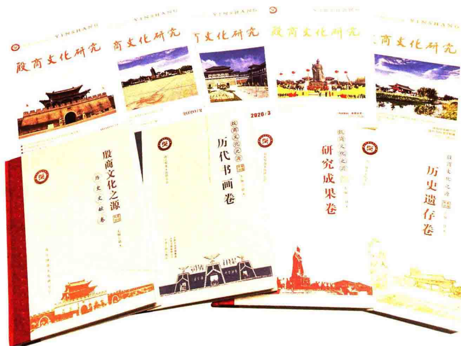
商丘殷商文化研究资料