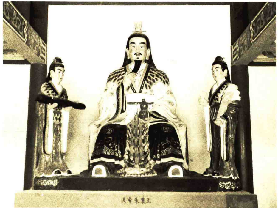
上 / 炎帝朱襄氏塑像