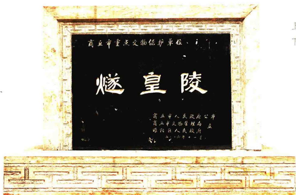
上 / 重点文物保护单位标志碑