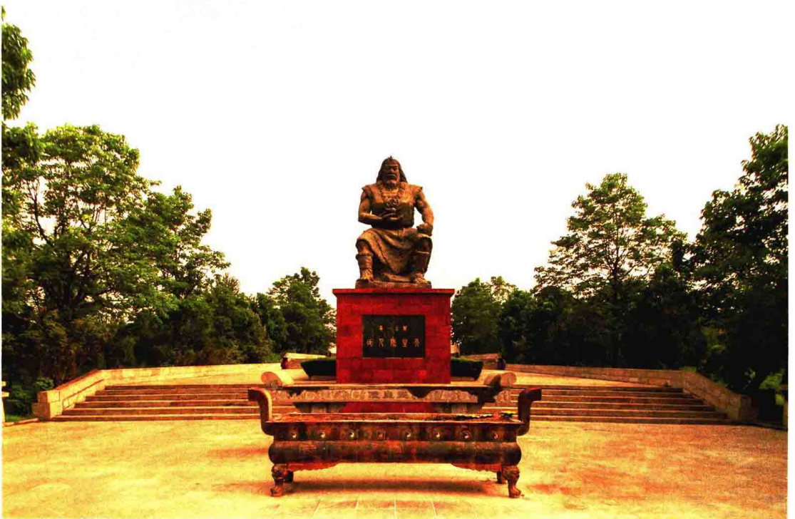
上 / 燧皇陵牌坊 下 / 燧人氏雕像