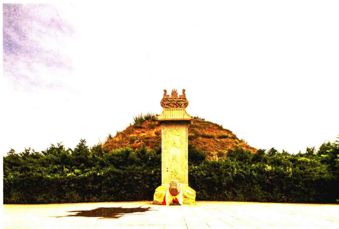
上 / 燧皇陵山门