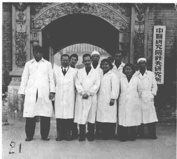
与针灸研究所同事