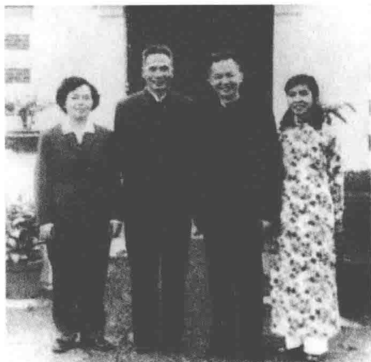
1962 年与越南前总理范文同在总理府合影