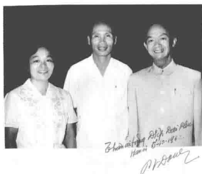
与越南总理范文同合影