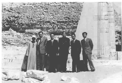
1958 年在也门医疗工作队 (右二)