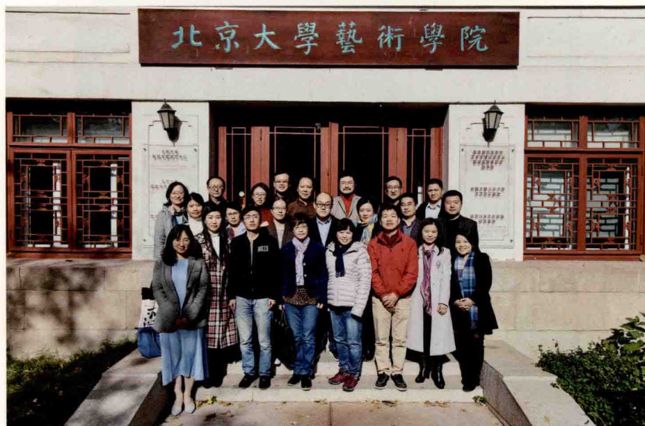
第四届首都戏曲研究青年学者读书会合影(2019年11月10日)