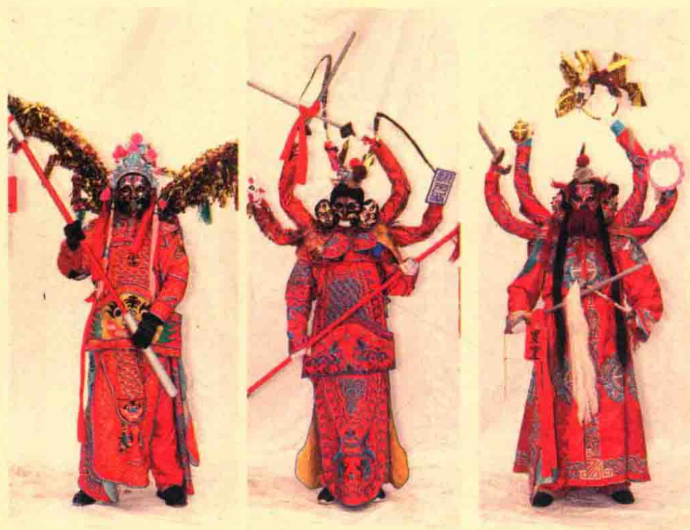
陇县社火人物，从左到右依次为雷震子、殷郊、罗宣、哪吒、姜子牙、陈友谅 2019年

社火不仅是年节当中一种大型的民俗活动，更重要的是社火通过艺术的方式，呈现出一种戏剧性的历史感，使年节的民俗文化内涵有了厚度，也有了伦理教化的故事。如今乡村里的日常生活是简单平淡的，随着一